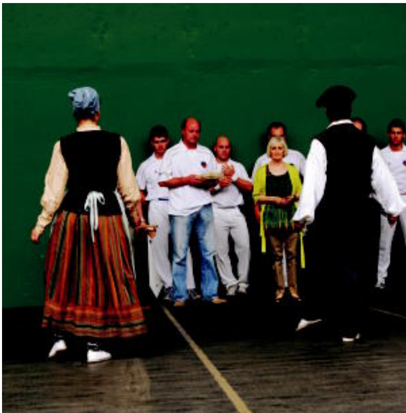
Oinkari dantza taldekoek Agurra dantzatu zuten, udaleko eta federazioko ordezkarien aurrean. SARA GOMEZ