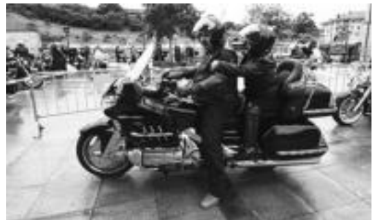
Arbizu aldera atera ziren igande goizean motorzaleak.