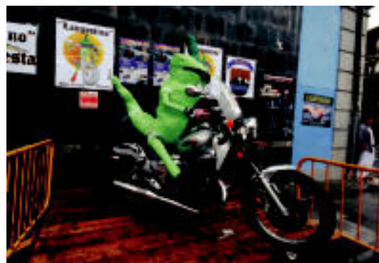
Ibarrako piperra ere moto gainean ikusi ahal izan zen. SARA GOMEZ

LEITZA Herenegun jokatu zuten Nafarroako Herri Arteko Txapelketako finala Iruñaren aurka 4-5