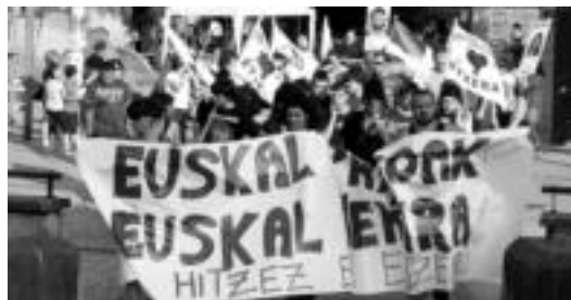
Jende asko bildu zen atzo Ibarren manifestazioan.