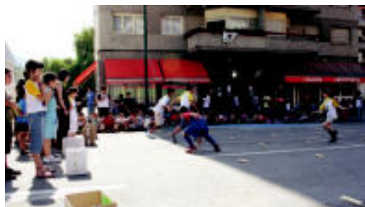
Gazteak gustura aritu ziren jolasean, atzo arratsaldean. I.T.

TOLOSA Voith-Gorostidiko etxebizitzaren zozketa errepikatu beharra izan zuten akats batengatik > 6