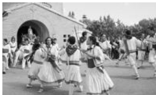
Danzantes de Gurrea dantza taldekoak Tolosan izango dira gaur.

Iluntzean hartuko dituzte hiriko kaleak, dantzariak. Hasteko, 19:30ean aterako dira, eta Alde Zaharretik barrena kalejiran ibiliko dira. 22:30ean berri, Plaza Be-