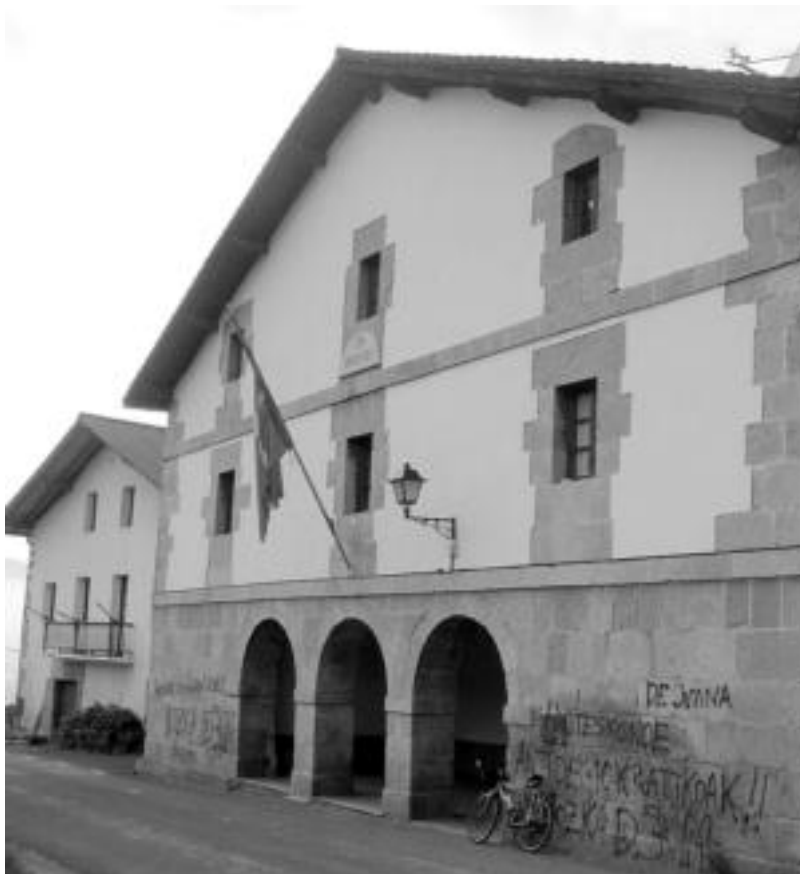
Laugarren ibilbidean Gaztelu bisitatzeko aukera izango da, besteak beste.