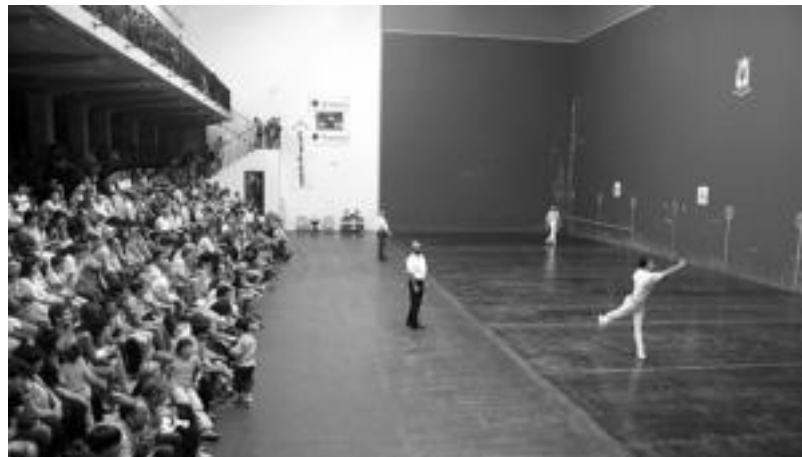
Ikusmina sortzen du Amezketako pilota txapelketak: irudian, iazko nagusien arteko finalerdian. A. OTEZABAL

Horrez gain, joko sistema ere aldatu dute: orain arte ligaxkan jokatzen zuten pilotariak baina aurten irabazten duenak aurrera egingo du, beste txapelketatik kanpo geldituz. «Herriarteko Txapelketa koaren berdina egingo dugu: bi partida irabazten dituen herriak edo klubak aurrera egingo du».