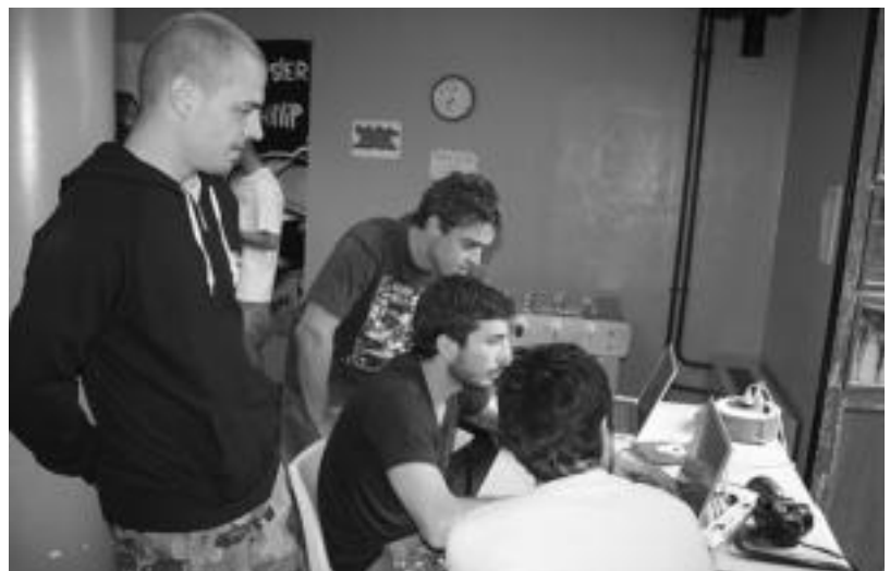
Atzo Kultur Etxeko Gazte Topagunean egindako tailerreko une bat. I. GARCIA