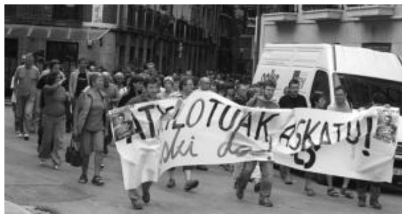
Atzo Tolosan egindako eskualdeko manifestazioan 200 lagun inguru izan ziren.