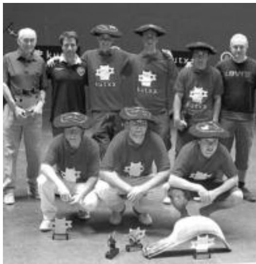
Beotibar Zesta-Punta elkarteko kideak sariekirin. HITZA

Ez zen bi taldeak elkarren aurka final batean lehiatzen ziren lehen aldia; besteseitxandatan ere, bitalde hauek iritsi baitira finalera. Igandekoa, beraz, elkarren aurka