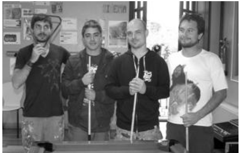
Tolosan dauden Doma eta Fase taldeetako kideak. I. GARCIA

Partaide guztiak diseinu grafikoko ikasketak dituzte eta honek duen kutsu komertzialetik irteeteko bide bezala ulertzen dute aurrera daramaten ekimen hau. Tourra egin, gustoko gauza egin, sormena lantzeko aukera dute. Beraiek dioten bezalaxe, «arte gauza orotan aurkitzen baita».