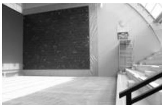
Bearzana frontoi berria Subijana etxearen atzean dago. R. CALVO

Udalak interesatuei dekretua «bete dezatela» agintzen die. Horrela gertatzen ez bada, dagokin zigor-prozedura bideratuko duela azaldu du, «isun egokia ezarritik».