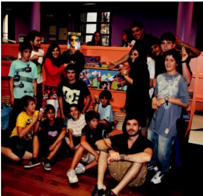
Argentinarrak gaztetxoekin aritu ziren atzo, Kultur Etxean. A. IMAZ