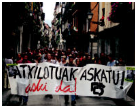
200 lagun inguru bildu ziren manifestazioan. A. IMAZ

TOLOSA Atzo egin zuten Leidor aretoan; 572 eskatzaile izan ziren, 79 etxebizitzentzat 4