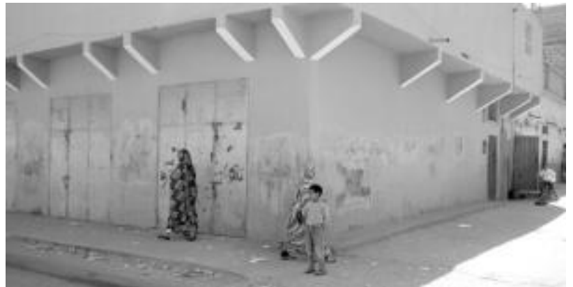
Sahararrek Sahararen aldeko pintaketak egin eta segituan estaltzen ditu Marokoko polizia. G. EIZAGIRRE

Ezagutzeko geratzen zitzairen errealitatea, beraz, gertutik ikusi dute, eta horrela aspalditik buruan zuten bidaiari burututa, «oso gusturara» itzuli dira etxera.