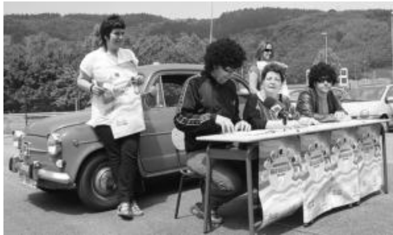
Garagardo Azokako antolatzaileek festarekin bat eginez 70. hamarkadako itxura hartu zuten.