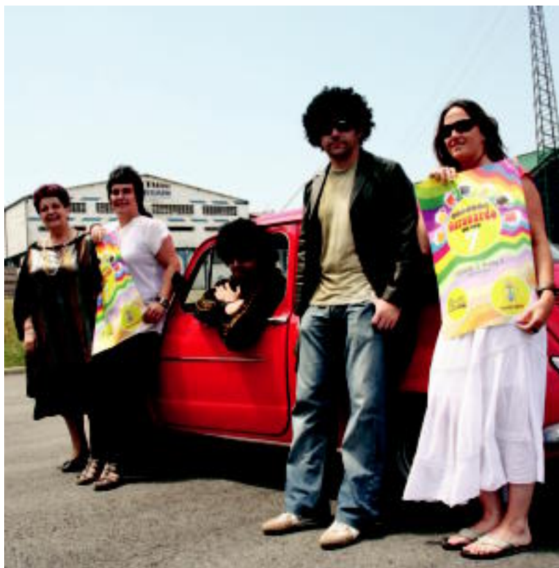
Frontoian izango da Garagardo Azoka; atzo egin zuten aurkezpena 70. hamarkadako itxurarekin. N. URBIZU