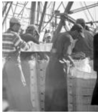
Eszerrean marokoar arrantzaleak. Eskuinean fosfatoa garraiatzen portutik. G. EIZAGIRRE