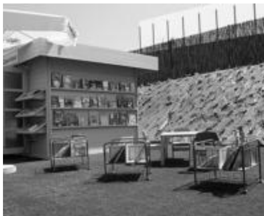
Gaurtik aurrera liburutegia erabili ahaliko dute Usabalgo solairumean. E. EZEIZA