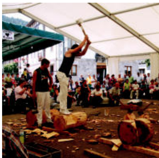
Atzoko jubilatuen egunean, herri kirolak izan ziren, besteak beste. N. URBIZU

TOLOSA EA utzi eta Alkarbide alderdi berriaren lerro ideologikoari heltzea erabaki dute biek 2