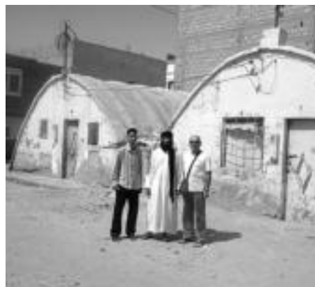
Sahara Espainiaren pean egon zen garaiko etxebizitzak eta eliza bat. G. EIZAGIRRE