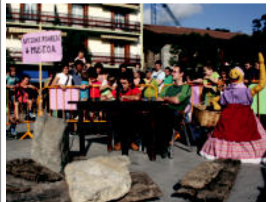
Atzo egin zuten agerraldia hainbat ibarretan. r.c.

IBARRA Aurten ere Bartoloak antolatu dituzte, «gauzek bide beretik» jarraitzen dutela salatzeko 6