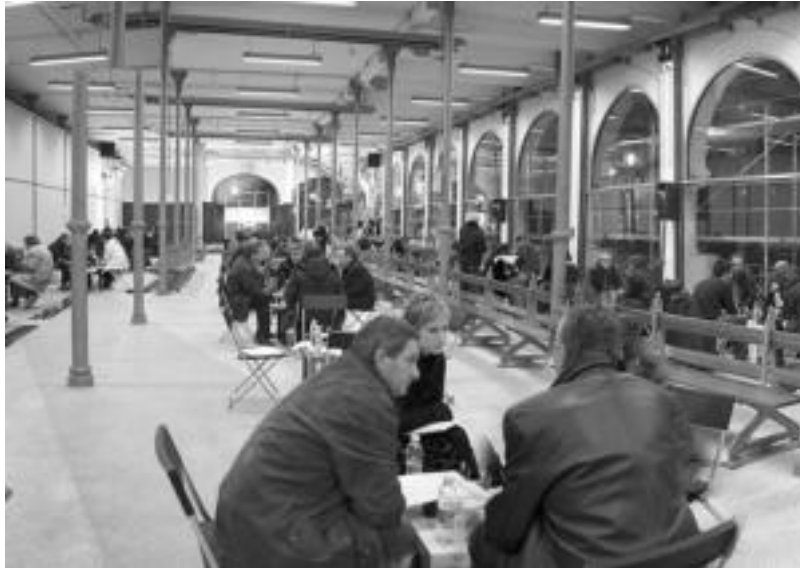
Herritarren parte-hartzea sustatzeko asmoz Udalak antolatutako beste ekimen bat World Kafea izan zen. HITZA

Udalekoak azaldukoaren arabera, «koherenteak izanaz, modu orokor eta bideragarri bat proposatzen dugu» araudiaren lehen eredu. Honek iraupena ziurtatu behar baitu. Bestalde, argi uzten dute, batzorde hauen lana aholkulari-