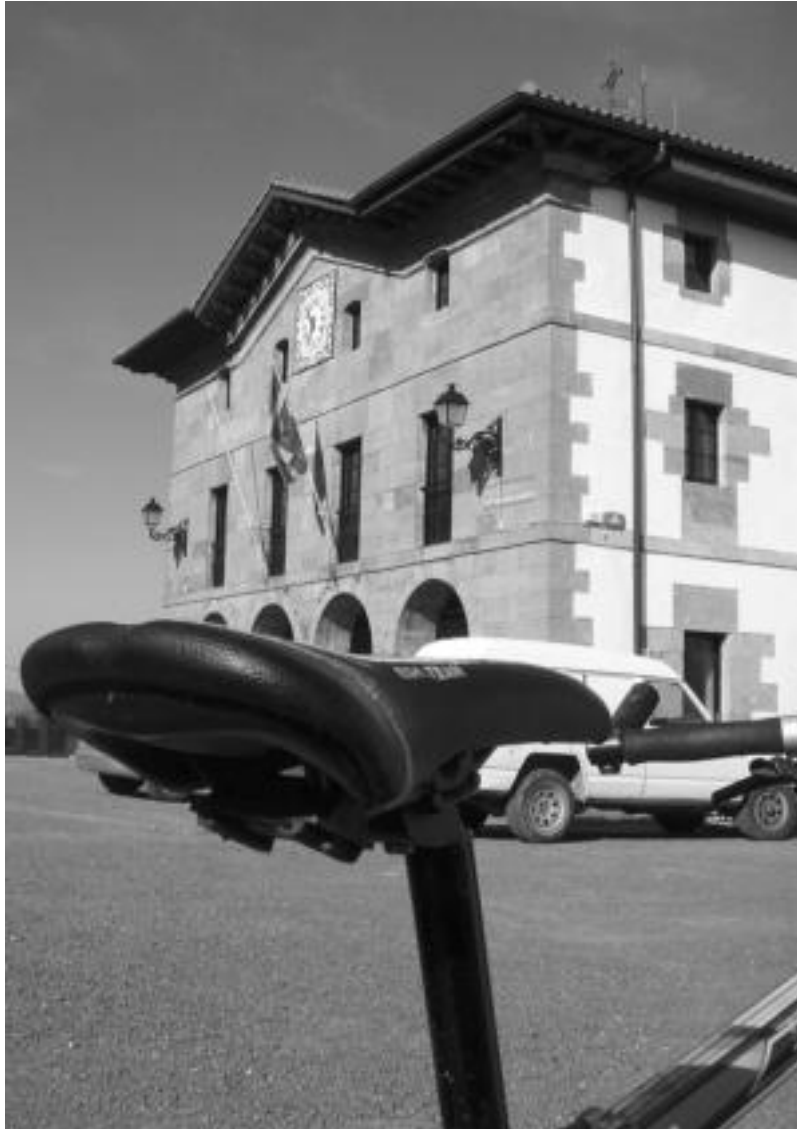
Hirugarren ibilbidean Hernialde bisitatzeko aukera izango dugu, besteak beste.

errebuelta itxian hasten da aldapa handia. Aurreraxeago Asteasuren ikuspegi ederra izango dugu, goitik behera begiratuta. Aldapak jarraitzen du, baina bada atsedean hartzeko zelaiune txiki bat. Koldobika Jauregi eskulturgilearen baserri-tailerra pasa eta aldapa handia dugu berriro herriaren kaskoraino. Hemen bidegorria dagoela esan daiteke, errepidea gorritz margotuta baitago. San Martin eliza, udaletxea, eskola, barnetegia eta 1957ko frontoia (eskualdeko