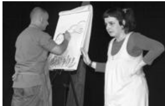
Sei talde ariko dira Antzerki Astearen barruan.