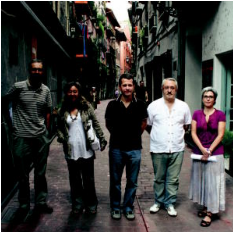
Alde Zaharreko batzorde mixtoak bultzatuta, uztailean bilduko dituzte datuak Erretengibelen bulegoan. i.r.