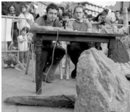
«Utzikeriaren Museoan» irudikatutako plazan egindako agerraldian. R. CALVO

Oraindik ere «ibartar guztiok ordezkatzeko gaituen» Udalik ez dutela osatu ere esan zuten eta ondorioz «herriko gune nagusienean 710 ibartarren bazterketa gainditzeko ez dugu inongo pausurik emango?» galdetu zuten. «Hitz politak erantzuten dituzte, baina bost zinegotzi lapurrek ez dagoz-