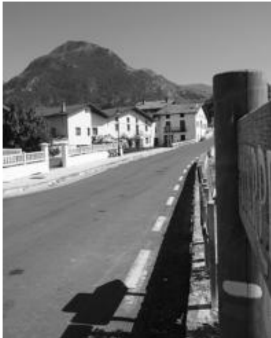
0 kilometrotik abiatuko dira Senperena eta Lasa, Abaltzisketatik. N. URBIZU

«Bakoitzak zein zati egingo duen zehaztuta daukagu, eta Txindokirako bidea birritan egin