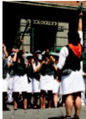
Trianguloan eskopetariaren konpainiak euren lana egiten. N. LATAURU