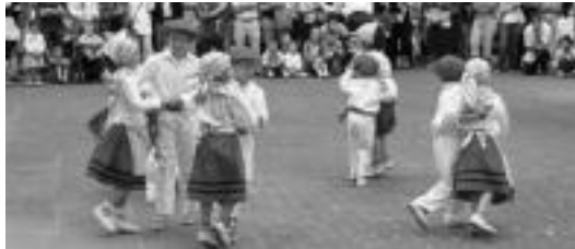
Herriko dantzariak urtero eskaintzen dute emanaldia Leaburun. A. OTEZABAL

Jaiak » Sanjoanekin agurtu dute udaberria herri askotan eta beste batzuetan sanpedroekin emango diote hasiera udari.