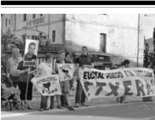
Kartelak jarri zituen Tolosako AAMk herenegun Arrameleko zubian. HITZA