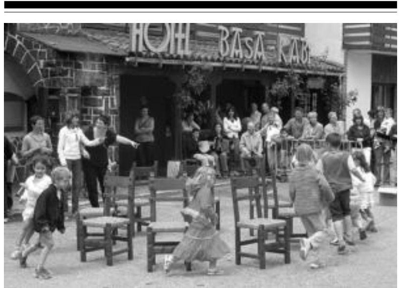
Leitzako Gorritzaren auzoan jaiak ospatuko dute hilaren 28an. Ume jolasak goizean ospatuko dituzte. NAIARA GARZIA