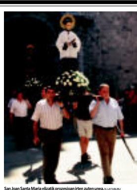
San Joan Santa Maria elizatik prozesioan irten zuten.