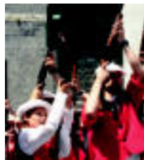
Gazteak ere gogotsu aritu ziren eskopetarekin. N. LATAURU