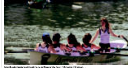
Ibarako Arraulariak izan ziren nesketan garaile batel estropaden finalean. N. LATAURU