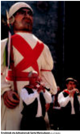
Erraldioak eta dultzaineroak Santa Maria plazan.