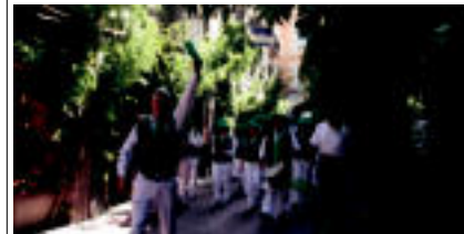
Eskopetariaren konpainiak Añan Zaharreko kaleak igaro zituzten txistu eta tiro hotsak lagundurik. N. LATAURU