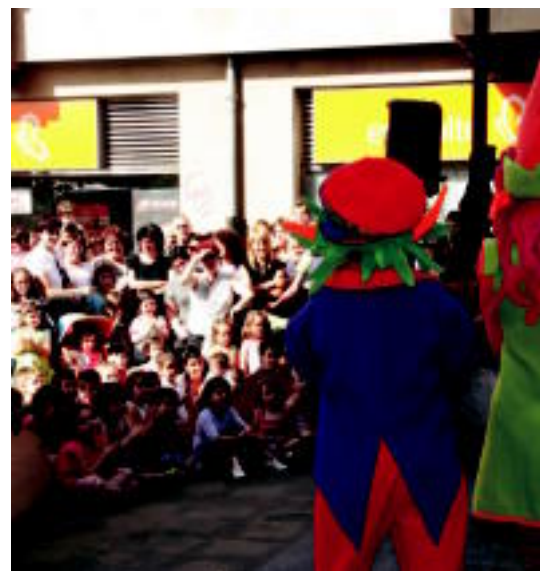
Atzo Xurdin, haurrentzako ikuskizuna izan zen Tolosan.