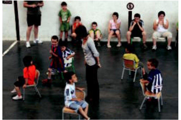
Atzo arratsaldean, bertso jaialdia izan zen Zerkausian; Abaltzisketan berriz, goizean, haurrentzako jolasak izan ziren herriko pilotalekuan. E. EZEIZA