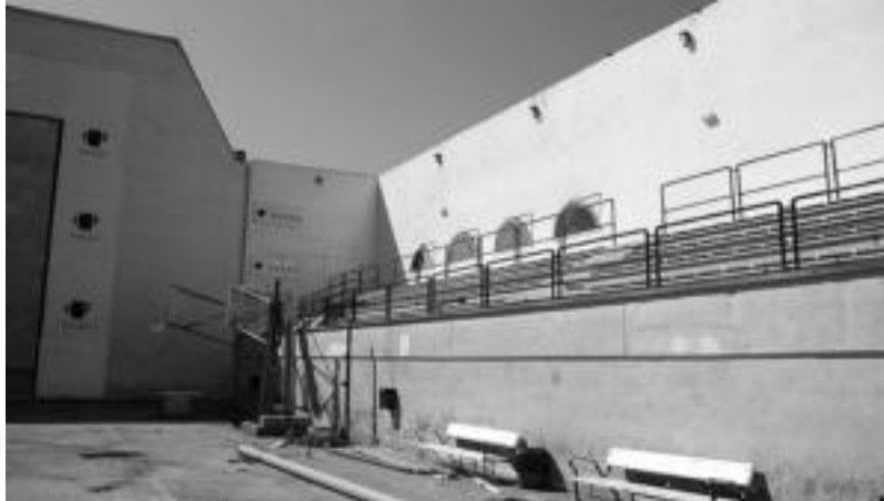
Pilotalekuak ez dauka teilaturik eta berriak egurrezko egiturak izango ditu, besteak beste. N. URBIZU

Frontoia, gimnasioa eta aldage-lak ezin dira erabili, iraila erdialde-