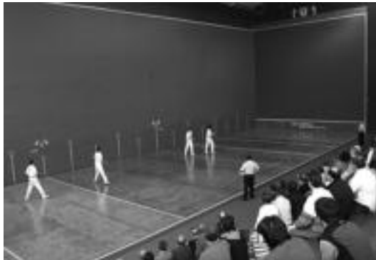
Amazabal pilotalekuan Herri Artekoaren partidak jokatu dira berriro. I.L.

Lezea-Eskudero 6-18 galdu zuten eta Garcia-Iriartek 20-22.