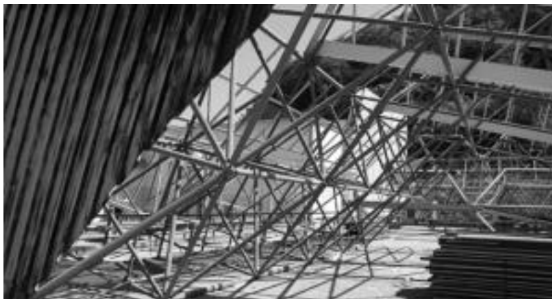
Egitura zaharra futbol zelaian utzi dute eta aurki kenduko dute bertatik. N. URBIZU

ra edo bukaerara arte. Printzipioz, Kultur Etxeko instalazio guztiak normal erabili daitezke.