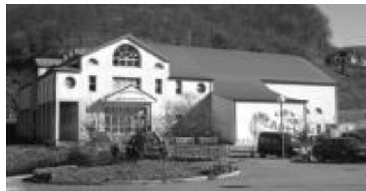
Teilatuaren itxura berria hau izango da. HITZA

Orain arte, pilotalekuko zoruari hainbat kirol egiteko behar diren mugak zehaztuta zeuden margoak, baina kirol zinegotziak adierazi duenez, «hemendik aurrera saskibaloian aritzeko eta areto futbollean aritzeko murrak margotuko dituzte».