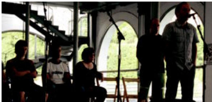
Goian, Abaltzisketan jolasean. Behean, Tolosan, Zerkausion izan zen bertso jaialdia. ESTI EZEIZA