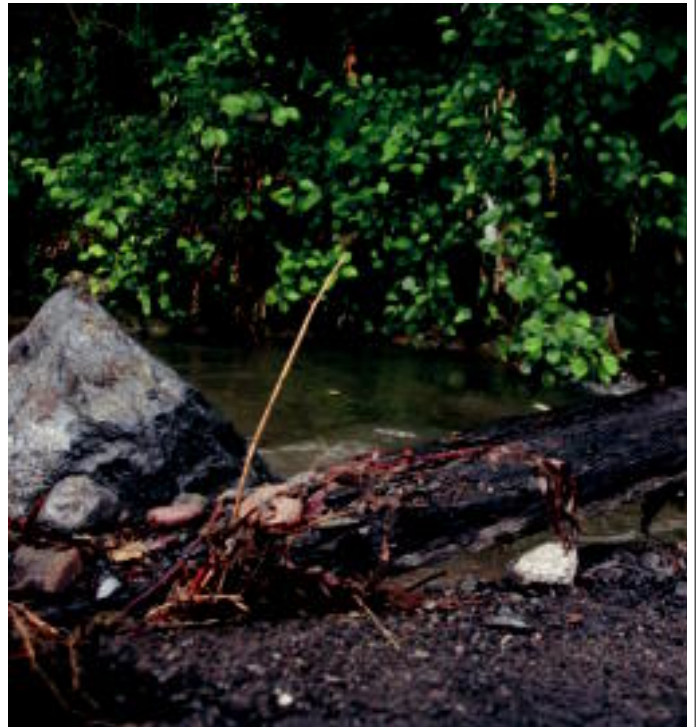
Hauxe da kolektorearen obrak direla eta XVII. mendeko labaderoen oraingo itxura. R. CALVO