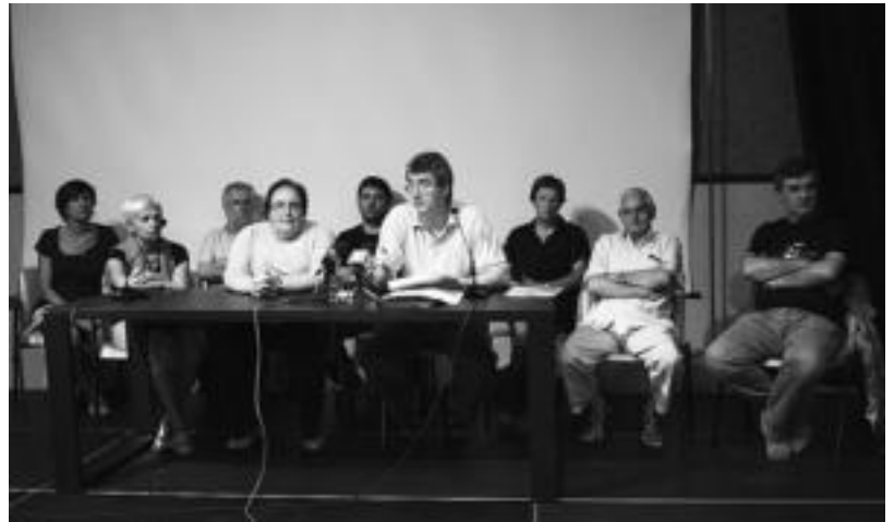
Zahartzaro Duina plataformako kideek herenegun egin zuten agerraldia. I.T.

Plataformako kideek diotenaren arabera, «Udalak bere burua derrigortuta ikusi duen arte ez du gurekin elkartu nahi izan». Hala, proiektua aurreratuta dagoela, baina oraindik ere aldaketak egin