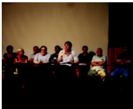
Herenegun egin zuen plataformak agerraldia. I. TERRADILLOS

BERROBI Bihar jokatu dute Oria ibaian sailkapen estropada eta hilaren 24an, finala 7