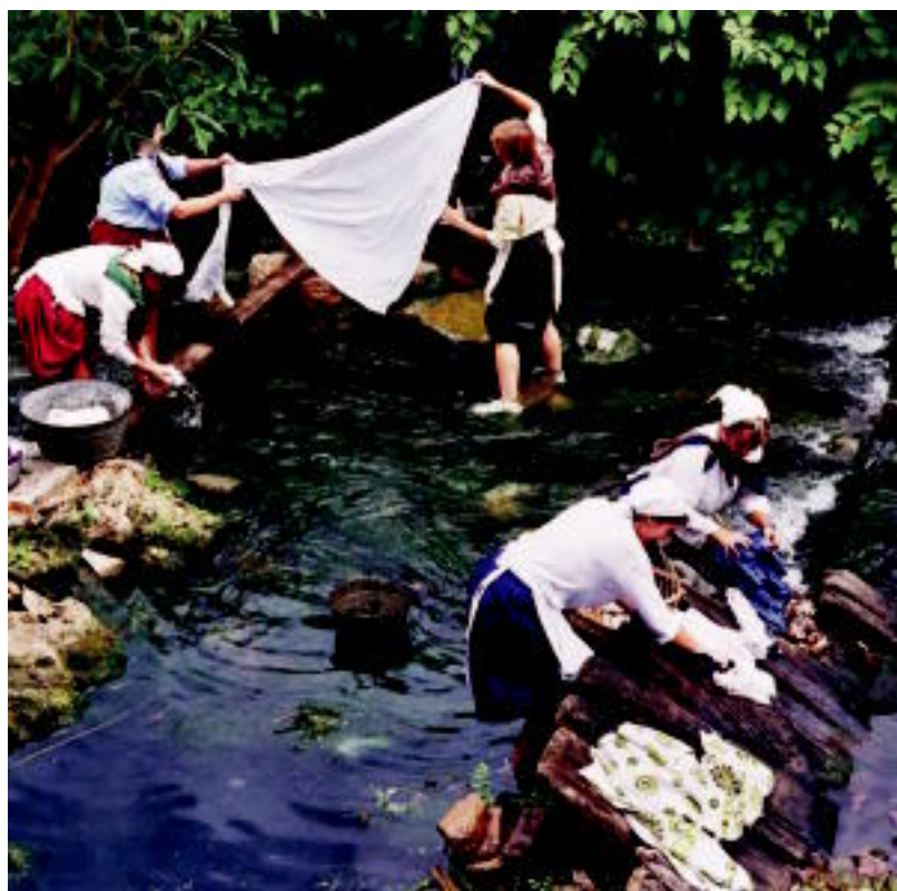
2003. urtean, kale antzerki batean labadero garai bateko bizia gorpuztu zuten. HITZA

URTEURRENA Blues jaialdiak 5 urte beteko ditu aurten eta «herrian finkatzea lortu» duela nabarmendu dute 3