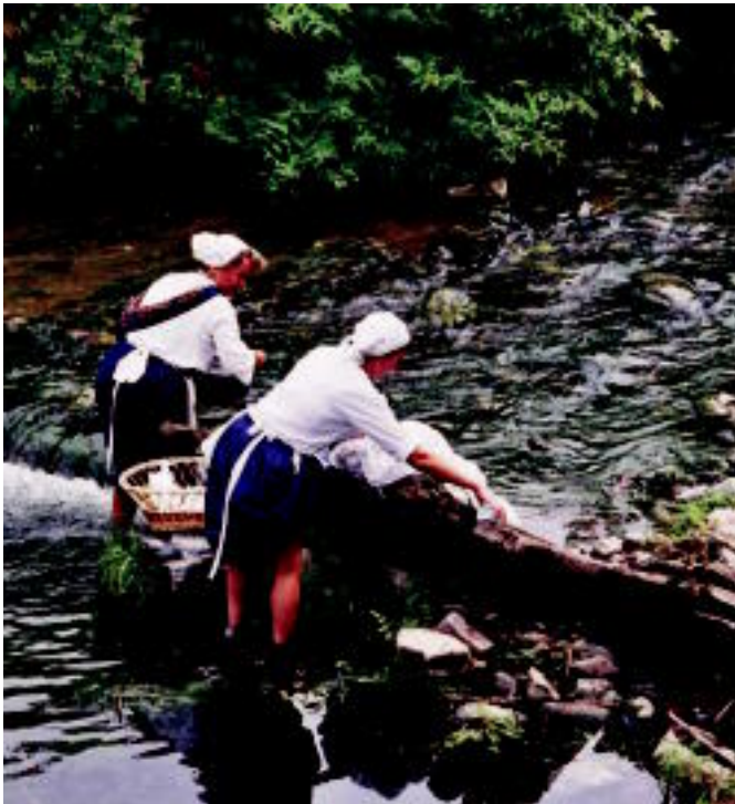
2003ko jaietan eginiko kale antzerkian labaderoen garai bateko biziaren gorpuztu zuten. HITZA