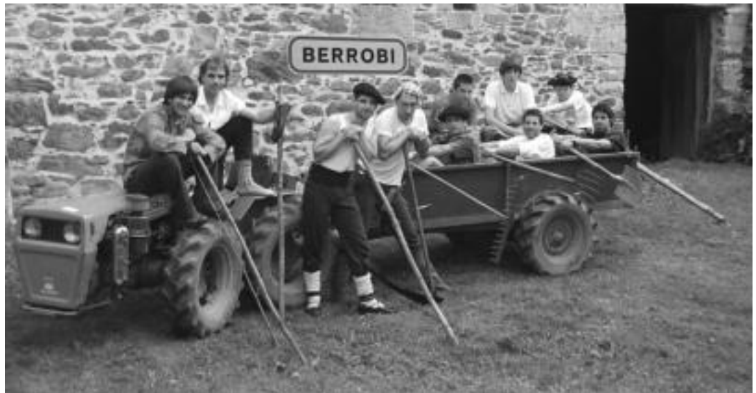
Berrobotik bi talde irtingo dira aurtengo sanjoanetako estropadan. Hasiberriek itxura ona eman nahi dute, beteroenok txapela ekarri nahi dute Berrobira. HITZA

Finala denbora onena egiten duenak irabaziko du. Guztira 20 batelak eman dute 2009ko sanjoanetako estropadan izena. Hauek bi taldek bakarrik altxako dituzte zerura euren arraunak.