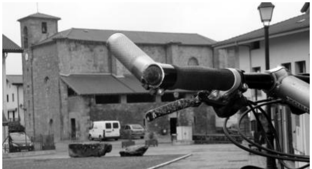
Bigarren ibilbidean Asteasu, Larraul eta Zizurkil igaroko ditugu; irudian, Larraulgo San Esteban eliza. JOXEMI SAIZAR

Tolosaldeko eta Leitzaldeko HITZAn jarri eta Gipuzkoako beste 4 Hitzetan DOAN agertuko da