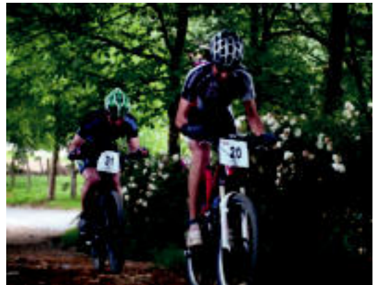
Bi txirrindulari txapelketaren une batean. HITZA