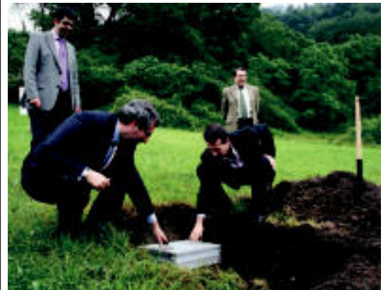
Errepide berria eraikiko duten lekuan jarri zuten lehen harria. I.T.

BERROBI San Andres eskolako irakasleak «oso pozik» daude herrian herenegun izandako giroarekin; «uste baino jende gehiago izan zen» 6