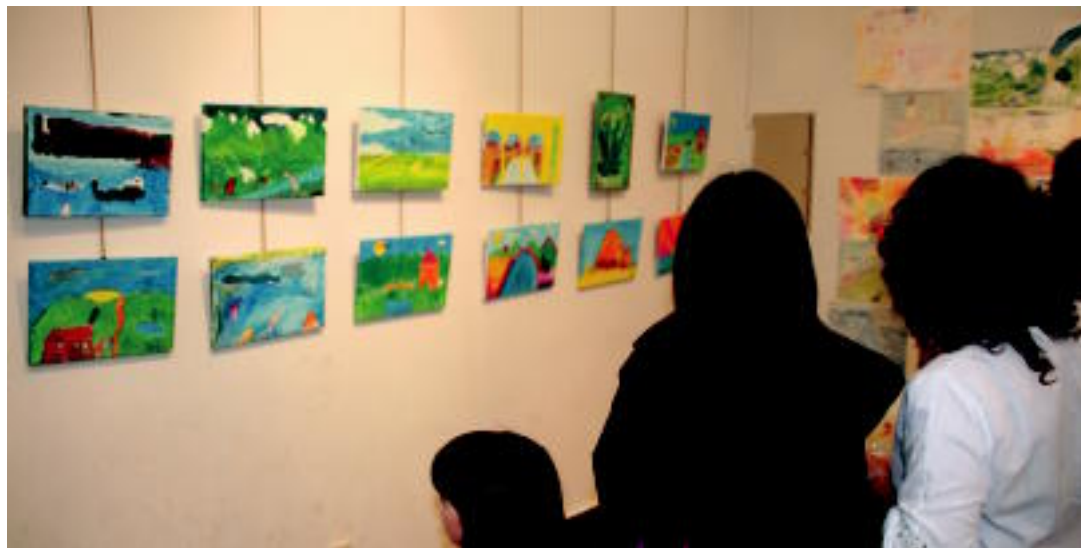
Erakusketan helduek zein haurrek egindako lanak ikus daitezke. I. GARCIA

HITZAK ez du bere gain hartzen egunkariaren adierazitako esanetan iritziaren erantzunik.