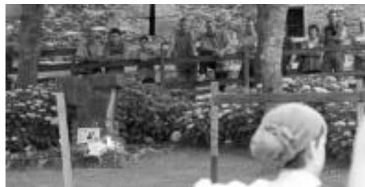
Naparrari lore eskaintza egin zioten familiaren Lizartzako baserrian. I. URRUTIA