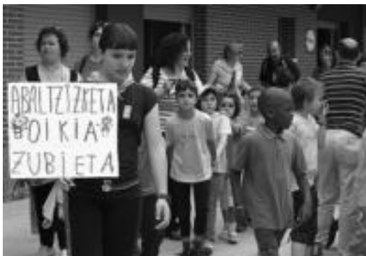
Gipuzkoako 27 eskola txikietako ordezkariek izan ziren Berrobin. I. URRUTIA

du hain jai polita antolatzeak». Altzoko Imaz Bertsolaria eskolari egokitu zaio datorren urteko jai antolatzea, baina lasai egon ahal dira, Berrobiko eskola ahal duen guztian laguntzeko prest agertu baita.