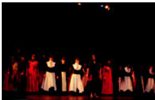
Gurea jendez bete zen Ibarako taldearen emanaldia ikusteko. JOXEMI SAIZAR

Villabona » Aretoa betetzea lortu zuen Ibarako taldeak Dantza Astearen baitan antolaturiko emanaldian.