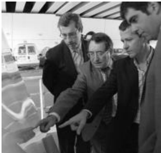
Erakundeetako ordezkariek, atzo, proiektuaren aurkezpenean. I.T.

800 metroko luzera izango du bideak, 3 metroko bi errail, %7ko luzera-malda, eta gehienez, 40 kilometro orduko abiaduran joan ahalko da. Bestalde, errepede zati berri honetaz gain, N-1eko lotune-adarra ere aldatuko dute. Hain zuzen ere, egungo galtzadaberrantolatzea aurreikusi dute, ezkererako biraketa duten bi errail sortuz: bat Santa Luzia auzorako sarrera