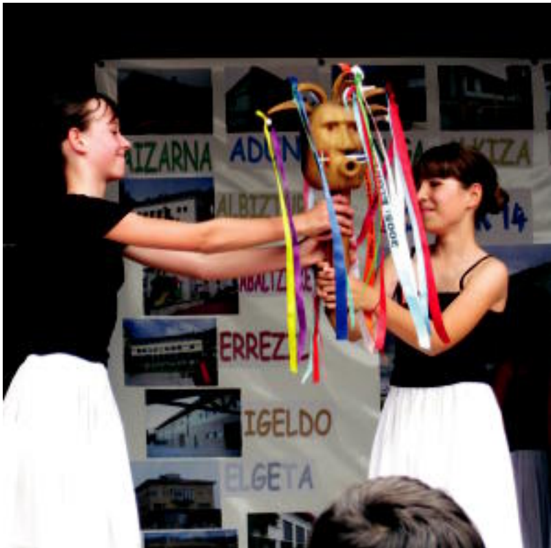
Berrobikoek Altzokoei lekukoa pasa zioten unea, herenegungo festan. HITZA