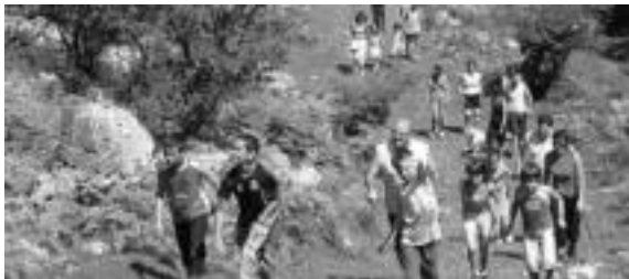
Paraje ederretaz gozatzeko aukera izan zuten ibiltariak (goian Balerdi). Bizikletarekin 32 lagun aritu ziren. Ibilaldia aurten gainera erraztu egin dute.