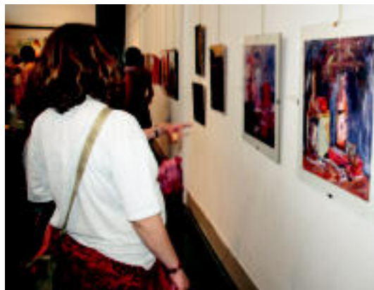
Ikusmina sortu du erakusketak eta jende dezente izan zen inaugurazioan. I.G.

Massetanik azaldu duenez, aurtengo ikasturtean ikasteko modua aldatu egin du: «Ez zait asko gustatzen zerbait kopiatzearen teknika. Aurten ariketak egin ditugu, koloreen inguruan ere ikasi dugu, artearen historiari buruz ere. Ez da izan denborapasa moduko bat. Ikasleak margotzera etorri dira». Eta erakusketan ikusten denaren arabera, gustura aritu dira adin guztietako ikasleak ariketa horiek egiten. Emaizak ikusgai daude.