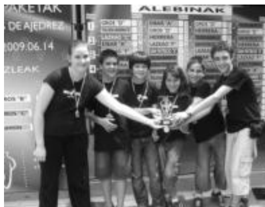
Tolosa-Ibarra xake jokalaririk gazteak, saria eskuetan dutela.