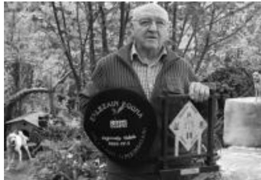
Mendizabal omenaldian jaso zituen txapela eta garaikurrarekin.

Gaur egun aurrerapen asko dago baina guk natural-naturala jasotzen dugu, erleak egiten duena bere horretan. Inguruan ahalik eta lore gehien izan dezatela saiatzen naiz. Lorea gertu izanda lan gehiago egiten dute eta etxe inguruan era guztietako landareak ditut.