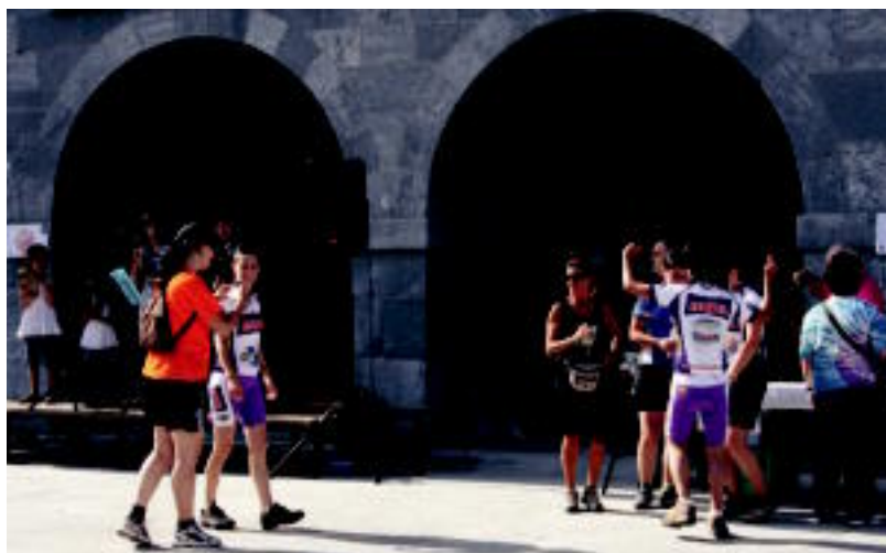
Trikitilariak eta bertsolariak ere izan ziren Leitzaiko I. Sagardo Eguneko giroa alaitzeko.