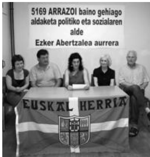
Azken hauteskundeetan jasotako babes eskertu du ezker abertzaleak. E. EZBIZA

Ezker abertzaleak baldintza okerrean ere «indarra etagaitasuna duela» erakutsi du euren hitzetan eta hori baliatuz «indarra erakustaldi soiletatik harantzago herri harreria eraiki behar dugu, herri honek prozesu demokratikoa muturreraino eramateko eta, aldi berean, abstenitu direnak, %60 baino gehiago, ilusionatze-ko», esan zuten.