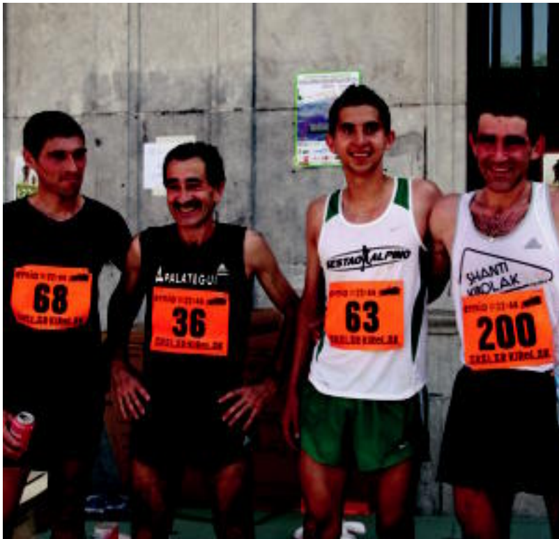
Trianguloko helmugara iritsi ziren lehenengo lau parte-hartzaileak. ESTI EZEIZA