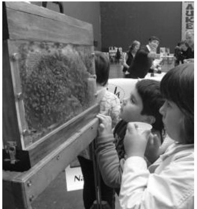
Zegaman ospatu zen XI. Ezti Txapelketako sariak banatu osteko une bat eta haurrak kutxan dauden erleei begira. UXOIA BARANDIARAN