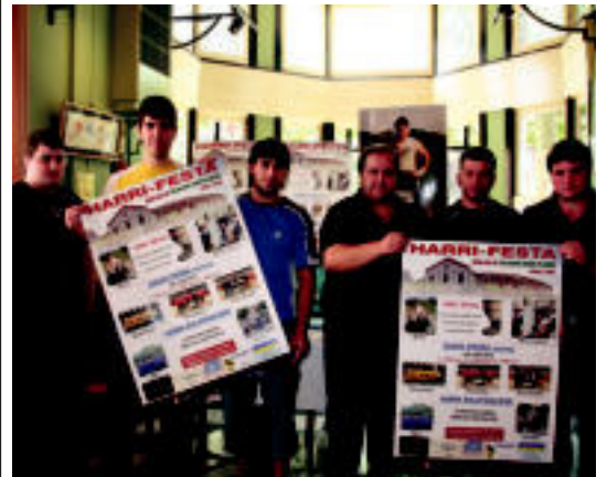
Atzo aurkeztu zuten proba parte-hartzaileak. E. EZEIZA