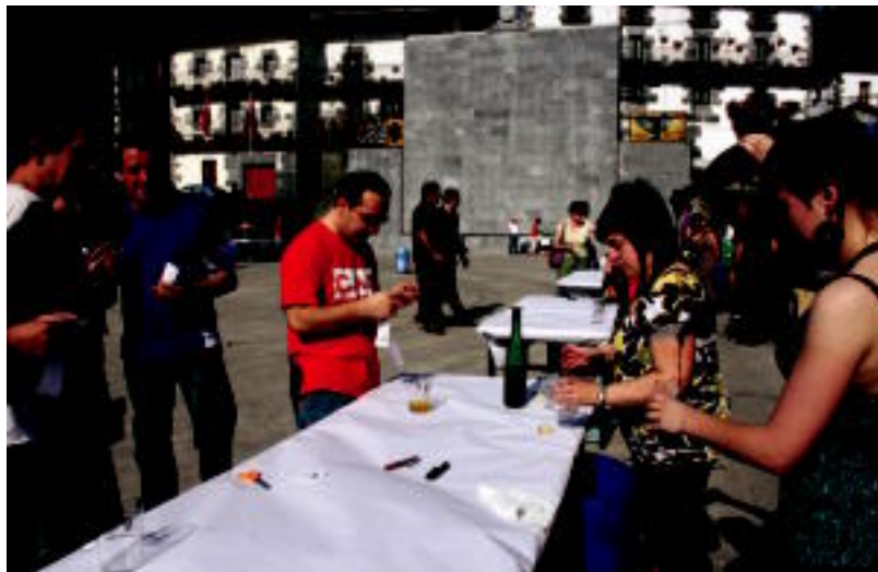
Guztira 16 ekoizleren sagardoa dastatzeko aukera izan zen atzo; bakoitzak 84 botila inguru eraman zituen. R. CALVO

Leitzara gerturatutako guztiak sagardoa dastatzeaz gain Karrapera aurpegi berria ezagutzeko aukera ere izan zuten. Izan ere, Udaletxean berritze lanak ere egin dituzte azken hilabeteetan.