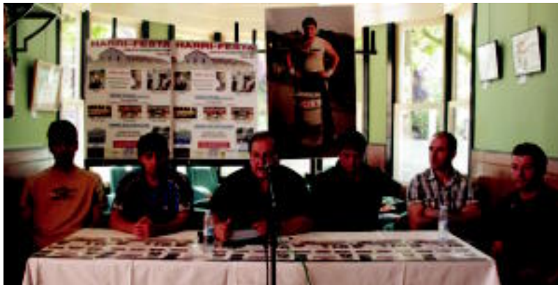
Atzo goizean aurkeztu zuten Harri-jaiak, bertan parte hartuko duten kirolari batzuek. E. EZBIZA

Harri-jasotzaileak, gizon-proba eta harri-zulatzailak ariko dira lehian. Bigarren honetan, hiru tal-