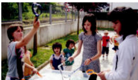
Ikasleak eta irakasleak azken entseguak egiten. HITZA

BERROBI Azken hilabeteak prestaketetan egon dira; Altzori pasako diote lekukoa 6