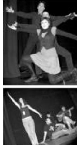
Teatraigo (goian) eta Maneras de Sentir taldeak, III. Poltsikoko Antzerki Lehiaketan. HITZA

Asvineneak lehiaketan parte hartu duten guztiak eskerrak eman dizkie, «bere lana erakutsi eta es-