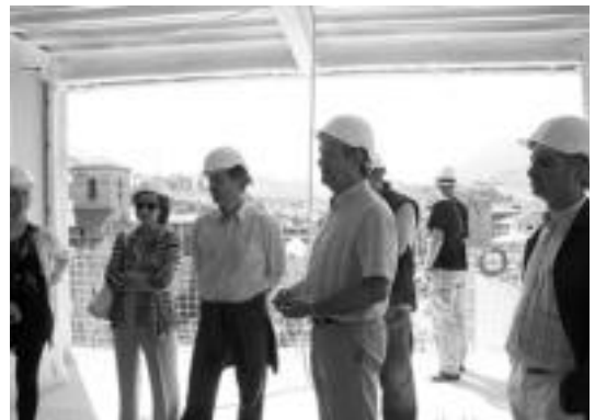
Bi eraikinek osatuko dute zentroa; horietako bat gerontologikoa izango da. E. E.

Zentro berriaren proiektua garatzeko, Udalean ordezkariak politikoa duten alderdi politiko guztiek, proiektuarekin zerikusia daukaten teknikari eta zentroa egin eta kudeatzeaz arduratuko den anpresak lan talde bat osatu dute. Hauek arduratu diran lanen jarrai-