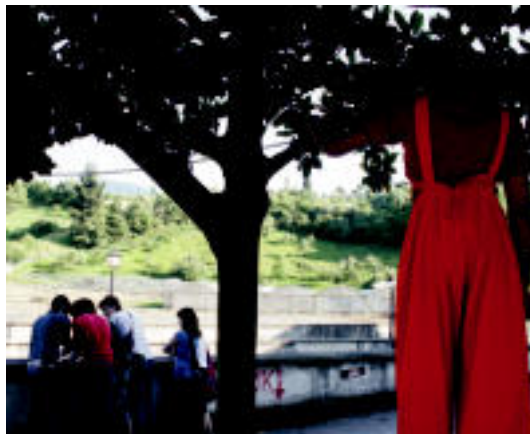
Gazte Asanbladako kideek eman zieten hasiera aurtengo Gazte Festei. R. CALVO

Atzo iluntzean eman zioten hasiera festari txupinazoa jaurtitzea-