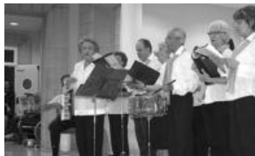
Aurten ere Alaitu abesbatza ariko da Iurreamendin. IT.