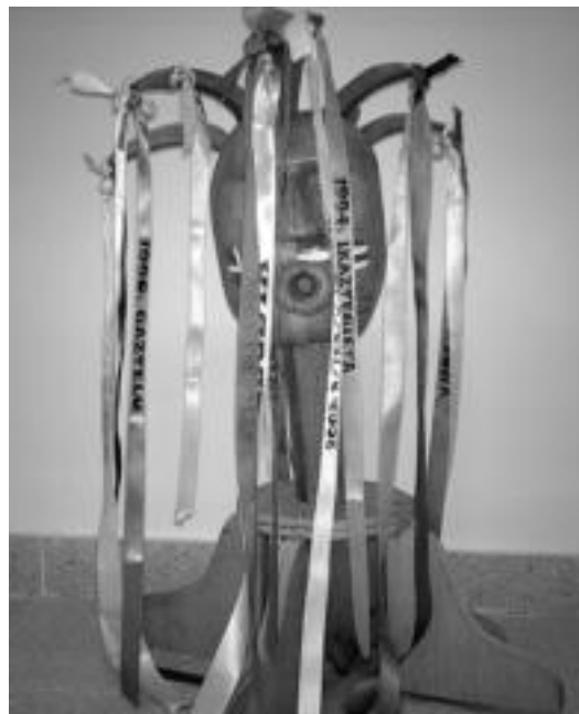
Berrobiko eskolak Altzori pasako dio bihar jaia antolatzeko lekukoa. HITZA

Irakasleek bihar Berrobira gerturatzeko asmoa dutenei herriguruan ezingo dela aparkatu esan nahi diete. Horretarako bi kilometroetara dagoen aparkalekua presatu dute, Belauntzako industriagunean, errepide ertzean, hain zuzen ere. Bertan autoak lasai utzi ahal izango dira eta autobus zerb-