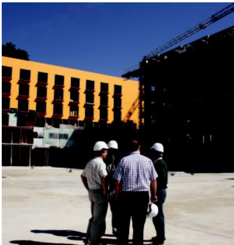
Atzo goizean izan ziren obrak ikusten proiektuaren jarraipena egiteko osatu zen lan taldeko kideak. E. EZBEIZA