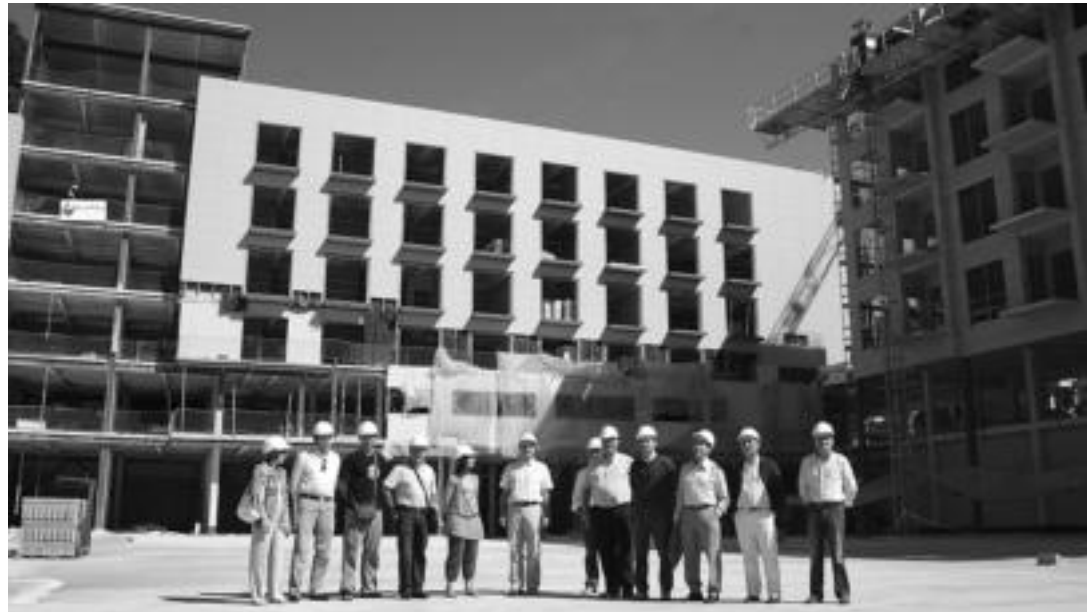
Atzo goizean agerraldia egin zuten proiektuaren jarraipena egiteko osatu zen lan taldeko kideek; lanak nola doazen azaldu zuten bertan.

Hirigintza » Alhondiga plazan kokatuta dagoen zentroa urtebetean amaitzea aurreikusten da; 177 plaza izango ditu.