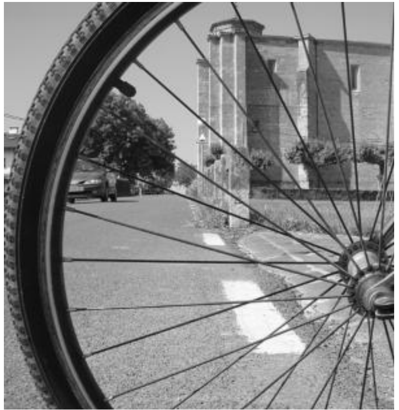
Bizikletaz edozeinek egiteko moduko txangoak proposatuko ditu HITZAK astero. JOXEMI SAIZAR

Asteroko artikuluan ibilbidea eta bere xehetasunak, distantziak eta alturak grafiko batean, mapa eta inguruko informazioa azalduko da.