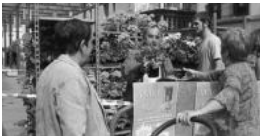
Udalak loreak banatu zituen herritarren artean Atari Bizi lehiaketarako. E. EZEIZA

Udaberri osoan zehar beren ataria edo balkoia hobekien zaindu eta goxatu dutenak sarituak izango dira Villabonako jaietan. Sariak, zehazki, hauek izango dira: 1. saria bi lagunentzako bazkari eder bat eta 100 euroko txartela eskualdeko loradenda batean erosi ahal izateko izango da; 2. saria, 100 euroko txartela eskualdeko loradenda batean erosi ahal izateko; eta 3. saria 85 euroko txartela eskualdeko loradenda batean erosi ahal izateko.