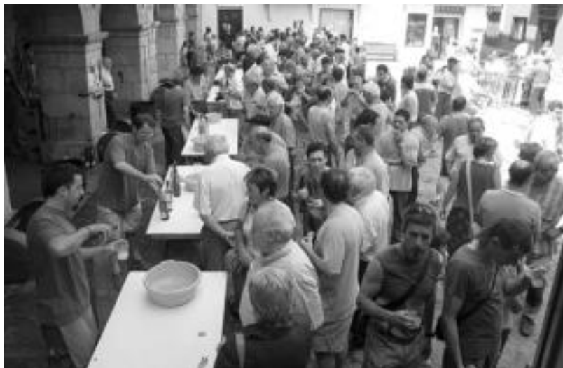
Tolosaldean arrakasta handia eduki ohi dute sagardo dastaketek. Irudian Alegiako sagardo eta txakolin dastaketa.

I. Sagardo Eguna herriko plazan ospatuko da 18:00etatik aurrera. Karrapen 16 sagardo postu kokatuko dituzte eta sagardoa bultzat-