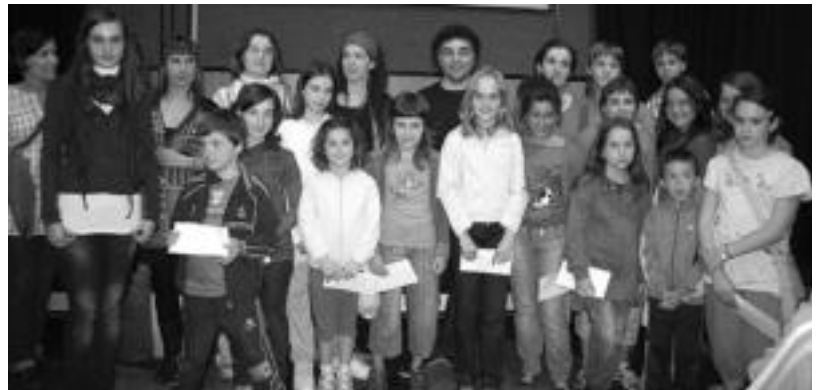
Herenegun iluntzean jende ugari bildu zen Kultur Etxean, marrazki lehiaketan parte hartu zutenen lanak ikusteko. E. E.

Turkiar asteko azken ekitaldia etzi izango da. Fronton jatetxean Turkiako zapore tipikoak ezagutzeko aukera izango da. Yogurtarekin, berenjekin, bulgurrarekin eta beste hainbat produktuekin sukaldatuko dute bertan. Gainera, afarian zehar, Sükrü Karakus derbitxe bat bezala bueltaka ikusteko aukera ere izango da. Hau bere lan berriaren aurrerapena izango da. Los jardines del Sufi izeneko proiektuan ari da lanean orain. Eta ezer falta ez dadin, Semak sabel dantza erakustaldi bat egingo du.