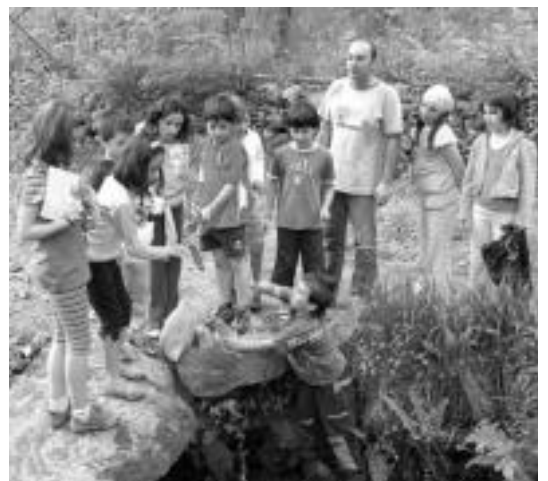
Berastegiko haurrak Ibaialde erreka garbitu zuten larunbatean. HITZA

Aurreko asteko ostegunean Berastegiko Muñagorri eskolako haurrak Ibaialde erreka azterketarekin batera, erreka garbiketa egin zuten eta larunbatean, berriz, herriko plazan Eguzki sukalden erakusketa eta tailerra izan zuten ISF (Mugarik gabeko Ingenieritza) taldearen eskutik. Horiek horrela, gazteek kartoi eta zilar-papera erabiliz sukalde bat nola egin