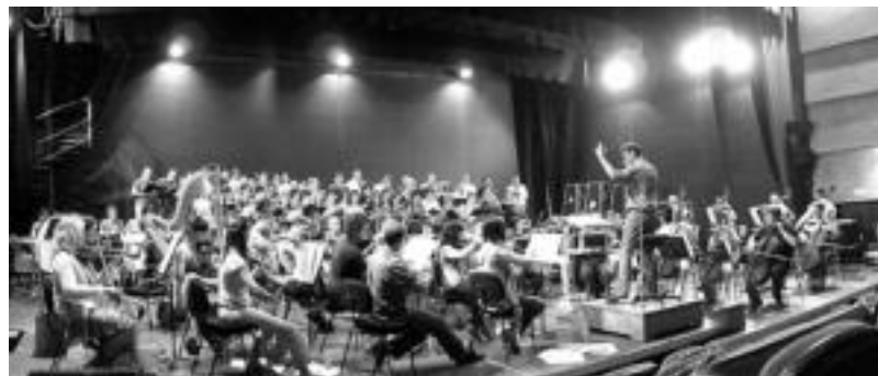
Tolosako Orfeoiko kideak Logroñoiko emanaldia prestatzen ari ziren bitartean.

Tolosako Orfeoia Logroñoiko (Errioxa, Espainia) Riojaforumen izan zen, eta bertan, opera eta zarzuela denboraldiko itxiera jaialdi lirikoan parte hartuz. Arrakasta handia izan zuen ekitaldiak, horren adierazle da Diario de Rioja