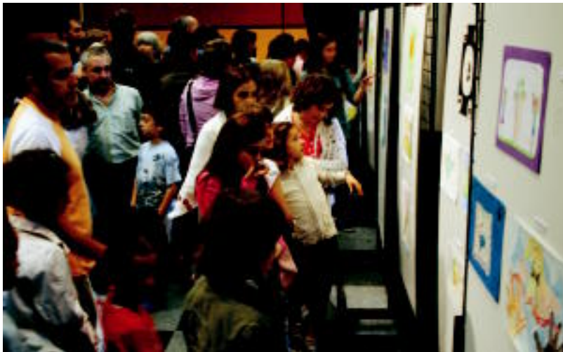
Marrakzi lehiaketan parte hartu zutenen lanak ikusteko jendetza bildu zen, herenegun, Kultur Etxean. ESTI EZEIZA