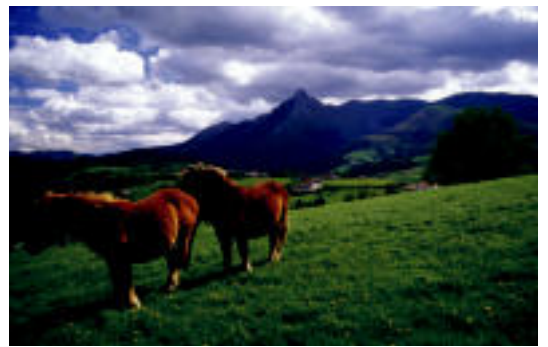
Aurrekontuko hornikuntza 1.400.000 eurokoa izango da.

dukoan aritzeko sailkatu baitzen. Bertan munduko arrantzaletan honen lehiatuko da. Aurtengo Espainiako Txapelketan ere, datorren urteko Munduko Txapelketan aritzeko txartela lor dezake.