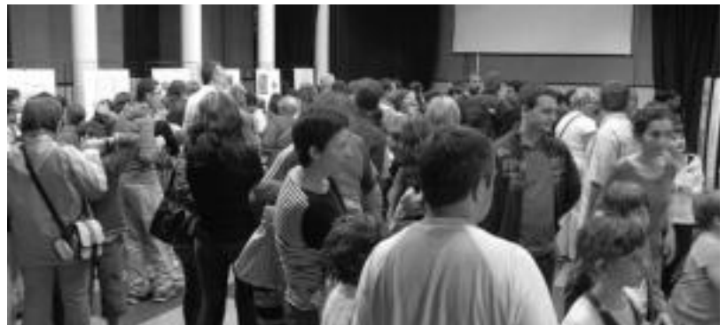
Erakusketa inauguratzearekin batera, lehiaketako irabazleei sariak banatu zizkieten herenegun. E. EZEIZA