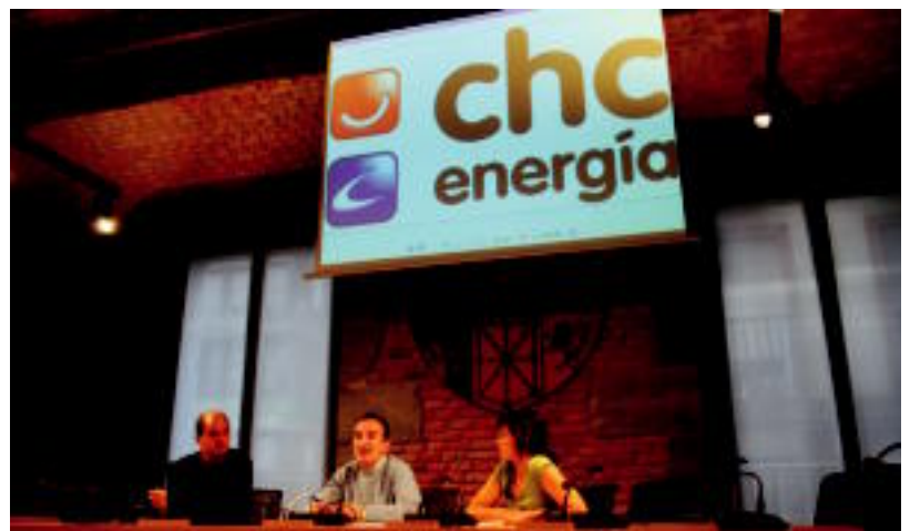
Atzo goizean eman zuten aldaketaren berri Tolargiko eta Tolosako Udaleko arduradunek. MARTA SAN SEBASTIAN

Aldaketa hau aurreikusiz, Tolargik erabaki du bere hornidura CHC Energia enpresak bereganatuko duela. Hori dela eta, uztailearen laurtean, ordura arte Tolargiko bezero izan direnek, aldatu nahi dutela ez badute jakinarazten, automatikoki, CHC Energia konpainiara igaroko dira. Tolargikoek, enpresa honen bitartez, «energia-