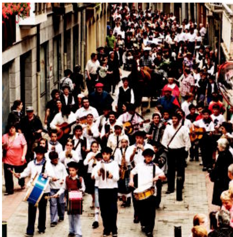
Herenegun Alegian egindako festaren une bat.