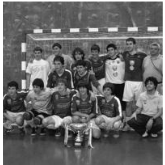
Ibarrako gazteak fin aritu dira denboraldi honetan.