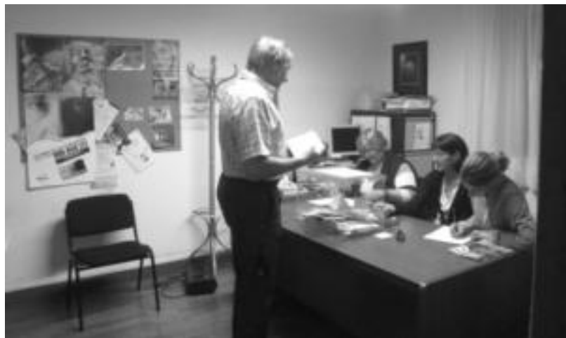
Herritar bat botoa ematen herenegun, Iruan. N. LATABURU

kora indartuta ateraga eta ahots garrantzitsua izango garelako erakutsi dugu».