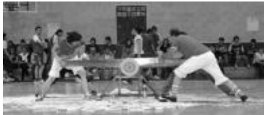
Beasaingo taldeak bigarren egin zuen. E. IMAZ-GOERRIKO HITZA

Zizurkil » Gipuzkoako kanporaketan Zizurkilek laugarren egin zuen; atzetik geratu ziren Asteasu, Tolosa eta Ibarra.