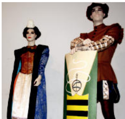
Atzo eman zioten hasiera, XVI. mendeko jantzien erakusketarekin, Gurean. EE

ALEGIA Duela 100 urte inguru nola bizi ziren irudikatu nahi izan zuten herenegun herritarrek, 'Garai bateko Alegia' ekimenean 5