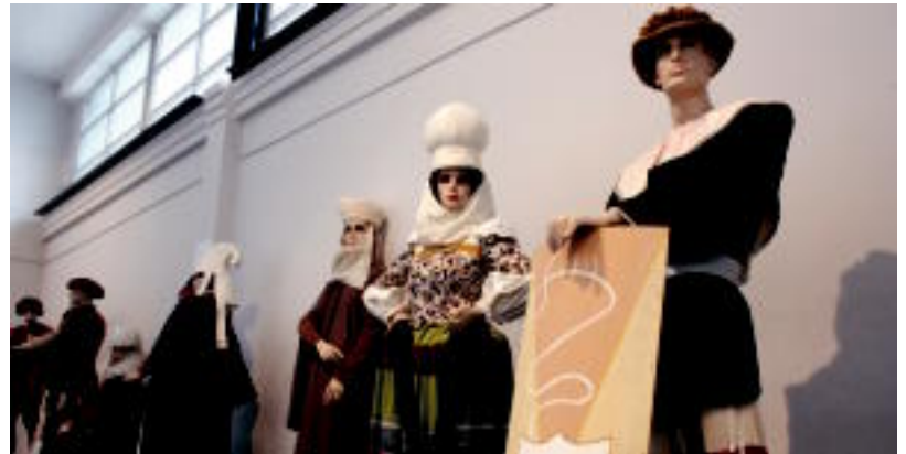
XVI. Mendeko jantzien erakusketa ikusgai da egun hauetan Gurea zinemako erakusgelan. ESTI EZEIZA

Antolatzaileek bono batzuk atzeratu dituzte, Alurr eta Korrontziren ikuskizunetara, bietara joan nahi dutenentzat. Hauen prezioa 10 eurokoa da. Sarrera berezi hauek erosteko epea gaur amaitzen da. Bestalde, banaka erosiz gero, sei euro ordaindu beharko ditute interesatuak, eta bihurtik aurrera egin dezakete okindegetan.