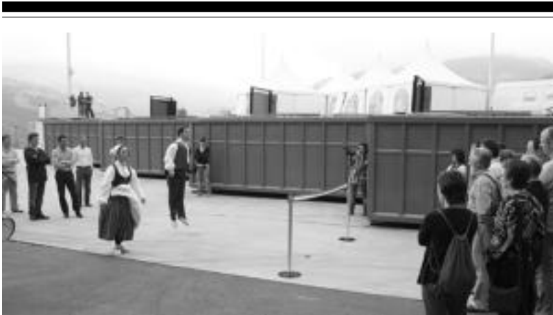
Tolosaldeko Zabor Mankomunitatea osatzen duten herrietako hainbat ordezkari izan ziren inaugurazio ekitaldian. E. E.