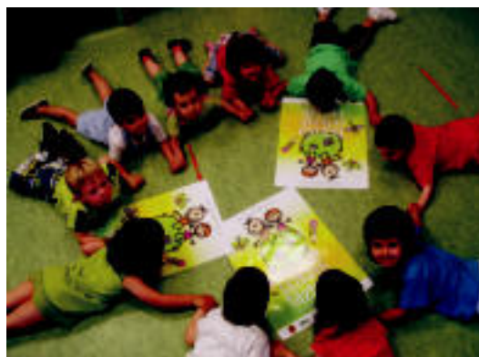
Eskolako umeak irailetik ari dira datorren igandeko jaia prestatzen. HITZA

TOLOSALDEA Tolosaldeko Zabor Mankomunitateak bultzatutako zerbitzua atzo inauguratu zuten; eskualdeko bigarrena da z