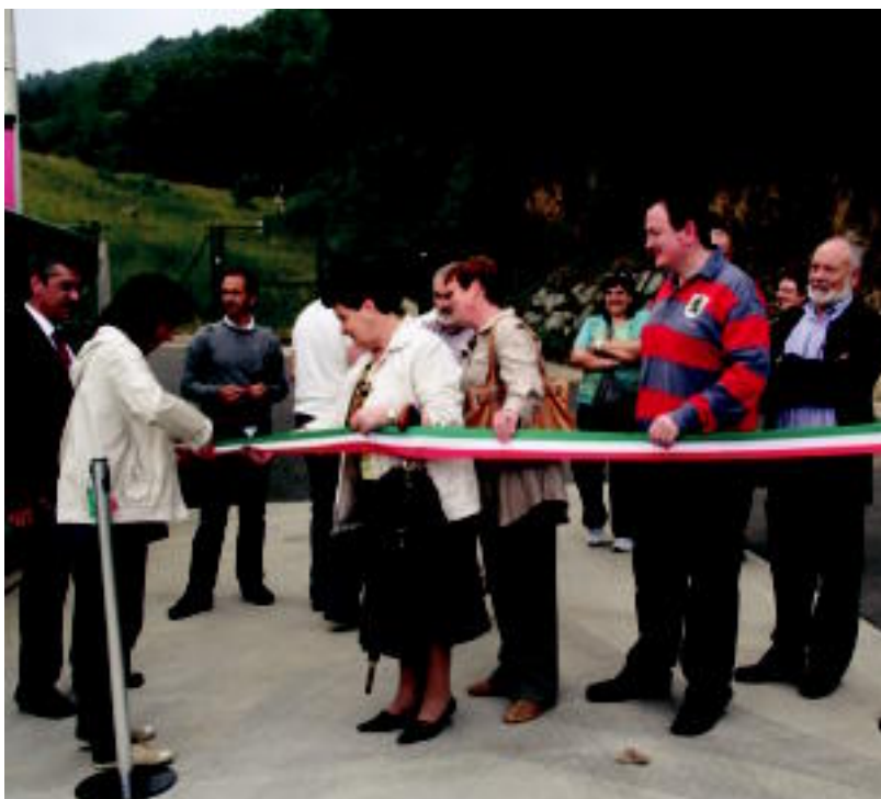
Zabor Mankomunitatea osatzen duten herrietako hainbat ordezkariak moztu zuten zinta. ESTI EZBIZA