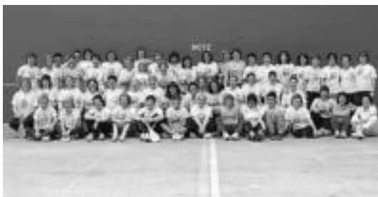
Irurako Emakumea Pilotari Egunean parte hartu zutenak. HITZA

Emakumea Pilotari Egunari hasiera goizeko 10ak aldera emango zaio, emakumeen iritsierarekin, eta arratsaldeko 20:30ak aldera arte luzatuko da festa. Txapelketa herrikoia finala 13:45ean izango da eta bazkaria 15:00etan hasi-koda.