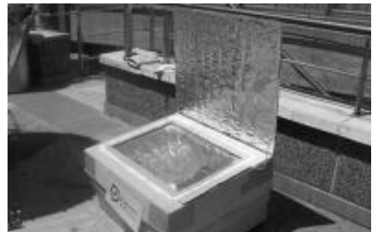
Eguzki-labea egitea erraza omen da. Arratsaldean tailerra izango da. HITZA

Eguzki-labe bat egitea oso erraza omen da. «Nahikoa da material isolatzailez egindako lapiko bat, eguzki-izpiei pasatzen utziko dien estalki gardena duena». Egun eguzkitsuetan, eguzki-izpiak zuzenean sartu eta lapiko edo labean