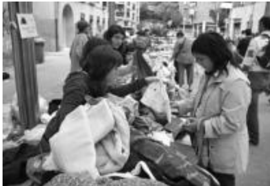
Bigarren eskuko azoka egin zuten atzo Villabonako Berdura plazan. I. GARCIA

Ingurumena » Villabonan herriko eskolek eta norbanakoek bigarren eskuko produktuak saltzen jarri zituzten atzokoan.