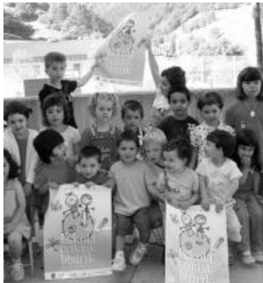
Irailtik ari dira lanean Eskola Txikien Festa antolatzeko.

Jaiak «ilusio handiz» antolatu dute eta euren helburua «herri txiki eta auzoetako gure txikitasunean indartsu eta handi sentitzea» dela adierazi dute.