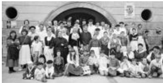
Aurtengoa garai bateko eskola ekarriko dute gogora herriko jaietan.

Antzerkia abuztuaren 23an izango da eta aurtengorako, antolatzaileek Ibarrako garai bateko eskolaren inguruko gaia aukeratu dute.