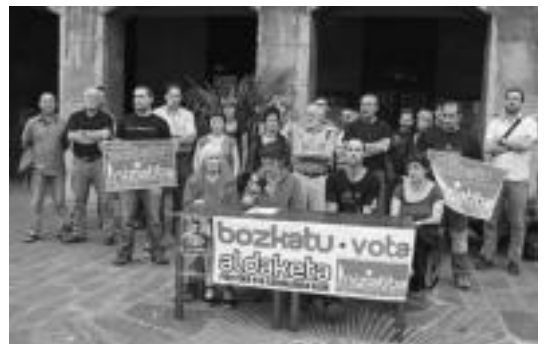
Ezker abertzaleko hautetsi eta alkateak prentsurrekoa ematen. A. IMAZ

Tolosan ekitaldia egin zuten atzokoan; hasiera batean Plaza Berrian egin behar zuten, baina junta elektoralak ez du hau hauteskunde gune bezala izendatu eta azkenean Kultur Etxean egin zuten. Bertan 200 lagun inguru bildu ziren.