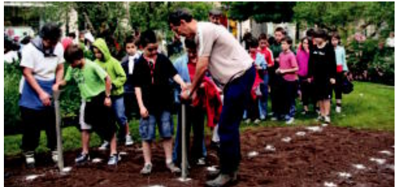
Gailu berezi bat erabiliz, 250 zulo egin zituzten, eta hauetan landatu babarrunak. E. EZEIZA

Laskorain ikastolako haurrek, Tolosako Babarrunaren elkarteak nahiz kofradiakoe, eskualdeko sukaldari ezagunek eta Tolo-