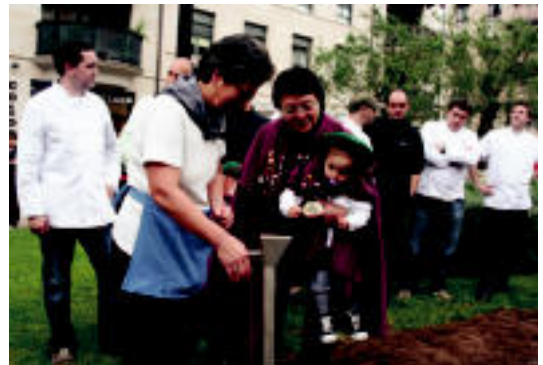
Banan-bana joan ziren, zulo batetik bestera haziak botatzen.

sako Udaleko ordezkariak landatu dituzte oraingoan babarrunak. Denera, 250 zulo egin zituzten atzarako, beste horrenbeste landare hazteko gero. Gailu berezi bat erabili zuten horretarako. Aitzurrarekin zulorik egin gabe, azkar eta modu erosoa haziak ereinaz. Tutore gisa hagak jarriko dituzte gero, eta Goroldikoak arduratuko dira beraien zaintzaz, ondoren, urrian edo azaroan, emandako babarrunak bildu ahal izateko. Beraz, hemendik aurrera, tolosarrek landa baserri inguruetara joan gabe, babarrunak nola hazten diren ikusi ahal izango dute.