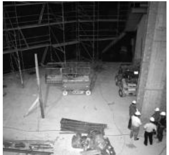
Etorkizunean hau izango da To.Pic-eko antzokia. E. EZEIZA

ahal izango ditu bisitariak, barne-egiten duen ibilaldian: ongietorria, kontrol gela, pertsonaien galeria, tailerra, sortzaileen korridorea, ganbera magikoa, istorioen