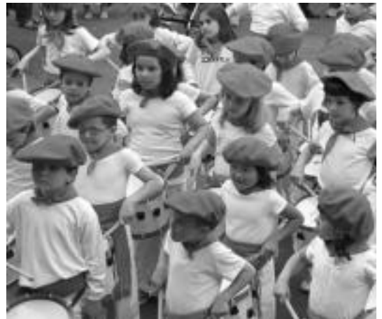
Ilazko jaietako haur danborradaren irudia. I. GARCIA

Herriko artisten, eskulanetako taldeek egindako eta festetutako kartel lehiaketa aurkeztutako lanak ikusi ahal izango dira.