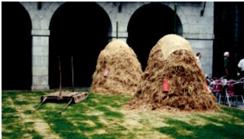
Igandera arte mantenduko dituzte ikusgai meta hauek Plaza Zaharrean; jendearen kuriositatea ere pizten dute. N. L.