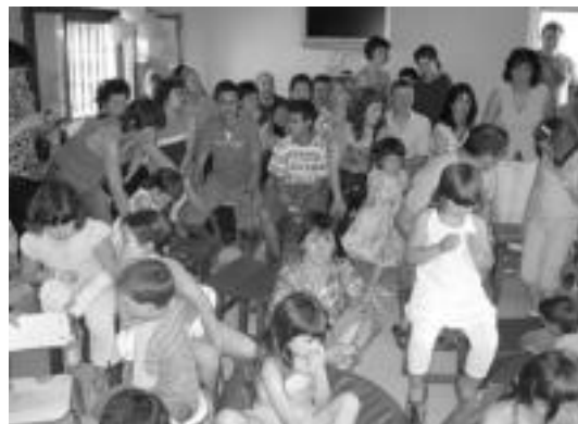
Jende ugari joan zen ekitaldira. HITZA

Bedaioarren aldetik, «eskerrik beroenak denei».