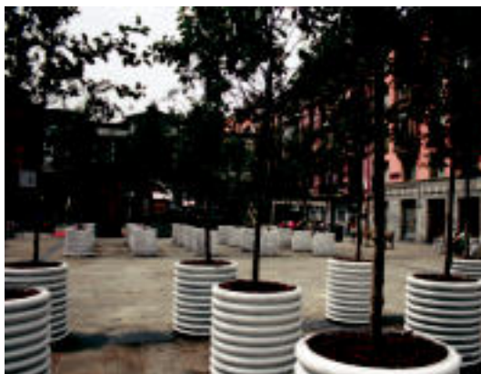
Plaza Berrian. berriz, sagasti bat inprobisatu dute. N. LATABURU

Zuhaitzak karez margotu dituzte, metak jarri dituzte, ureztagailu apaingarriak erabili dituzte, sagasti bat inprobisatu dute, herriar gehienak jabetuko ziren honekin dagoeneko Etzi, igandearrekin, amaituko da egitasmoa.