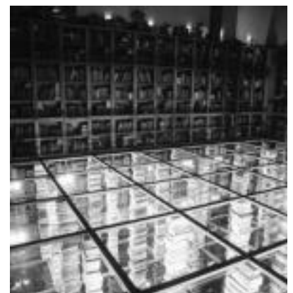
Euskarri ezberdinak eta teknologia berrienak erabiliko dira txotxongiloen etxe berrian. HITZA