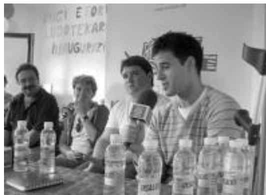
Bertaratu zirenek famatuen sinadurak jaso zituzten. Txolarre irratik zuzenean emititu zuen Bedaiotik hitzaldia. Irudian, Barriola galdera bat erantzuten. HITZA