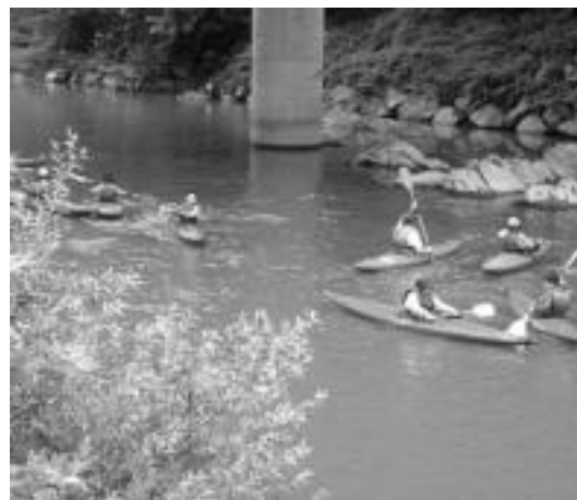
Alegiak inguru egokia du piraguismoa egiteko. N. LATABURU

Bestetik, Uda Kanpaina 8-16 urte bitarteko haur eta gazteei zu-