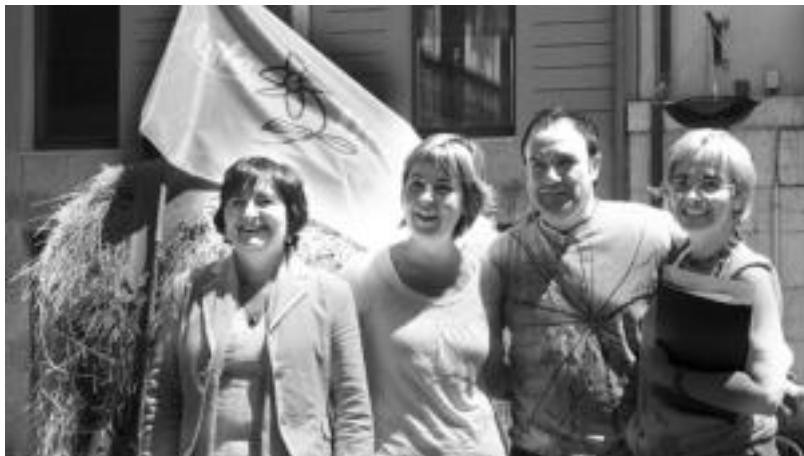
Atzo aurkeztu zuten Aste Berdea, Udalekoek, ikastetxeetako zuzendariak eta Ingurumen Zentrukoek. E. EZEIZA

Aurten landuko duten gai nagu- sietako bat mugikortasunarena da. Urteak daramatate, hau jasanga- rriagoa izan dadin lan egiten. Ho- ri dela eta, hainbat azterketa buru- tu dituzte, esaterako, gaur egun, eskolara haurrak zein garraio erabiliz joaten diren ikusi. Baita, haurtxo hauen aiton-amonak bere garaian nola joaten ziren galdetu ere.