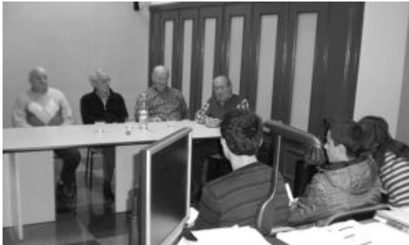
Anoetako Ikastolako ikasleek adinekoen lekukotasuna jasotzen aritu dira. HITZA

Hartu duten bigarren garaia Gerra Zibila izan da. Garai horretan gerra-haurren gaia landuko dute. Gai horrek beste agerraldiak harilkatuko ditu. «Azken 130 urtetan herria gehien markatu zuen gertaera dela ikusi dugun», azaldu du ko-