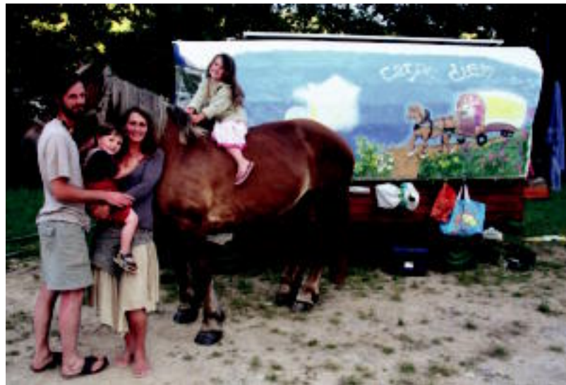
Familia bidaia-riaren kideak, behorra eta etxe bezala duten gurdia ondoan dituela. I. GARCIA

Izarren Mendilerroa dute jomuga. Bertan topatu nahi dute bizitzeko lurra. «Modu soilean bizi nahi dugu», dio. «Behorarekin lan eginez barazki eta fruta ekoiztu nahi dugu». Ez dira inoiz izan Portugalen, baina inguruko jendeak leku horri buruz hitz egin die. «Leku askotara bidaia-tu dugu», azaltzen du Sylvainek. «Emaztea eta biok ezagutu ginenean Portugalera joan nahi genuen. Azkenean auto-stop eginez Afrikaraino