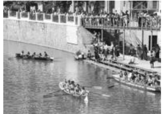
Laskorainek DBH eta batxilerrako lehen postua eskuratu zuten. R. CALVO

Atzoko Batel Topaketa, era berean, gaur 12:00etatik aurrera izango den estropadetarako beroketa modukoa izan zen. Tolosa eta Oriari arteko lehia izango da batetetik, eta bestetik, Emendek eta Aiz-Orratz elkarteen arteko desafioberezia ere izango da ikusgai.