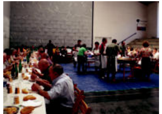
Paella jana egin zuten 110 lagunek Albizturren.