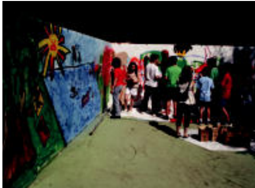
Iragan larunbatean bezala, atzokoan graffiti tailerra egin zuten igerilekuan. A.I.

Bedaion Asteburu Kulturalean ospatzen ari dira. Atzokoan Ludote-