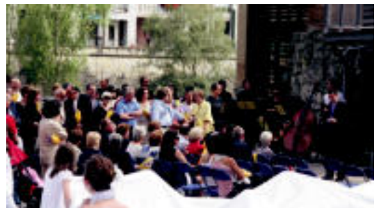
Aranburu Jauregiko lorategietan izan zen ekitaldia. R. CALVO