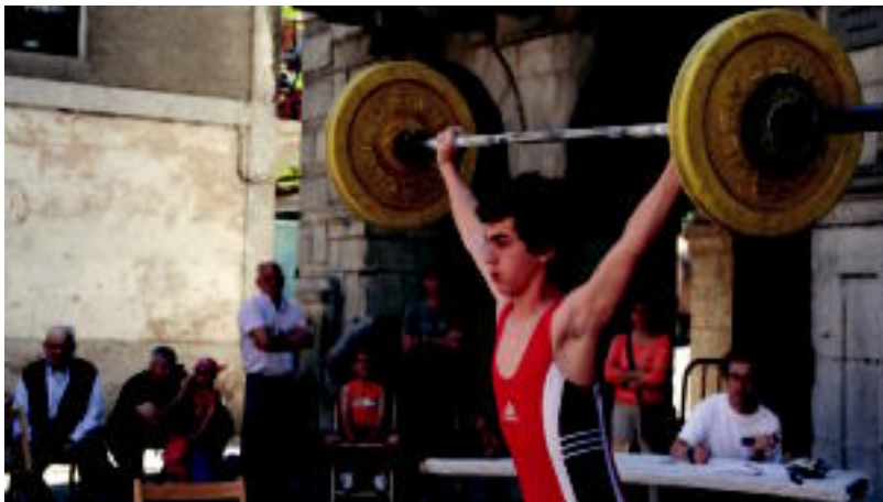
Goian, Bedaion egin zuten ludotekaren inaugurazioaren una bat. Behean, Alegian halterofilia saioa.