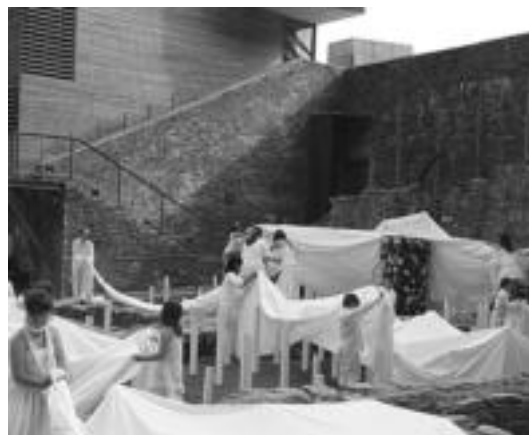
Omenaldia Aranburu Jauregiko lorategietan izan zen.