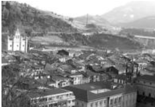
Garapen jasangarriaren alde egindako lanarengatik saritu dute Tolosa.

Ingurumena » Forum Ambiental fundazioak eman dio Atmosfera kategorian, 'Tolosa haizeberri tu proiektuagatik'.