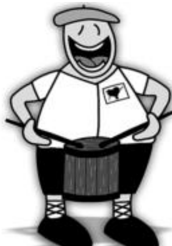
Bartolaren Batzordeak danborrada berreskuratu du. BARTOLAREN JAI BATZORDEA

Jantzietan ere berrikuntzak egongo dira, izan ere, antolatzaileek jende berri «asko» espero dute: «Betiko uniformeak dituztenak horiek aterako dira. Jantzi horiek ez dituztenek, erosten ibili beharrean, nahiko izango dute ondorengo jatzera: abarkak, maoizko galtzak, blusa txuria eta zapi eta txapela morea».