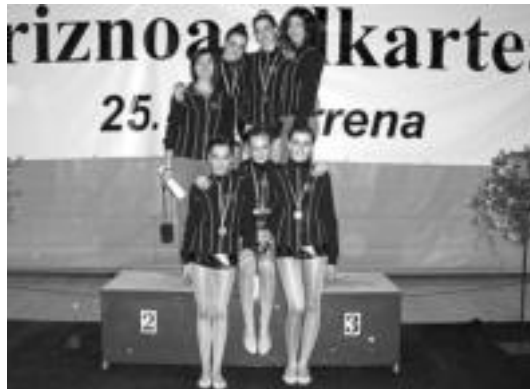
Ondo aritu dira azken bi asteburuetan Belabietako neskek.

Ibarra » Gimnastika erritmikoko Belabietako taldeko neskek Gipuzkoako finala jokatu berri dute.