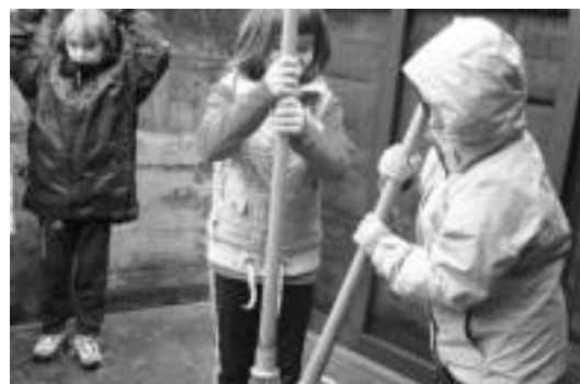
Ikasleak, Gaztelura eta Santiagomendira eginiako irteeretan. HITZA