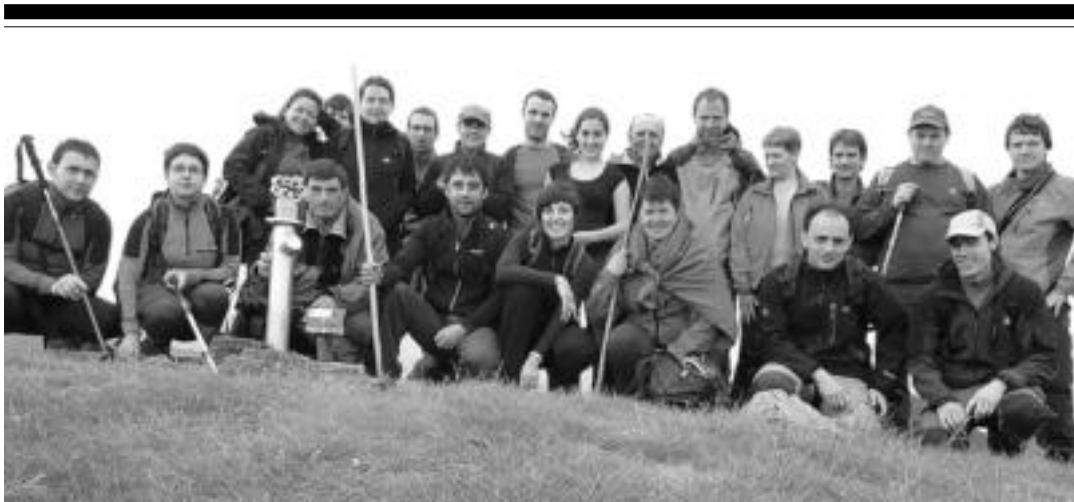
Mendibil mendi taldeak Mugarrien Itzuliaren bigarren zatia antolatu zuten iragan larunbatean. 22 lagun elkartu ziren mendiri irteeran.