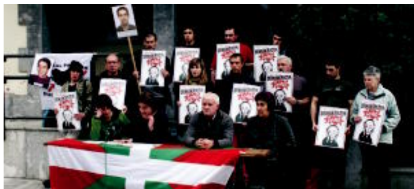
Leaburu-Txaramako ezker abertzaleak «apartheid egoera» salatu zuen herenegun eginiko agerraldian. REBEKA CALVO

EMANALDIA Ekainean kaleratuko duen 'The world tout court' diskoko abestiak eskainiko ditu, besteak beste