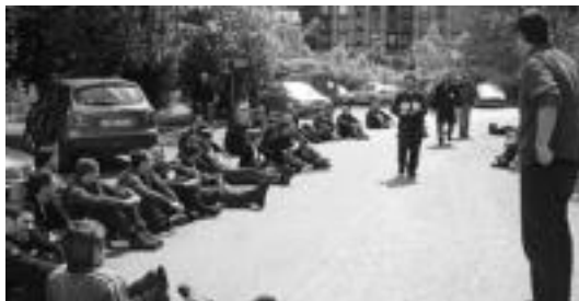
Asteazkenean langileek egindako bi orduko lanuzteen irudia.

Zehazki enpresak bi txosten aurkeztu zituen apirilaren 14an; langileak kaleratzeko bata eta lan etenaldia bultzatzeko bestea. En-