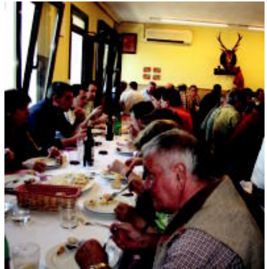
60 lagun inguru bildu ziren Artubi elkarte- tean bazkaltzeko. ESTI ESTEZA

Bedaioarrek ez dute atsedetik hartzen eta hilabetero antolatzen dituzte ekitaldiak, Artubi elkarte-