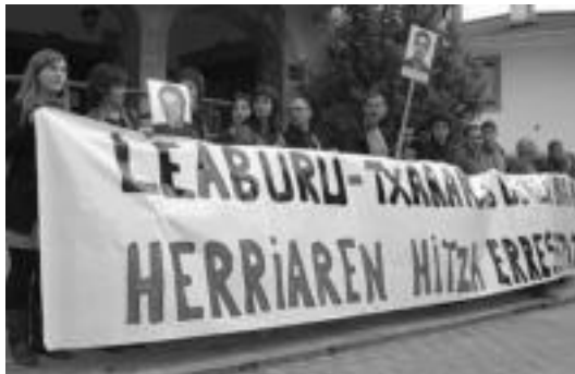
«Bi urteetako apartheida» salatzeke elkarretaratzea egin zuten. R. CALVO

Denbora honetan herriari bi markesina berri jarri dituzte. «Ezker abertzalea Udaletxetik atera