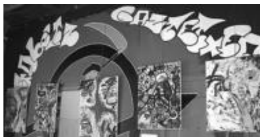
Eki Uharteren oleoak ikusgai gaur Atekabeltz Gaztetxean. ASIER IMAZ