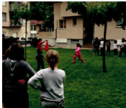
Gustura ibili ziren atzo Lizartzako haurrak plazan jolasean. R. CALVO