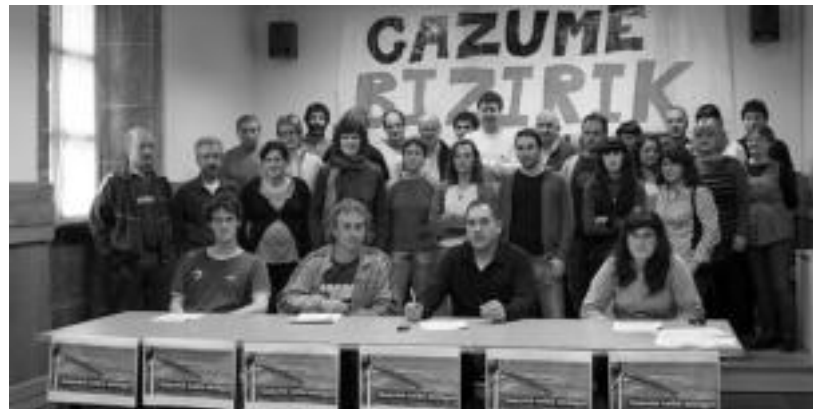
Gazumen aurreikusita dagoen parke eolikoaren aurka agertu ziren hainbat eragilek, tartean eskualdeko zazpi udalek eta hiru elkarte, prentsaurrekoa egin zuten pasa den astean Errezilen. E. EZEIZA

Diru goseak ez gaitzala itsutu. Zain dezagun Gazume, zain ditzagun mendi gailurrak, leku babestua eta gure ingurua.