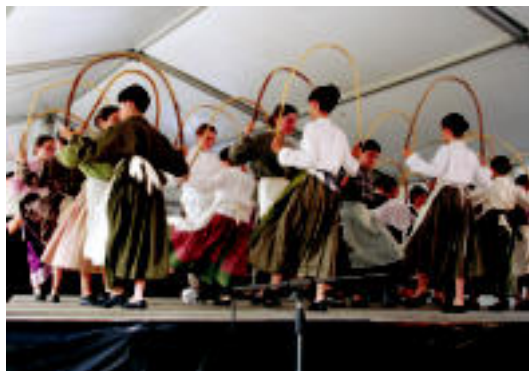
Goizean haurrak aritu ziren dantzan herriko plazan eta arratsaldean Alurr dantza taldearen emanaldian jende ugari bildu zen.