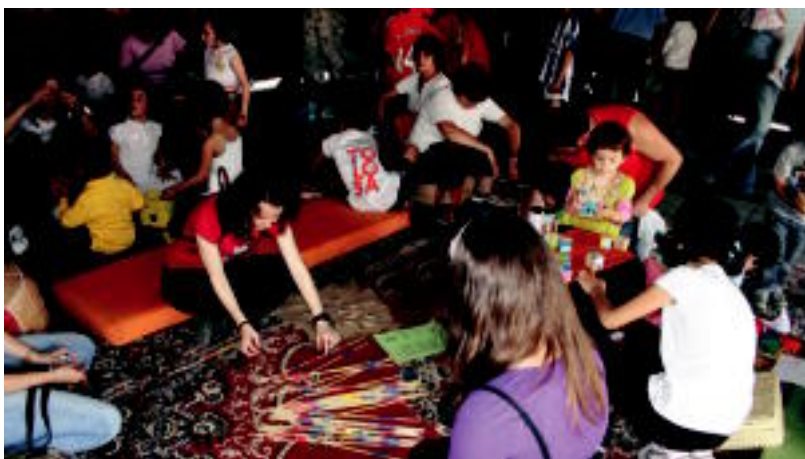
Ekitaldiz beteriko eguna izan zen atzokoa; haurrentzako tailerrekin hasi zuten eguna Plaza Berrian. A. IMAZ