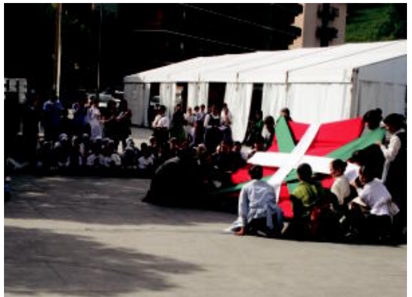
III. Dantzari Txiki Egunean 300 haur inguru elkartzea espero zuten. Alurr Egunean 200 aritu ziren. ASIER IMAZ