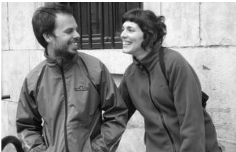
Tolosako egonaldian oso gustura izan da bikote txirridulari portugaldarra.

www.hospitality.com webgunean adibidez, 15.000 pertsona dauka Espainian, eta Alemanian 40.000 baino gehiago. «Herrialdeak eta jendea ezagutzeko modu ona da», dio Olaetxeak. Gainera etxe batean izan ondoren, bi aldeek bere iritzia idatz dezakete webgunean, besteentzat ere erreferentzia puntua izan dadin.