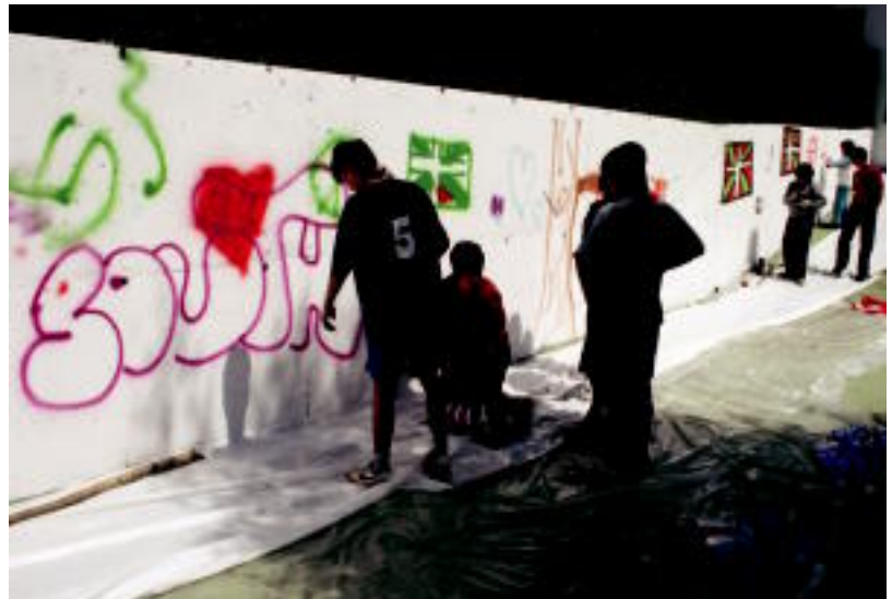
Atzo bezala, hurrengo larunbatean ere graffitiak egiteko aukera egongo da Leitzako igerilekuan. ASIER IMAZ

Lizartzan Udal Alternatiboak antolatutako Kultur Astearen baitan ume jolasak izan ziren lehenik eta antzerki emanaldia ondoren. Gaur, berriz, Helduen Eguna izango da eta hamaiketako, pilota saioa, bazkaria eta herri kirolak izango dituzte egun osoan zehar.