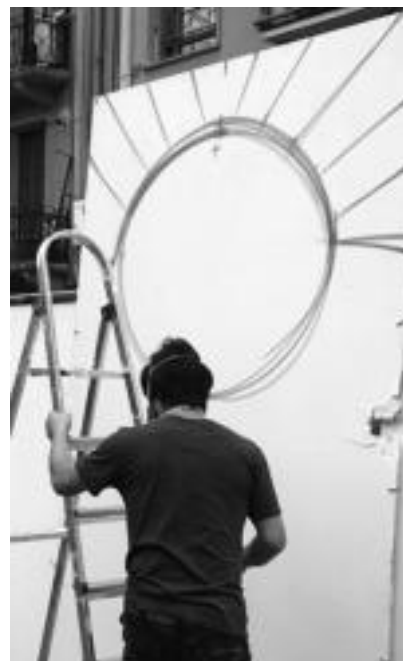
Haima bat atondu zuten Plaza Berrian goizean; arratsaldean, graffitiak egiten aritu ziren.