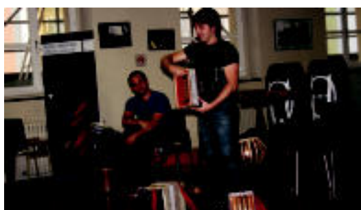
O+Hatz taldeko kideak, atzo, Musika Eskolan. E. EZEIZA

TOLOSA O+Hatz taldeko kideak Musika Eskolan izan ziren atzo ikasleekin 2