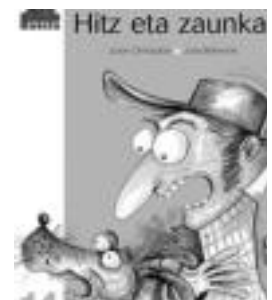
'Hitz eta zaunka' liburuak. HITZA

Bere lan propioak idazten berandu hasi bazen ere, oparora du literatur-ekoizpena, irudimentsua eta bizia, liburu bereziz osatua, adibidez, Antonio Bolas edo Ilunorduak eta argilaurdenak , haurrentzako poesia bikainez osatua.