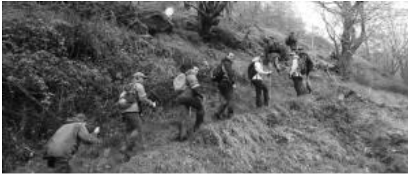
Leitzako Mugak ezagutzeko lehen mendi irteera ekainaren azken asteburuan egin zuten.