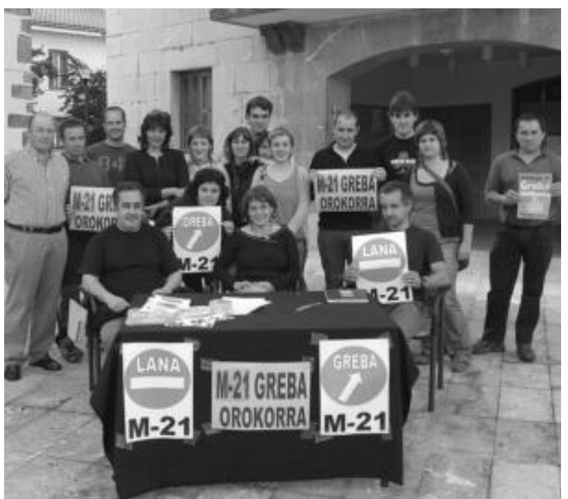
Ibarrako zein Adunako Greba Komiteek kalera ateratzeko deia luzatu dute.

guztien artean, bakoitzak bere esparruan, bilatu behar» dutelako da.