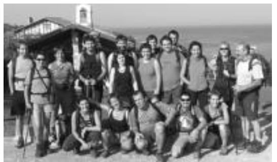
Maulera jende asko joango dela uste dute talde antolatzaileek. HITZA