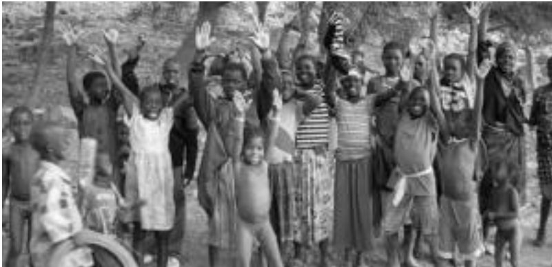
Hiru billabonatarrek Afrikara egindako bidaia erakusten duen ikus-entzunezkoa ikusgai izango da etzi. HITZA