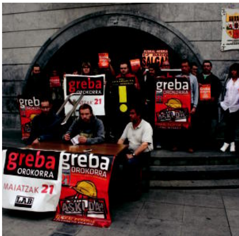
Ibarrako Greba Komiteak egin zuen agerraldiaren une bat. R. CALVO

MOBILIZAZIOAK Tolosan manifestaziora deitu dute; Leitzan, auto karabana eta manifestazioa egingo dituzte 6