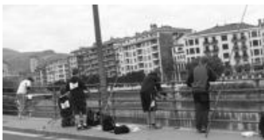
Txapelketako irabazleak sariarekin Zerkausian; txapelketako uze bat.

Gipuzkoa mailako txapelketa honetan, Tolosaldekoak izan ziren parte-hartzaile gehienak. Hala ere, Lasarte, Beasain, Oñati eta Donostiatik ere etorri ziren batzuk.