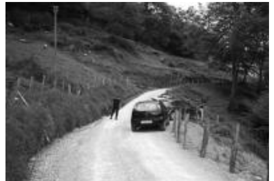
Ertzaintzak Eutelako etxolarako bidea moztu zuen atzo arratsaldean. A.I.

Ertzaintzaren arabera, atzo 15:45ak aldera jaso zuten deia, gorpua aurkitu zutela esanez. Ertzainak bertara iristerakoan, gizonezkoa hilda zegoela baieztatu eta indarkeria zantzuak zituela ikusi zuten.