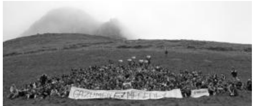
Ehunka lagun igo ziren Zelatunera Gazumeko Parke Eolikoaren aurka elkarteko.

Ingurumena » Zelatun egin zuten elkarretaratzea herenegun eguerdian, 'Gazumen ez, mesedez' zioen pankartarekin.