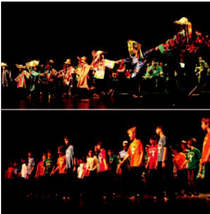
Leidor aretoan emanaldia eskaini zuten herenegun Musika Eskolako eta Udaberri dantza taldeko ikasleek. I. LAHIDALGA

IGOTZEKOAK Hamalau zortzimilakoen erronka osatzeko Annapurna eta Shisha Pangma mendiak falta zaizkio z