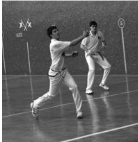
Nafarroako Herri Arteko Txapelketa Leitzak eta Arbizuk jokatu zuten herenegun Amazabalen. Jon Jaunarenak erakustaldia eskaini zuen. IDOIA LAHIDALGA