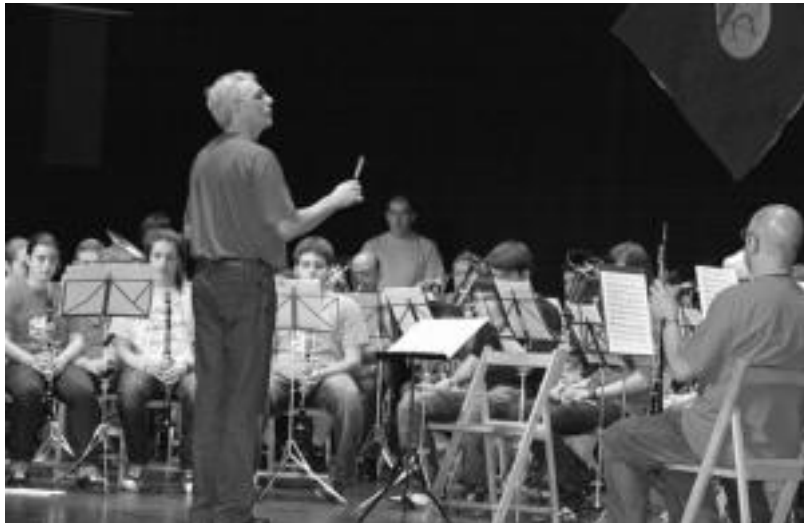
Udaberri dantza taldeko ikasleak eta Musika Eskolakoak Leidorren izan ziren herenegun. NEKA

Gaur, O+Hatz taldekoak Musika Eskolan izango dira. Gazte hauek euskal musika-tresnak modu entretenigarrian emango dituzte ezagutzera. Horrekin batera, jendeari beraien tresnei buruzko informazio teorikoa eta soinu-duna emango diete, alde tradizionalak nahiz modernoak jorratuz. Lehenengozatian, taldeko kideek euskal musika-tresnak aurkeztuko dituzte (txalaparta, txistua eta danbolina, txirula, trikitixa, panderoa, alboka). Tresna bakoitzari buruzko azalpen teorikoa emango dute: alde fisikoak, teknikoak, historikoak, eraikuntzarekin loturikoak... Jarraian, musika-tresna bakoitzarekin abesti bat joko dute. Egitarau tradizionala