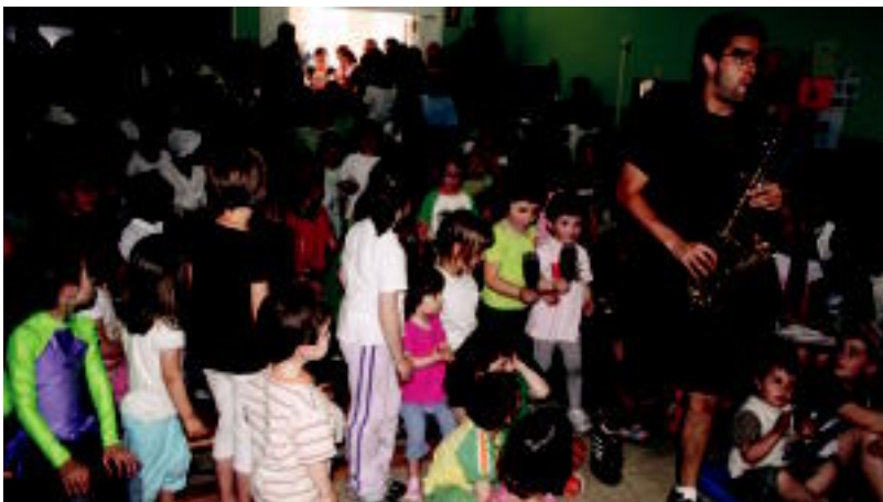
Haur, Guraso eta Eskolen Arteko X. Topaketa burutu zen atzo Areson. Goizean jolasean aritu ziren haurrak. A. IMAZ

ANOETA • Hamar urte hauetan Anoetako gazte ugariaren biltoki izan da Gaztetxea. Atzo, urteurren hau ospatzeko asmoz, 80 anoetar inguru bildu ziren bertan bazkaltzera. Ekitaldian, gutun bat irakurri zuten Gaztetxearen sorreran parte hartu zutenek. Bertan azaltzen zuten nola garai haiek gogoratzean bitako oroitzapenak etortzen zaizkien: festa eta lanarenak. Hamar urte hauetan gauza batzuk aldatu direla diote, baina beste batzuek egun ere bizi-bizirik jarraitzen dutela eta jarraituko dutela argi dute. Esaterako, ilusioak, lanerako prestutasunak, eta parrandarako gogoak. E. EZIZIA