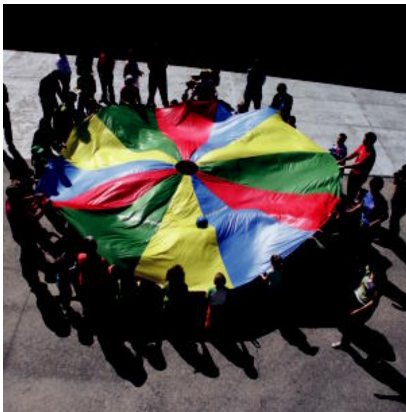
Aresoko udaletxearen aurrean jolasean aritu ziren goizean. A. IMAZ