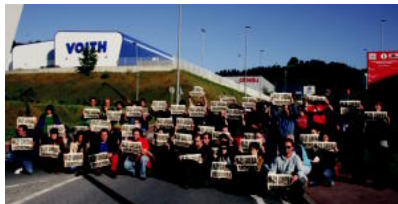
Tolosaldeko ezker abertzaleko hainbat ordezkari agerraldia egin zuten Apatta Erreka industrialgunean. E. EZEIZA

Bestalde, aipatutako aldaketa politiko eta sozialaren bidean ezin-