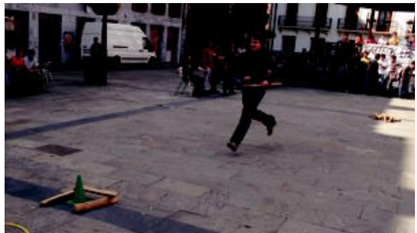
Goizean, Mulambo perkusio taldekoek ikastaroa eman zuten; arratsaldean, herri jolasak egin zituzten. E.E./A.I.