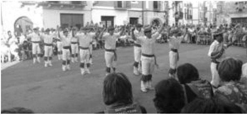
Herriko jaietan eskaini izan dute San Joan dantza; biharkoa, hala ere, emanaldi berezia izango da. HITZA