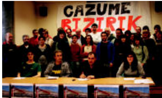
Eragileek Errezilen egin zuten prentsaurrekoa. E. EZBIZA

Ez dute zalantzan jartzen energia berriztagarriak «ingurumenaren ikuspegitik interes handikoa» bezala aurkezten direnean. «Baina energia-iturri berriak bilatzen hasi aurretik, gure energia-kontsumoa aztertu eta gutxitzeko ahaleginak egin behar direlakoan gaude», azaldu zuten prentsaurre-