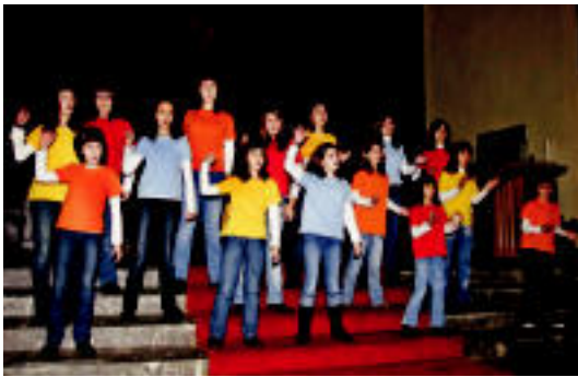
Txintxarri Txiki abesbatzakoak, Alegiako elizan kantatzen. HITZA