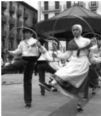
Udaberri dantza taldeko ikasleak eta Udal Musika Eskolakoak elkarrekin ikusteko aukera izango da etzi.

Ikuskizunean, Udaberri dantza taldeko haurrek, Musika Eskolako ikasleek zuzenean joko dituzten doinu berriak dantzatu dituzte. Gainera, hauek, bereziki egin horretarako prestatu dituzten dantzak izango dira. Orain arte ez dute horrelako emanaldirik eskaini, eta dantza taldekoen esanetan, «ilusio handiz prestatzen gabiltza emana-