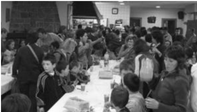
Gurasoen eta haurren bazkaria ez da faltako Aresoko X. Topaketan. Janaria etxetik eraman behar da. JAIONE ASTIBIA