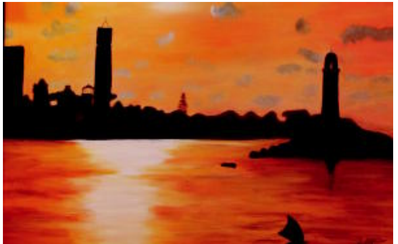
Margolan batean baino gehiagotan kolore biziak erabili ditu zizurkildarrak.