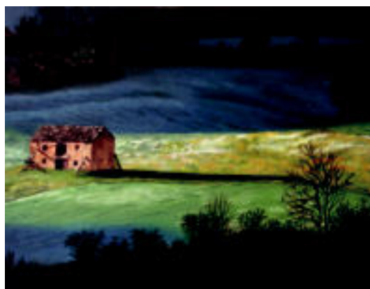
Erakusketan ikusgai dagoen margoetako bat. HITZA

Amuarrain eta Zarboen Txapelketa etzi, Oriako uretan 3