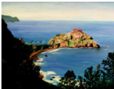
Gaztelugatxe ezkerrean. Normalean argazkiari begira egiten ditu lanak. Eskuinean, Daliren 'Neskatila leihoan'.