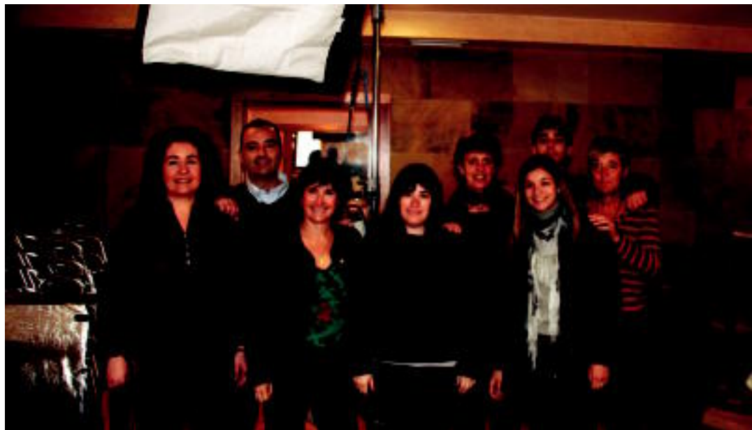
'Axun eta Maite' filmaren grabaketan parte hartu duten figuranteak, kabela kafetegia barruan. I. GARCIA