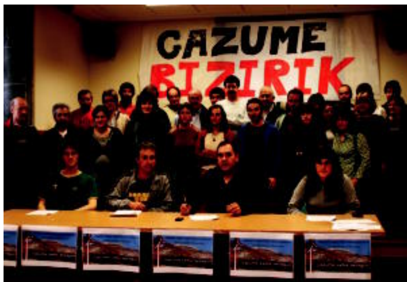
'Gazume salba dezagun' lelopean hainbat eragilek egin zuten herenegun agerraldia, tartean eskualdekoak. E.E.

PROTESTA Elkarretaratzera deitu dute etzi, Zelatunen; «parkearen etekinak ez du txikizioa justifikatzen», diote 4