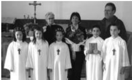
Abaltzisketan jauntzea egin zuten gazteak. HITZA

Beraz, urtegiak regatatarako edo bertan hankak sartuta turismoa bultzatzeko idearen aurka nagoela garbi adierazi nahi nuke. Alderantziz, aipatutako aktibitateak baxestua izan beharko luke leku honetarako. Artikutza (Añarbe) antzera.