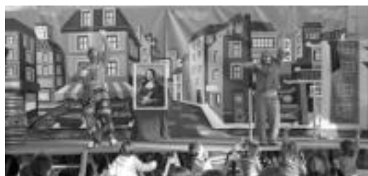
Poxpolo eta Mokolo emanaldi batean.