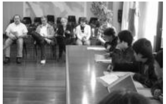
Anoetako Udalekoek adi entzun zituzten ikasleen konpromisoak. HITZA

Datorren astelehenean (hilak 18), Bidegoianen izango da eskolako Agenda 21 proiektuko udal batzarra. Orduan ere, ikasleek egingo dituzte proposamenak eta ondorioak aterako dituzte.