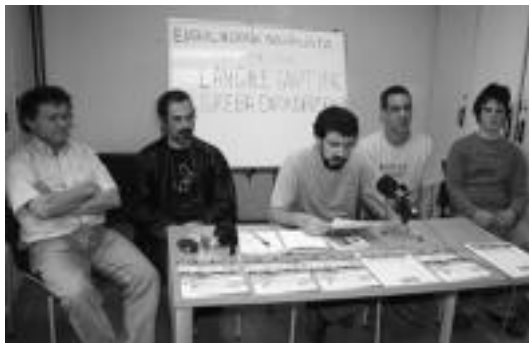
Euskal Herria Sozialistako kideak Tolosako Kultur Etxean herenegun. A. IMAZ

EH Sozialistako kideen esanetan «langileen aurkako erasoak hain besterik ez dira egin». Hauen arduradun enpresariak, EAJ eta Eusko Jaurilaritza berria egiten dituzte: «Euskal enpresariak eta hauek ordezkatzeko dituen alderdiak, EAJk, beren herria horren-