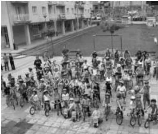
Eskolako haurrek Bizikleta Martxa egin zuten asteartean. E. EZEIZA