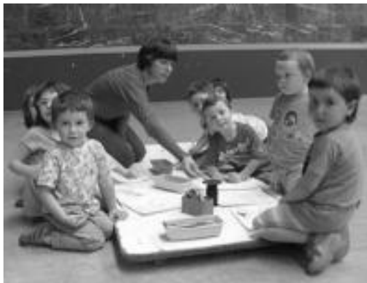
Eskolaren Asteko lehen egunean eskulan tailerra izan zuten lizartzarrek. HITZA

Lizartza » Gaur Alkizako eta Adunako ikasleen bisita izango dute eta bihar egun pasa egingo dute Araman eta Ekain Berrin.