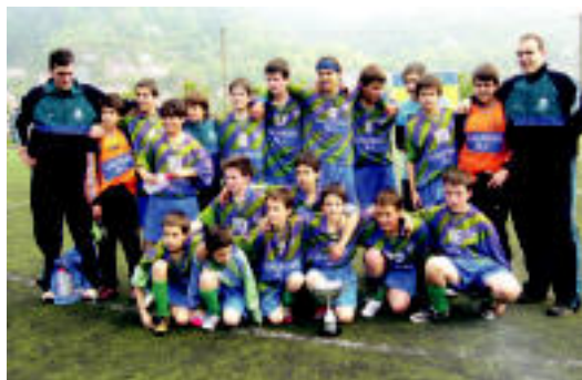
Argazkian, Kopa lortu zuten jokalariek eta entrenatzaileak.