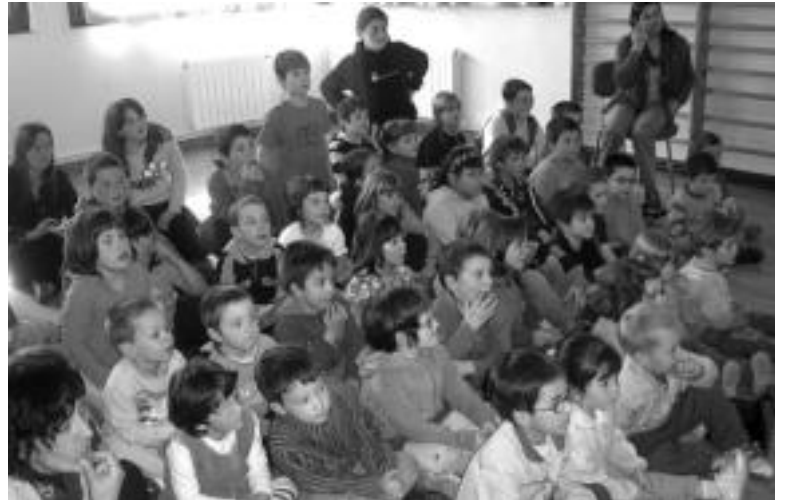
Zizurkilien haurrak udaletxera joan ziren proposamenak ezagutaraztera. Ikaztegiatan (eskuinean) 49 haurrek hartu zuten parte proiektuan. HITZA