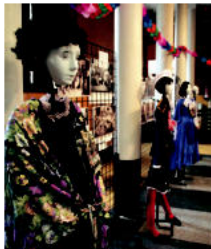
Azken 25 urteetan Inauterietan erabilitako mozorroak, argazki zaharrak eta dokumentuak ikus daitezke erakusketan. I.T.