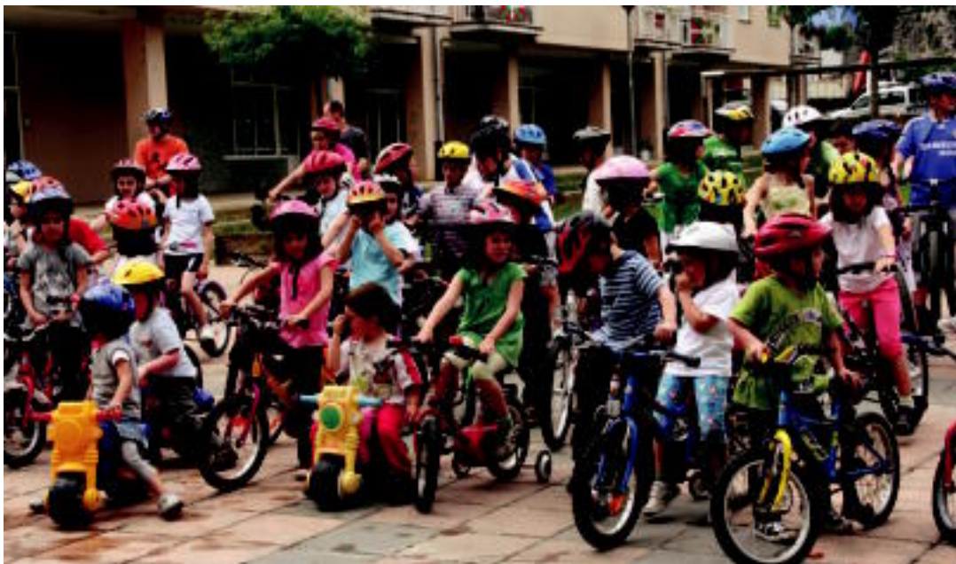
Bizikleta martxa egin zuten eskolakoek; Lehen Hezkuntzakoek 8 bat kilometro egin zituzten gurasoekin batera Nafarroako mugaraino eta Haur Hezkuntzakoek, aldiz, plazan bertan egin zuten buelta bertan egindako zirkuitu batean. ESTI EZEIZA