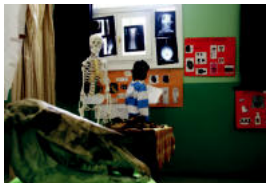
Giza Gorputzaren Museoa erakutsi zieten gurasoei. A. IMAZ

ALEGIA Ertzainek bi animalien identifikazio zenbaki okerra eman zuten Foru Aldundian 3