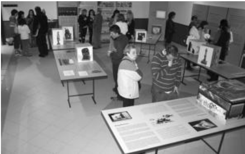
'Oteiza, bizirako proiektua' erakusketaren inaugurazioa egin zuten atzo Atxulondo kultur etxean. I. GARCIA