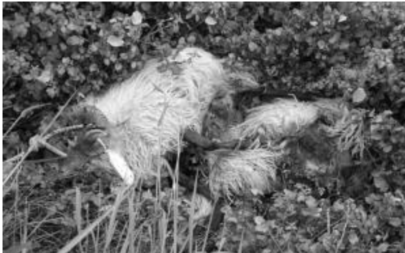
Ertzainek gutxienez hiruna tiro egin zizkieten aharietara. Sasien artean daude oraindik. HITZA

Bere lanean jarraitu zuen artzainak eta anaiari errepedera begiratzera joateko eskatu zion eta zera somatu zuen: Osibar parean biondaz barruti aldera belarrazapaldua, ahariak bertan egonda edo. «Horregatik pentsatzen dut ahariak han egon zirela lotuta».