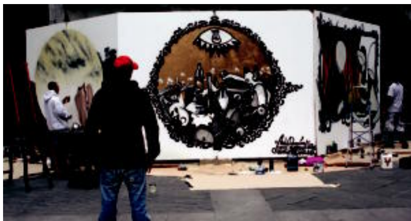
Txileko bost artistek euren lanak egin zituzten Plaza Zaharrean; lau egunez izango dira bertan ikusgai. I. TERRADILLOS