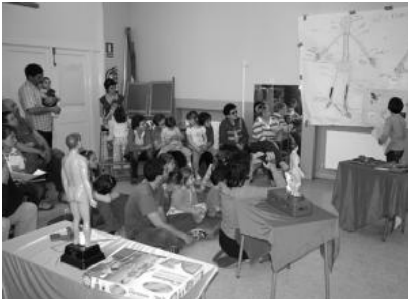
Aresoko Eskolako ikasleek Giza Gorputzaren Museoa antolatu zuten eskolako gimnastika gelan.