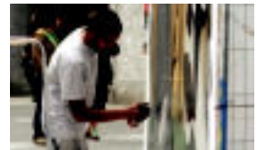
Egun osoan zehar graffitiak egiten egon ziren Tolosako artistak. Bertatik igaro ziren herritarren ingurmin handia sortu zuen. r. / r.