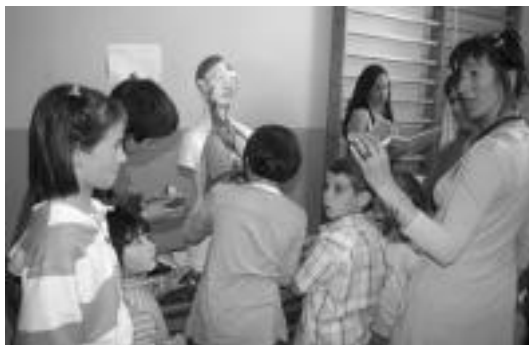
Ikasleek gurasoei azalpenak eskaini zizkieten Giza Gorputzaren Museoa. A.I.

Hilabete eta erdian ikasleek «lan txalogarria» egin dute. Horren