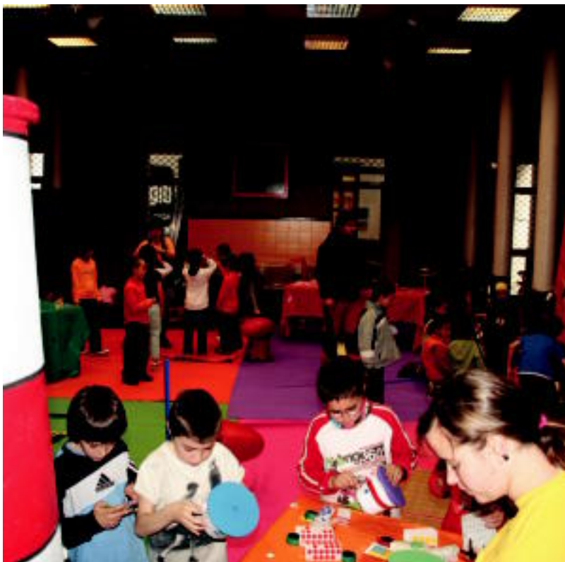
Tolosako Kultur Etxean bildu dira egunotan ikasleak, 'Munduari bira jolasean' ekimenean parte hartzeko. R. CALVO