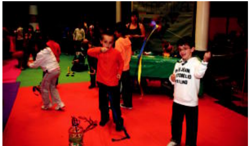
Ameriketako gunean Brasileko kariokak egin zituzten umeak eta ondoren horiekin jolastan ere aritu ziren. R. CALVO

Europar, aldiz, berez aristokraziarekin erlazionatzen den eta Irlandatik datorren krocket jokoan