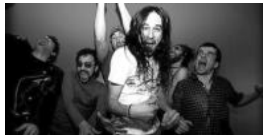
Acido C taldea Donostiatik dator beraien azken lana aurkezteko asmoz; Mamba Beat berriz jendea dantzan jartzen saiatuko da. HITZA