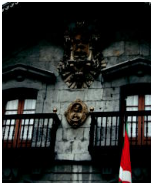
Alegiako Udalarekin batera, Anoetak eta Arrasatek onartu dute mozioa. N. U.

ez du oraindik merezi duen aitormena jaso». Frankismo garaiko diktaduran izan zen errepresioa ezkatutaz garatu zen «ereduzko Baina «honela Gerra Zibileko zauriak baztertu egiten zirela pentsatu