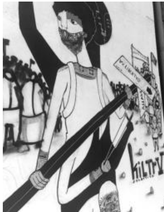
Txileko artista taldearen lanetako bat.