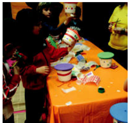
Afrikar tinbalak egin eta apaindu zituzten neska-mutilek. R. CALVO