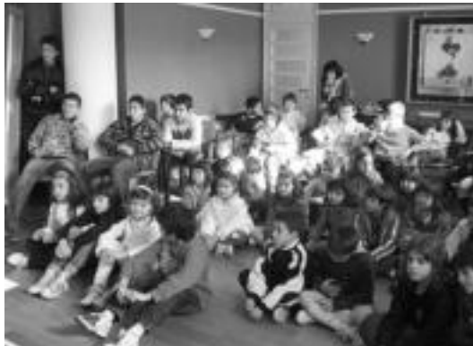
Hainbat ikasle izan ziren atzo udaletxean aurkezpena egiten.