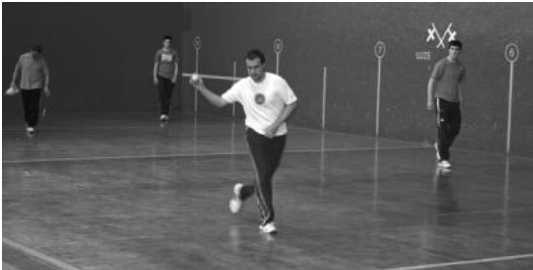
Xabier eta Jon Jaunarenak bihar jokatuko dute. Atzo Bengoetxea VII.a eta Txoperena monitorearekin entrenamendua egin zuten. ASIER IMAZ