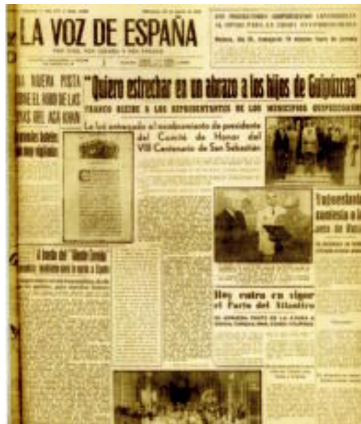
1949. urtean Gipuzkoak Franco ohorezko alkate izendatu zuen. ALEGIAKO UDALAA

Diktadura honek 40 urtez iraun zuen, baina «pairatutako oinazeak