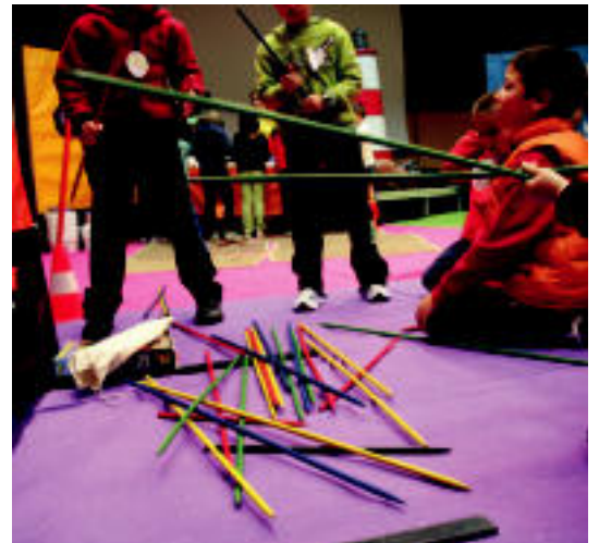
Asian mikadosen jolastan egon ziren Ibarra eta Tolosako haurrak. R. CALVO