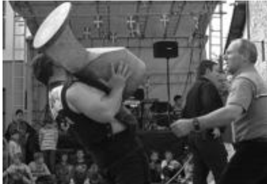
Jende asko bildu zen igandean Asteasuko herri kirolak ikustera.

«Lehen 20 eta 30 urte bitarteko gazte asko zeuden herrian eta haiek gaueko jaiak zuten gogoko, orain berriz, gehiago dira umeak dituzten gurasoak eta haiek ere