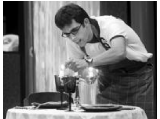
Larunbat honetan, 'Atejoka' antzezlanak ikusgai izango da Leidorren. HITZA