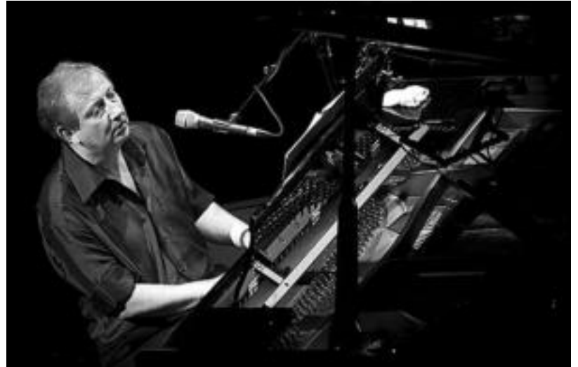
Mundua Tolosan zikloaren baitan, Wim Mertens piano-jotzailearen emanaldia izango da hilaren 29an.

■ Jantzi eta argazki erakusketa. Aiz-Orratz/Veleta elkarteak bere 75. urteurrena ospatzeko antolatu dituen ekimenen baitan dago hau. Hilaren 12tik 20ra izango da.