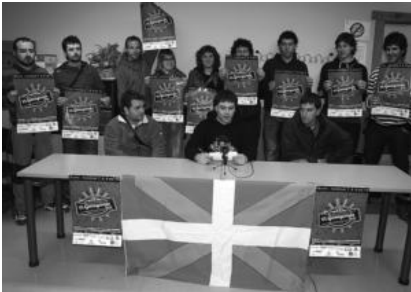
Talde ezberdinetako kideek eta herritarrek etzi hasiko den Ibarako VI. Garagardo Festa auzetu dute. ASIER IMAZ