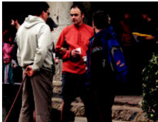
Behelaina izan bazen ere, oro har eguraldi ona izan zen; Sei ordu eta erdi eta zortzi inguru behar izan zituzten mendizaleek ibilbidea burutzeko. IYUYA URRUTIA

BERASTEGI «Oso gustura» daude Basurdekoak parte-hartzea «uste baino altuagoa» izan zelako 6