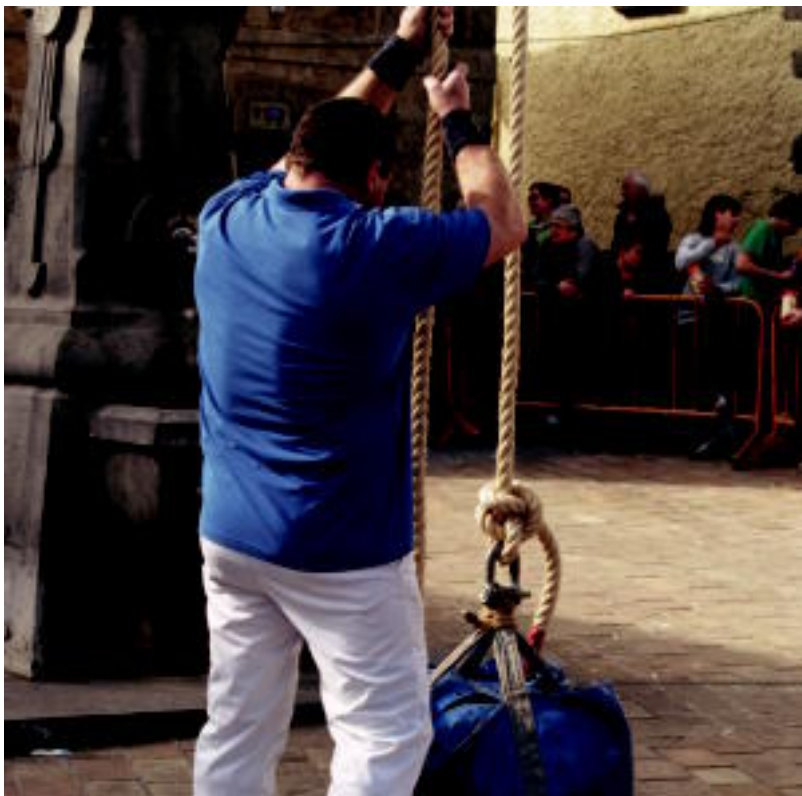
Asteasuko Santa Kruz jaien barruan herri kirolak izan ziren eta jendetza bildu zen ikuskizunaz gozatzeraz.