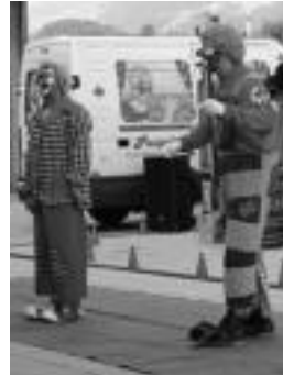
Poxpolo ta Mokolo. E. EZBIZA

Beste ekitaldi bereziak frontoiaren aurkezpen herrikoia eta Lore Amenabar akordeoi-jole gazteirurarrari egingo dioten omenaldia izango dira.