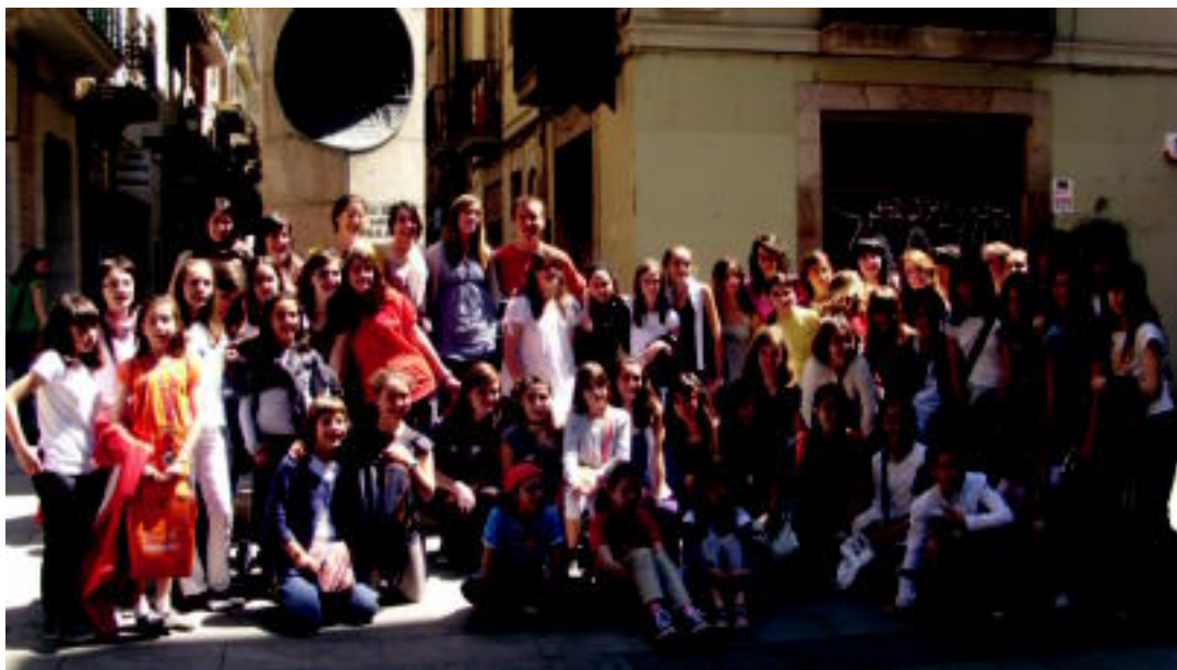
Graciako El Circlen abestu zuen Laskorain abesbatzak. Ekainaren bukaeran Els Picarols-ekoek bisitatuko dute Tolosaldea, Laskorain abesbatzako kideen etxeetan bazkalduz eta lo eginez. Tolosaldekoak desiatzen daude. HITZA