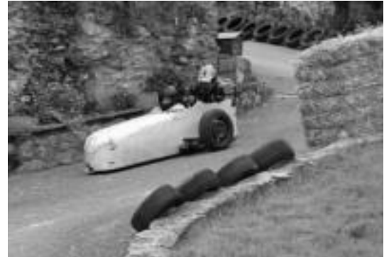
Bigarren urtez antolatu dute goitibera txapelketa Oresako jaietan. R. CALVO

Guztira 17 goitiberak hartu zuten parte txapelketan eta hiru sari banatu zituzten: azkarrenari, neumatika mailako Sorgintxulok irabazi zuena; gazte azkarrenari, neumatikako Zakotzek eskuratu zuena; eta xebearenari, bizikleta itxurakoak irabazi zuena (Gravity bike mailakoa). Oresarrek ere hartu zuten parte euren goitiberekin