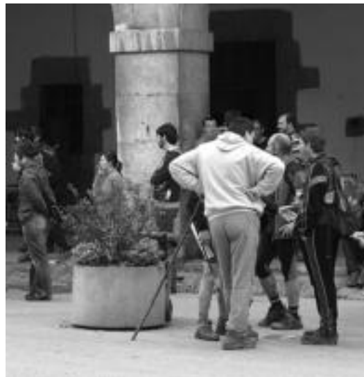
201 pertsonak hartu zuten parte Berastegiko XVII. Ibilaldi Neuratuan. I. URRUTIA

Berez proban bost kontrol jarri behar zituzten, baina azkenean Urepeleko tontorrean ez zuten jarri, «behe lainoa zela eta despistatu samar ibili ziren eta parte-hartzaileak». «18 urtetik hasi eta 60 urte bitarteko parte-hartzaileak izan ziren. Leku desberdinekoak ere izan ziren, neska bat Gasteizetik ere etorri zen», gaineratu du Zubillagak. Antolatzaileek, era berean, eskerrak eman nahi dizkiete parte-hartzaile guztiei.