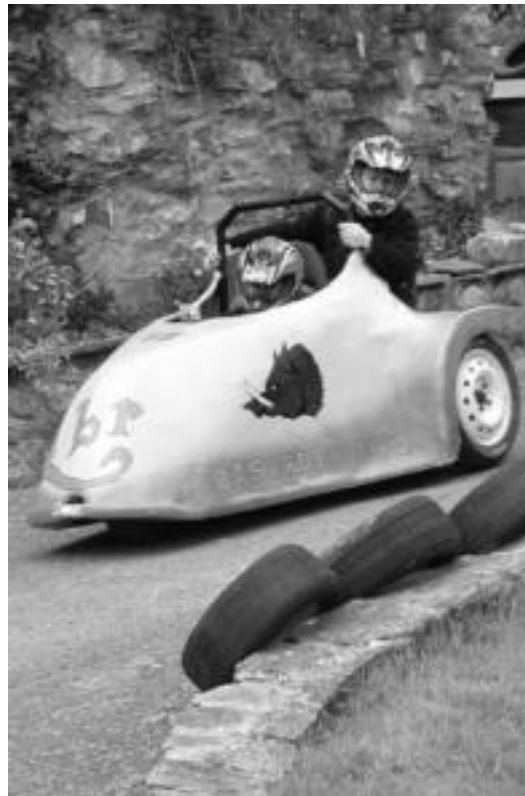
Guztira 17 goitiberak hartu zuten parte Orexa txapelketan. R. CALVO

Simonen igoerarekin amaituko dituzte jaiak gaur, 21:00etan.