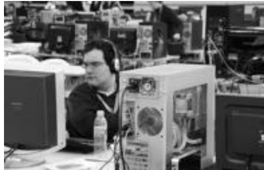
Modding-a ordenagailuaren itxura aldatzean datza. R. CALVO

Modding-aren oinarria ordenagailuaren aldaketa estetiko da. Erabiltzaileak sistema desberdin eta original baten bila dihardute, horretarako ordenagailuaren