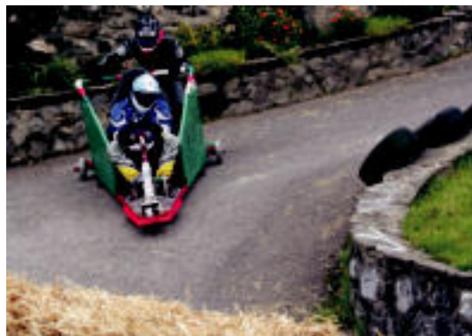
Goian, Asteasuko duatloia. Behean Orexan, goitibehera txapelketa. R. CALVO