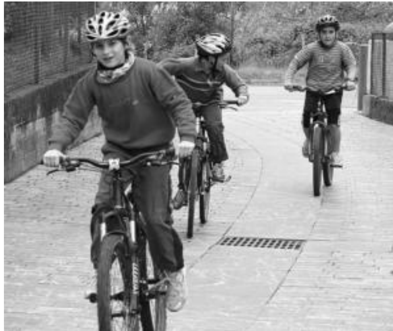
Txikienean duatloiarekin hasi zituzten atzo Santa Kruz jaiak Asteasun. R. CALVO

■ 21:00. A. M. Peñagarikano eta Iker Zubeldia bertolariak, ondoren oilarraren igoera.