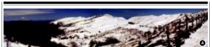
IBARATZA » «Guere inguruan ibili gara. Igaratzara joan ginen eluraz gozatzera, aurtien makina bat izan dugu eta! Irudian, Igaratzatik paisai paregabeak. www.vee.com (17.05.20)