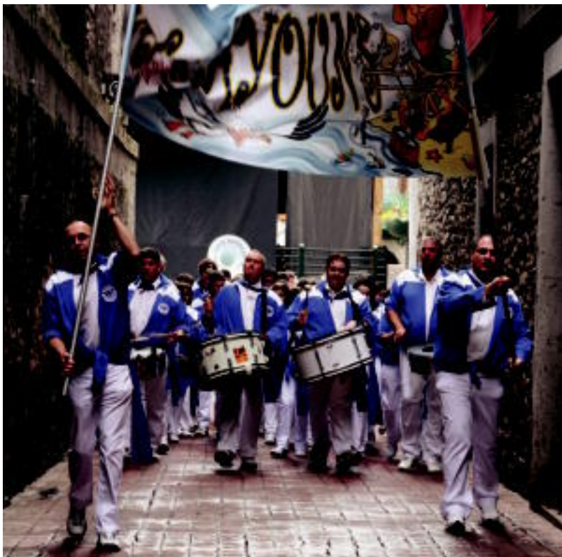
Frantziako La Mouette banda Alde Zaharrean aritu zen kalejiran. R. CALVO