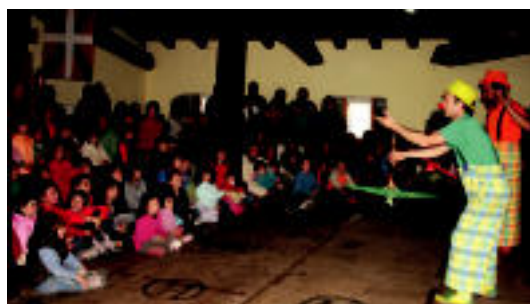
Atzoko pailazoan saioko une bat. A. IMAZ

OREXA Eguraldiak lagundu ez badu ere, jaiak ez du etenik; bihar amaituko dira 7