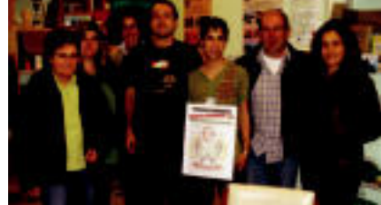
Tolosako Sahararekin elkarteko kideak, Maiztoz Borrokan egitarauaren aurkezpenaren...

Gizartea Fronte Polisarioaren sorreraren eta borroka armataruen hasieraren urteurrean hainbat ekitaldi izango dira.