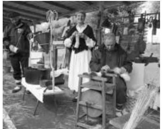
Artisauen lanak ikusmina piztu ohi du bisitarien artean.