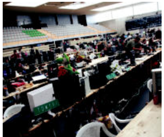
Usabal kiroldegia ordenagailuz beterik dago egunotan. R. CALVO