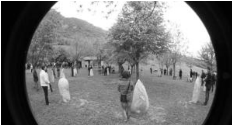
'Harrespila' eskulturaren bueltan elkartu ziren Enirio-Aralar Mankomunitatearen ordezkariak.