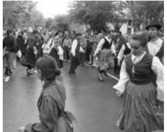
Dantzariak kolorea eta festa giroa eman zioten egunari.