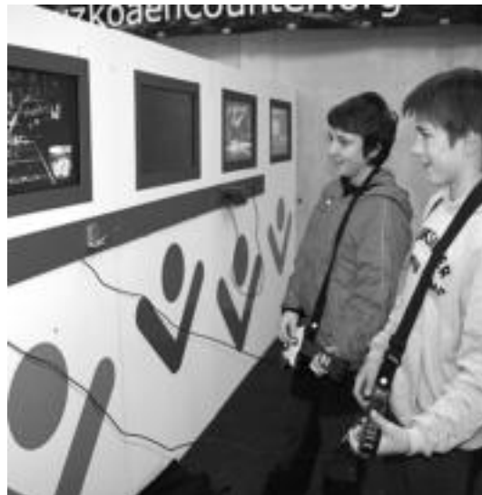
Askok izan ziren sarreran jarritako jokoetan aritzera gerturatutakoak. R. CALVO

Parte-hartzaileak bihar 18:00ak arte dute aukera 1.000 megatako abiadurari probetxua ateratzeko eta seguru egingo dutela, izan ere, gehienak ordenagailuen aurrean emango dute egun osoa, nahiz eta «jende askok ere hartzen du parte antolatutako tailer eta ekitaldietan».