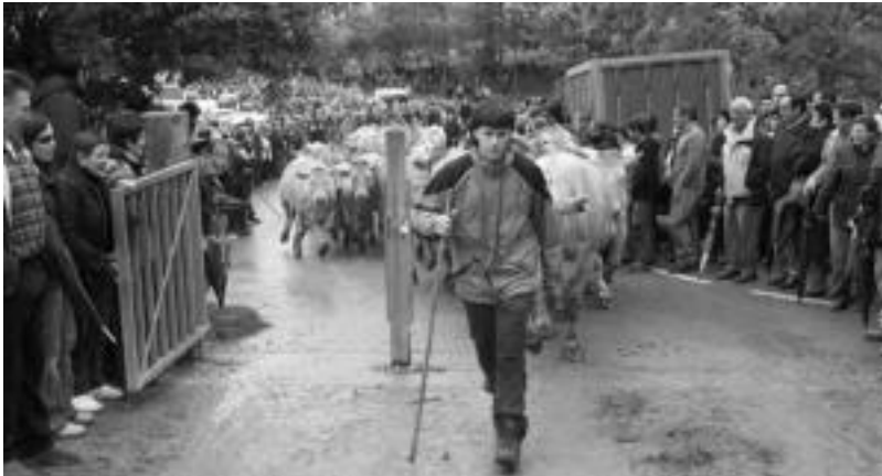
Behiak izan ziren Larraizko langa igarotzen aurrenekoak Aralarko goi larreetara bidean.