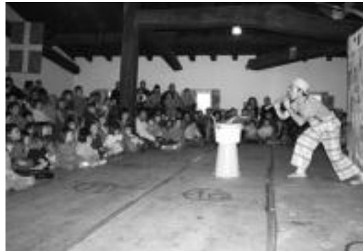
Gaztetxo nahiz guraso ugari gerturatu ziren pailazoan saiora. A. IMAZ