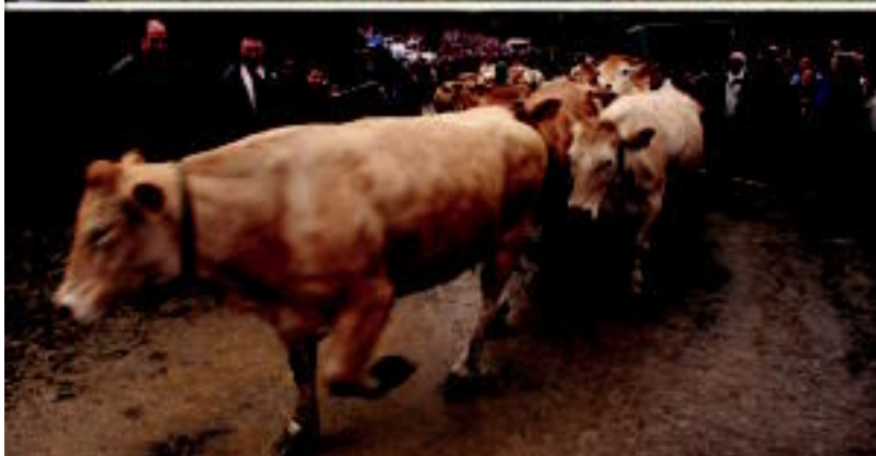
Goian, Guillermo Olmok egindako harrespilaren inaugurazioa. Behean, behiak mendira igo ziren unea. INAKI GURRUTXAGA