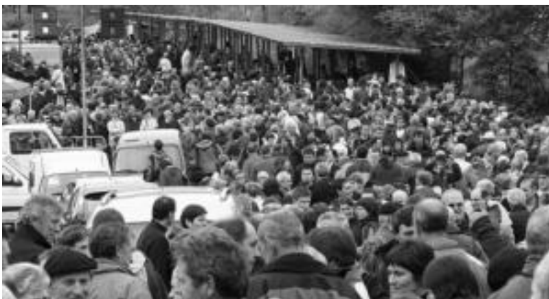
Eguerdi partean jende asko ibili zen Zamaoko atsedenekuan, irudian ikus daitekeen bezala.