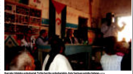
Ibarako Udaleko ordezkariak Tichlan herriko ordezkariekin, Aste Santuan egindako bidaiaren...

Lan horren emaitza izan da hirugarren aldiko pertsonari arreta eskaintza dien eta kultur ekintzarako arazo ezinbesteko izango diren proiektuak hain zuzen ere, berriro erantuzko emango die esan daiteke, azaldu dute Udalak.