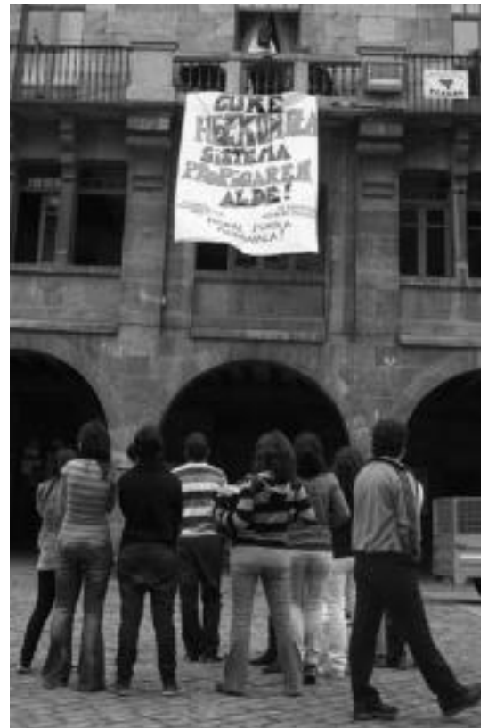
Ikasle-grebaren aldarrikapenak udaletxean zintzilikatu zituzten. A. IMAZ

eta horretarako hori ahalbidetzen duen hezkuntza sistema bat eraiki behar dugu. (...) Denon lana eta konpromisoa ezinbestekoa da gaur ametsa dena bihar errealitate izateko, tantaz tanta Hezkuntza Sistema Arrotzak borrokatu eta Euskal Eskola Nazionala eraikiko duen ikasle uholdea sortzeko. Konpromiso horren adibide gara gaur Euskal Herri osoan bildu garen ikasle guztiak».