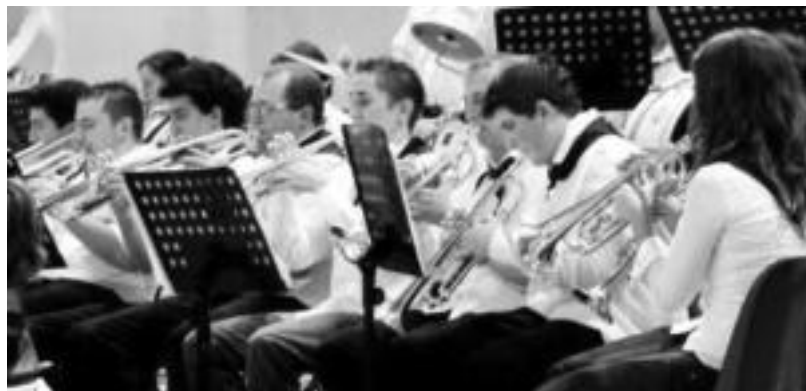
La Mouette banda Frantziako Landetako da; kalejiran ariko dira lehenik, Tolosako Alde Zaharrean. HITZA

Azken finean, erakunde publikoek kontratatutako kontzertuak gutxi tu egin dira.