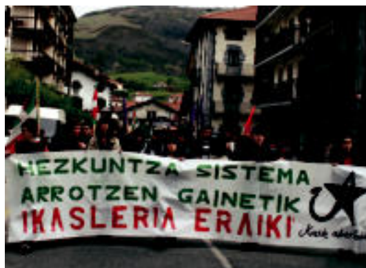
Goizean manifestazioa egin zuten herritik barna. A. IMAZ