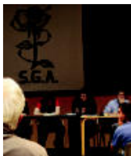
Herenegungo une bat. R. CALVO

TOLOSA Sanblaspiko Gazte Asanbladak antolatuta, Euskal Herria Sozialista, ELA eta LABeko ordezkariak izan ziren Kultur Etxean 6