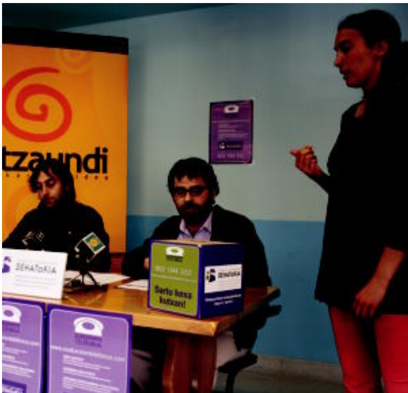
Atzo sinatu zuten hitzarmena Hizkuntz Eskubideen Behatokiak eta Galtzaundi Euskara Taldeak, Ibarra. R. CALVO