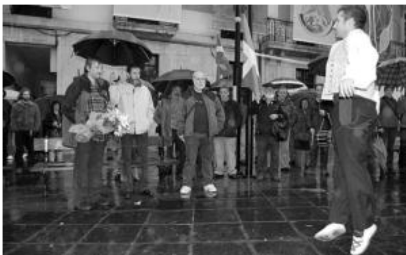
Goian, Jabi Gordori lore eskaintza egin zioten uena. Behean, aureskua dantzatzeko, Triangulon. HITZA