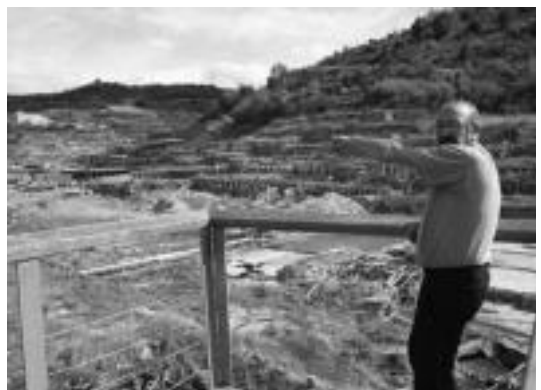
Arabako parajeetan Geurea ikurriña aldarrikatuz ibartarrak. A. IMAZ