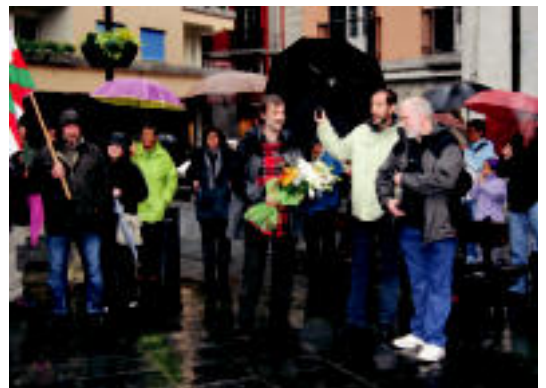
Triangulo plazan egin zioten harrera; irudian, lore eskaintzaren unea.

AMASA Hamazazpigarren aldiz egin zuten proba herenegun; pasa den urteko irabazle berdinak izan ziren; eguraldiak proba zaildu zuen 4