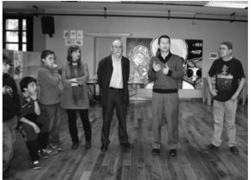
Atzo arratsaldean aurkeztu zuten jaialdia Gazte Topagunearen egoitzan. ESTI EZEIZA

Usabalen bertan, Tolosako Udalak beste 15 bideokontsola jarriko ditu nahi duen orok erabil ditzan. 10:00etatik 00:00etara egongo dira piztuta eta era guztietako jokuak izango dituzte: Wii Sports, Pro Evolution Soccer, Virtual Tennis, NBA Live, Singstar, Guitar Hero, Mario Kart Wii... Bestalde, Gazte Topagunearen egoitzan