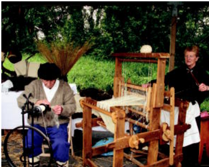
Animalien igoera baino, azokak eta erakusketek dute garrantzia Larraizko Larreen irekieran. NAIARA GARZIA

guztietako ordezkariak joango dira, Gipuzkoako ahalduen nagusia den Markel Olanoz gain. Hauek dira herriak: Amezketak, Abaltzisketa, Orendain, Ikaztegieta, Balarra, Beasain, Ataun, Lazkao, Gaintza, Arama, Altxaga, Itsasondo, Legorreta, Ordizia eta Zaldibia.