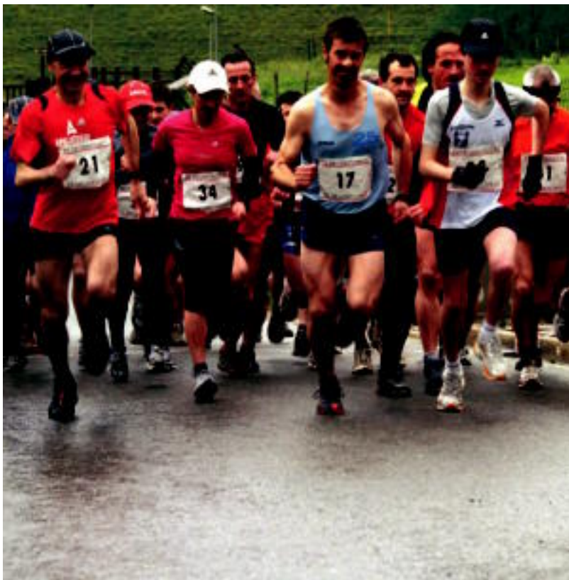
Parte-hartzaileak lasterketaren irteeraren unean. IVUYA URRUTIA

HELBURUA Arlo ezberdinen bitartez gazteak hurbildu nahi dituzte; ekimena gizarteratzea da aurtengo xedea 2