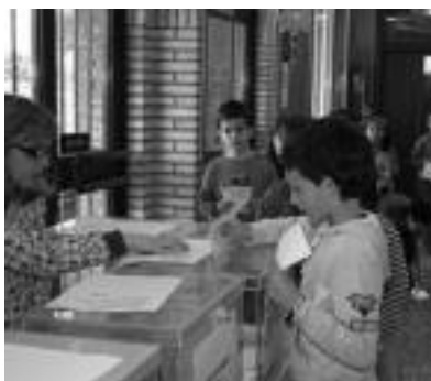
Ibarrako Uzturpe Ikastolan hauteskundeak. HITZA