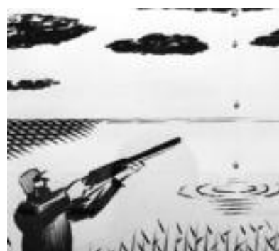
Umore satirikoak erabiliz modu zuzenean kontzientziatu nahi ditu El Rotok ikusleak, uraren beharraz. E. EZBIZA