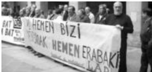
Kalitateko zerbitzu sozialen sistema publikoa exijitu zuten pentsiodunek. HITZA

Ekonomia » LABek «izaera arautzailea eta finantziario eta kudeaketa gaitasun osoa duen sistema» baten beharra ikusten du.