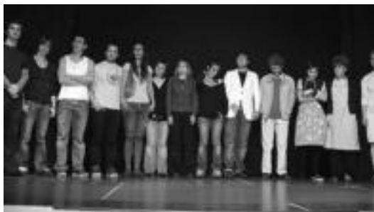
Lehenengo kanporaketan parte hartu zuten guztiak ateratako argazkia.

Lehenengo kanporaketaren emaitzarekin gustura daude antolatzaileek. Epaimahaiak La Tiriliparte-hartzailea eta ikus-entzulegoak Maneras de Sentir taldea aukeratu zituzten finalerdietara pasatzeko.