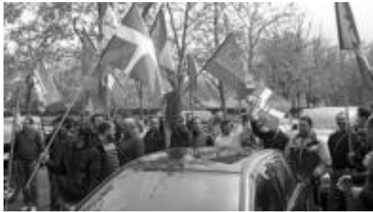
Langileak hasi dira mobilizazioak eginen. HITZA

Villabona Arteca Caucho Metal S.A. enpresan orain lau hilabete eta erdi onarturiko EREa bukatzeaz dago, LAB sindikatutik azaldu dutenez. Langileak hilabete hauetan jardunaldiaren %60an egon dira lan delegaritzak onarturiko espedienteetan. Lehen espedienteak bukatzeaz dagoela enpresak bi espediente aurkeztu dizkie langileei zein Lan Delegaritzari. Espediente batekin 20 langile kaleratzeko asmoa dauka enpresak eta bestearekin beste langile guztiak jardun-