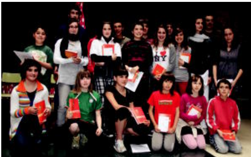
Anoetako Udalak eta Herri Ikastolak antolatutako Hizki-Marrazki Ipuin Marraztuen Lehiaketaren irabazleak. A. IMAZ