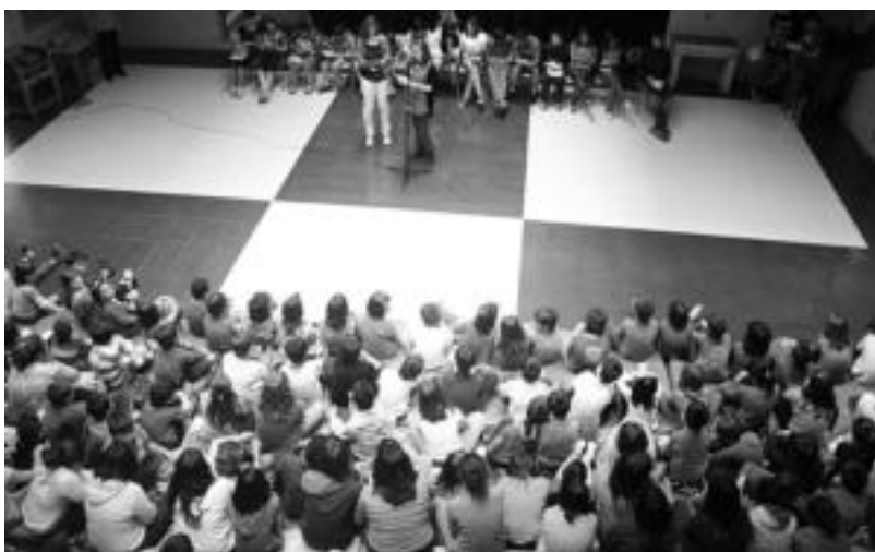
Leitzako Amazabal Institutuko Sorkuntza Literarioko Taldea goian. Beheran, Hizki-Marrakzi lehiaketako saridunak. A. I.