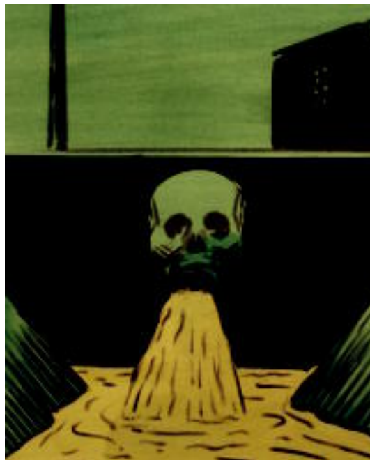
Modu satirikoan ohartarazi nahi du Andres Rabagok uraren beharraz. E. EZBEA

TOLOSA 'El Roto' artistaren 'Agua tinta' erakusketa ikusgai dago maiatzaren 17ra arte, Aranburu jauregian, Naturaldiaren baitan 3