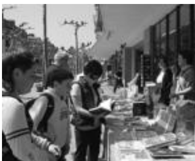
Tolosako Galarraga Liburutegian liburuak kalean. E. EZEIZA