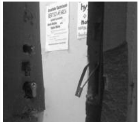
Oraingoan terrazako atea hautsi dute lapurrek barrura sartzeko. HITZA

dute dirurik gordetzen Gaztetxean eta oraingoan lapurtutako ez da izan kopuru handia. Lapurrek terrazako atea hautsi dute barrura sartzeko eta orain berria jarri behar dute Gaztetxeok. Orain gutxi mobilizazioak egin zituzten Gaztetxeok eta bertan azaldu zuten, «azkeneko miaketek eta lapurretek ez gaituzte geldituko».