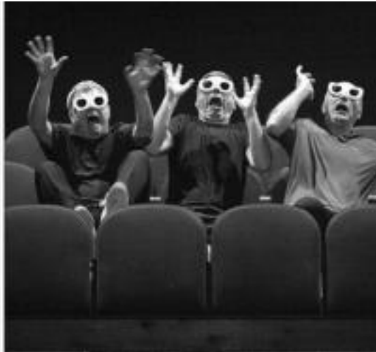
Orain artean taularatu dituzten zazpi ikuskizunetako unerik onenekin osatu dute '100% Tricicle' ikuskizuna.