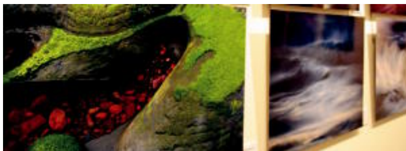
Guztira 40 argazki bildu dituzte; argazkilariek 'PorfolioNatural.com' egitasmoa partaidea dira. R. CALVO