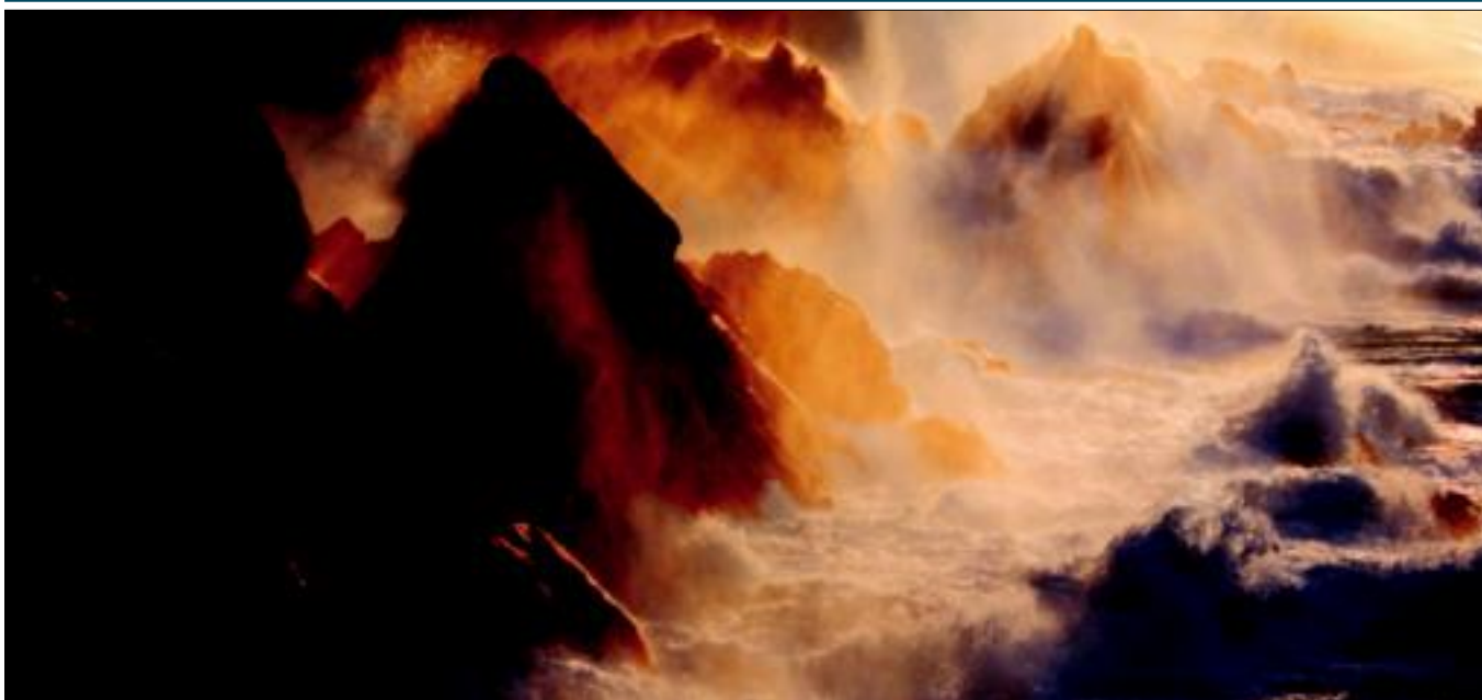
Isabel Diez bilbotarra kolorearen erabileran murgiltzen da bere lanen bitartez; Benito Izagirre kultur etxean dago ikusgai maiatzaren 7ra arte. ISABEL DIEZ