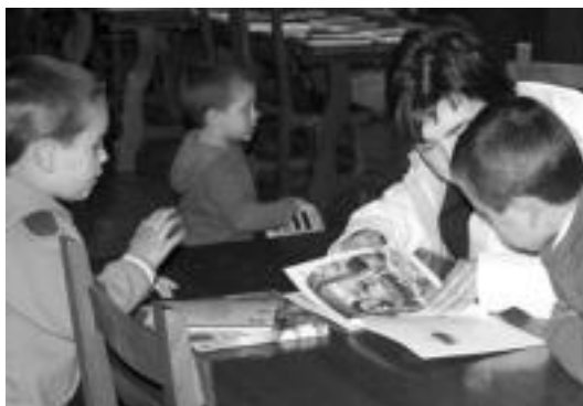
Belautzan, Liburuaren Egunaren harira irakurzaletasuna bultzatzen. A. IMAZ

Tolosan, esaterako, Udalak Galtezaundirekin batera antolatutako Irakurri, gozatu eta oparitu proiektua martxan jarriko dute gaur. Maileguan liburu hartu eta bueltatzerakoan txartela jasoko dute erabiltzaileek Elkar megadendan %25eko beharapenez gozatu ahal izateko. Haur Liburutegian, bestalde, liburu mailegu bakoitzeko piruleta bana jasoko dute