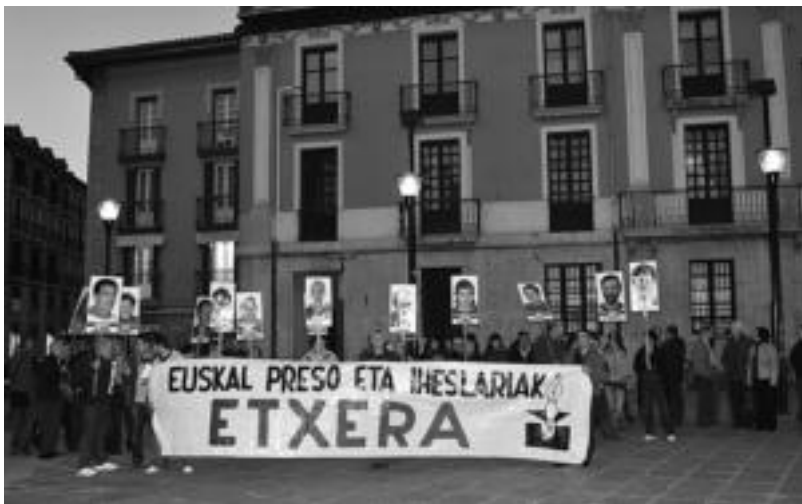
Tolosan iragan hilabetearen azken ostiralean, martxoaren 27an, Etxeratek deituta jende ugari elkartu zen. HITZA