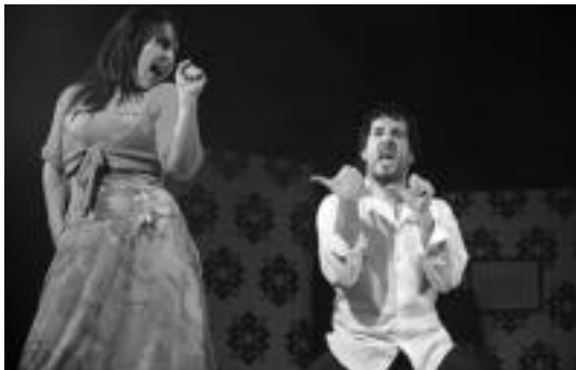
Ezkerrean, 'Kanpaiak jo bitartean' antzezlako une bat. Eskuinean, 'Malabreikers' kale-ikuskitzuneke bi aktoreak. HITZA