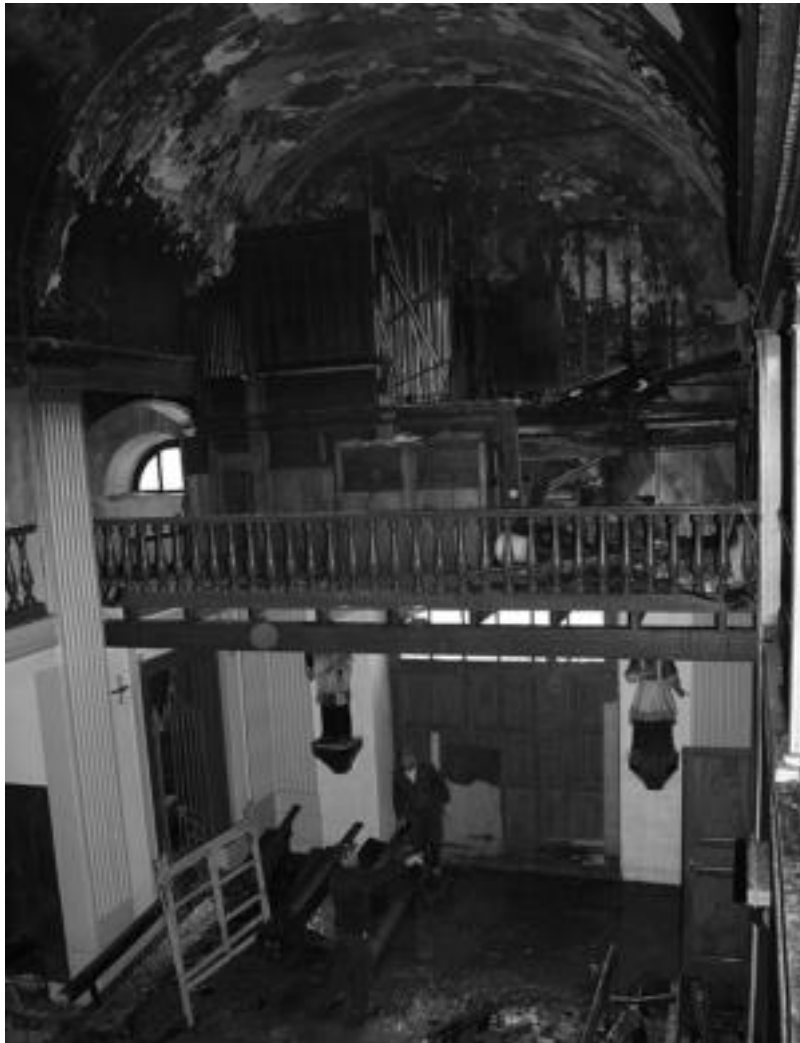
Koruari piztu zen sutea, eta ondorioz, zonalde hori izan zen kaltetuena. I.T.

Suhiltzaileek segituan itzali ahal izan zuten sutea, baina hori bai, hainbat leiho hautsi beharra izan zituzten behar bezala lan egiteko. Hala, herenegunoa kalteak aztertzeko eguna izan zen, eta baita