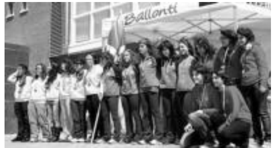
Euskadikoan, TAKeko neska jubenilek lortu zuten lehen postua.