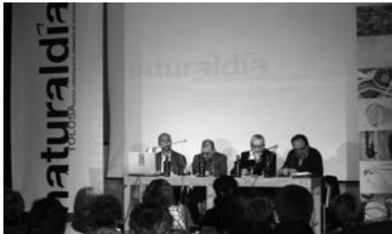
Hedabideen eraginaz eta erantzukizunaz mintzatu ziren atzo iluntzean eskainitako saioan. E. EZEIZA

Ingurumena » Xabier Garmendia izango da hizlari gaur iluntzeko saioan; 20:00etan izango da, Kultur Etxean.