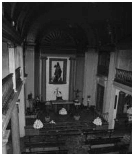
Elizaren gainerako zatiak ez zuen ia kalterik izan. I.T.

Arrameleko eliza Udalarena da. Hala, konpondu egin behar dela aprobetxatuz, guztia zaharbertitzea erabaki dute. «Beharra bazuen elizak, eta une hau baliatuko dugu horretarako».