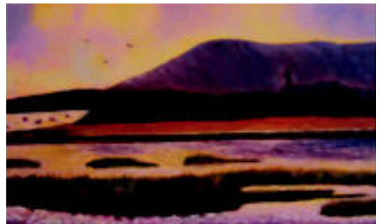
Arratsaldeko koloreak mendian, eskuinean herrixka bat duela. M. ALKIZA

Margolan guztiak azken hiru urteetan egindakoak dira. Gaur egun, ikaztegiatarra Ibiur urtegia ari da irudikatzen, egungo egoeran eta ondoren, urarekin beteta egin nahi du. Maiatzan zehar beste erakusketa bat jarriko dute, kasu honetan Azpeitian.