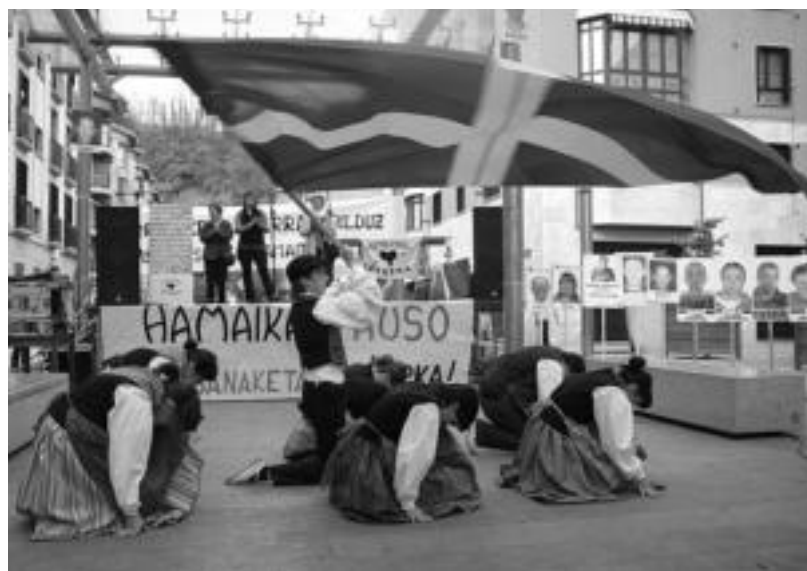
Dispertsioaren aurkako eskualdeko ekitaldia egin zuten ostegunetan Villabonan. Argazkian, dantzarien saioa.

Gure sendeak eta lagunak maitate ditugulako, guretzako gure bizitza direlako, astero-astero bisitak egiten jarraituko dugu. Aurrera jarraituko dugu: aurrera. Gure sendeak eta lagunak etxera eta bizirik bueltatu artean.