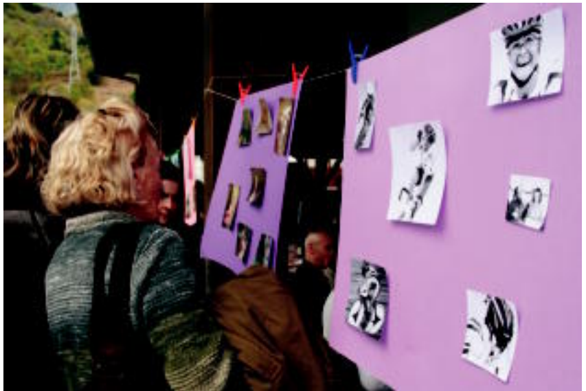
Dantzari gaztetxoek Agurra eskaini zioten bazkaldu aurretik. Mahaien inguruan Olaberriaren hainbat argazki ikus zitezkeen, bai gaur egungoak, baita txikia zenekoak ere. N. URBIZU