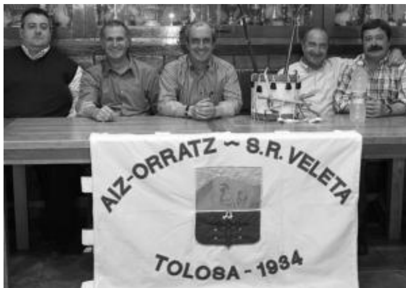
Aiz-Orratz elkarteak hainbat kide, 75. urteurreneko ekitaldiak aurkezten. IT.