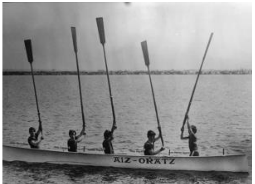
Aiz-Orratz elkarteak arraunlariak, Santanderren, 1977an. Espainiako bandera irabazi zuteneko une bat. HITZA