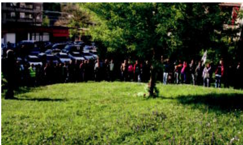
Omenaldia egin zieten «sakabanaketak hil zituen» eskualdeko hiru preso eta senide bati. I. GARCIA