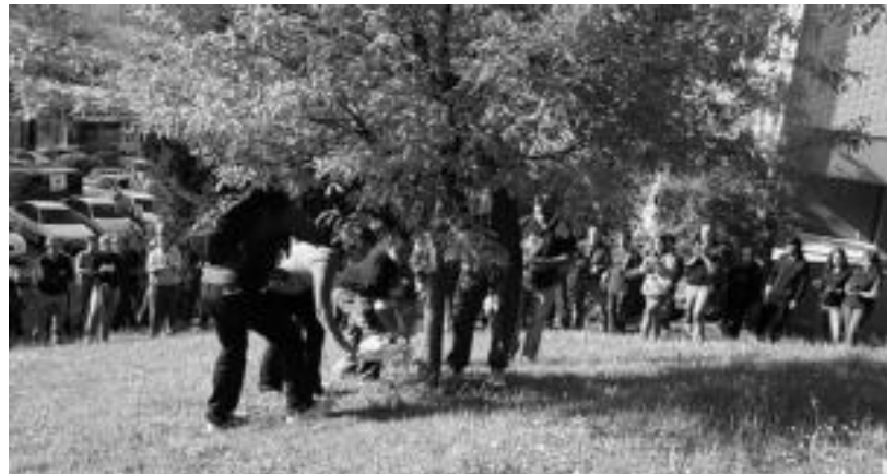
Tolosako Amartzuz auzoan omenaldia egin zuten «dispertsioak hildako» eskualdeko lau lagunei. I. GARCIA

Villabonan egin zuten ekitaldi nagusia. Bertan bertsolariek, musikariek, dantzariak eta txalapartariak hartu zuten parte. Gogoan izan zituzten espetxeetan hildako presoak eta errepideetan hildako senideak, batez ere eskualdekoak. Etxerategen kideek testigantza eman zuten sakabanaketak suposatzen duen «sufirimendua» inguruan eta beste behin salatu zuten sakabanaketa, «politika kriminala» deituz. Etxerategen ekitaldi nazionala antolatu du Durangon etzira eta bertara joateko deialdi ere luzatu zuten.