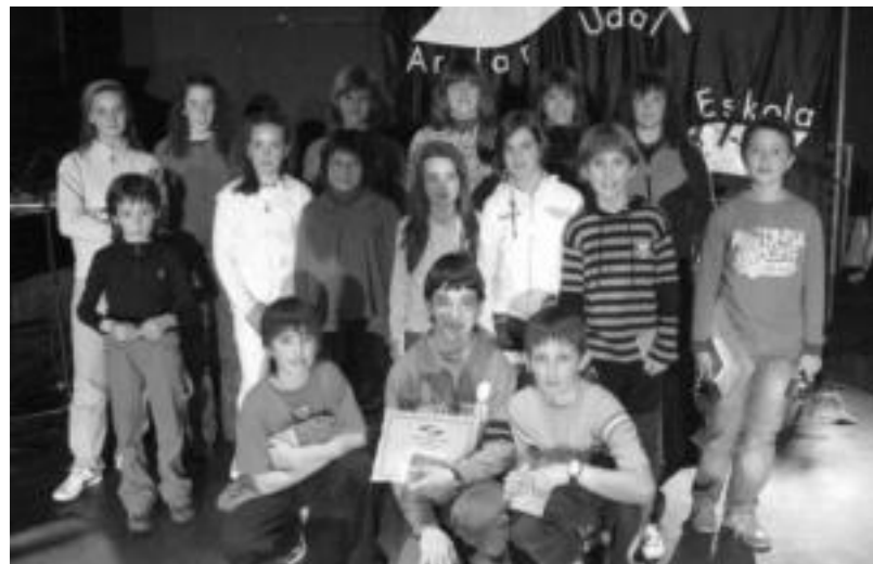
Iaz Satur Eleta Lehiaketaren III. edizioa jokatu zen. Aurten bezala, finalean hainbat leitzar eta aresoar egon ziren.