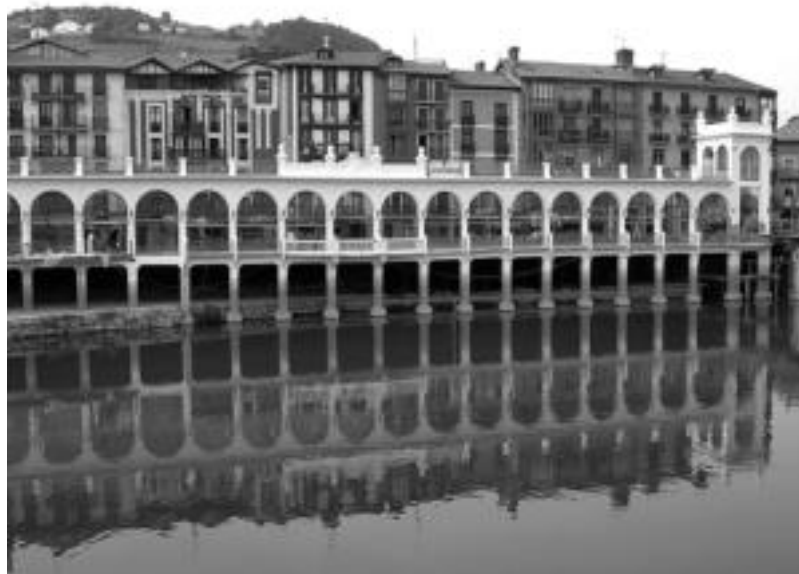
Alde Zaharreko eta Gorrotxategi Konfiteri Museoko bisitarien kopurua mantendu egin da.