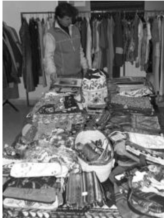
Merkatu Txikian jasotako dirua egitasmo desberdinetarako da. M. SOROA

Batetik Ekuadorreko Baba herriko bizi kalitatea hobetzeko egitasmo bat bultzatzeko bi diru ekarpen egin zituzten; iazko otsailan lehena, 8.360 eurokoa, eta azaroan bigarrena, 10.500 eurokoa. Eku-