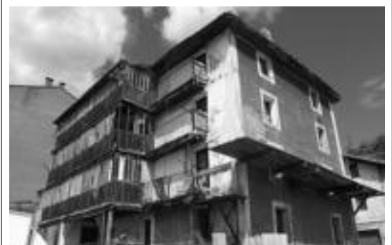
Beko-Bide eta Euskal Herriko eraikinak botako dituzte astelehenean. R. CALVO