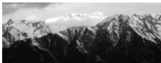
Pico Castanesa igoko dute igandean. HITZA

Oargi Mendi Elkarteak irteera antolatu du datorren astebururako, hau da, hilaren 24tik 26ra, Ixeia-Castanesara (Benasque). Ostiraletan Tolosatik Villanovara joango dira, eta larunbatean Aguja D'Ixeia gailurra (2.835m) igoko dute. Azken egunea, igandean, Pico Castanesa (2.856m) igoko