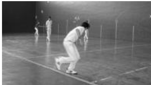
Urtero eginen dute txapelketa eta jarraitzaile ugari ditu. N. GARZIA

Aipatu behar da partidak joan eta etorrikoak izango direla, hau da, herri bakoitzak bi partida izango dituela, etxean eta kanpoan, eta partida gehien irabazten dituenak izango dela txapeladuna.