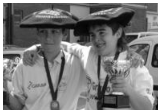
Bedaioarra eta belauntzarra garaikurra eskutan dutela.

Guztira 75 bat txirrindulari bilduko dira Alegian, txirrindularitza eskola desberdinetan banatuta. Eskolarteko probak eskualdeka egiten dira eta horregatik Tolosaldeko eta Goierriko txirrindulariak ariko dira etzi Alegian. Aurten ez da Alegiako txirrindularirik aterako, min hartuta dagoelako. Azken aldiz Alegian duela bi urte egin zen eskolarteko proba.