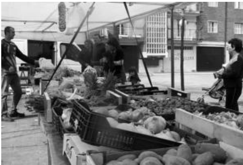
Bi astero arropa, oinetako eta maindire postuak izaten dira frutarenekin batera. Beraz, datorren astean. N. URBIZU