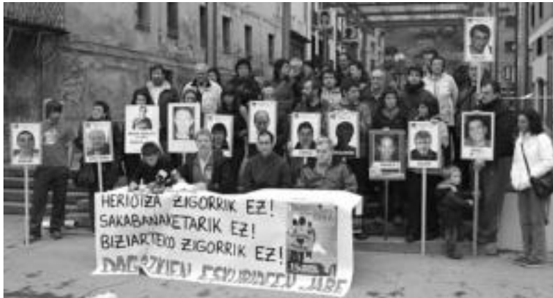
Eskualdeko Etxerateg eta AAMk Villabonan egindako prentsaurrekoaren une bat. I. GARCIA

Beste ekitaldi baterako deialdia ere luzatu zuten, hain justu, hilaren 19an Durangon (Bizkaia) egingo den ekitaldi nazionalerako. Egun horretan betetzen dira 20 urte «PSOEk eta PNVk martxan jarri zutela politika kriminal hori».