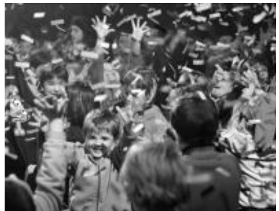
Leitzatik kanpo jarri dituzte 'Piratak' ikuskizuna ikusteko sarrerak. BARTOLA

Erleta Ikastetxeko Denok Bat Guraso Elkarteak eta Aurrera KEK, Leitzako Udalaren laguntzarekin, Piritx, Porrotx eta Marimotots pailazoen ikuskizuna antolatu du maiatzaren 13rako, asteazkena. Leitzako kiroldegian Piratak ikuskizuna eskainiko dute 18:00etatik