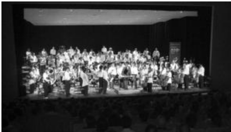
Leidorren ariko da etzi Euskadiko Ikasleen Orkestra. Irudian, Euskadiko Gazte Orkestra Leidorren, 2006an.

«Proiektu honen helburuen artean, gaur egun derrigorrezko hezkuntza eta hezkuntza musikal batera egin behar duten ikasleek motibatzeko zen, ikasle hauek ikastordua haundia jasan behar baitute bi hezkuntzak batera egiteko», dio