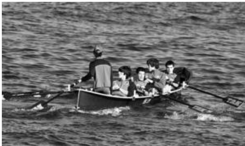
Batelen ligako 7 eta 8. jardunaldiak jokatu zituzteneko irudia, Getarian.