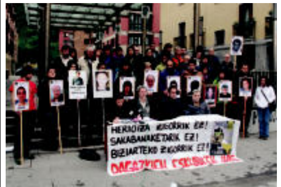
Agerraldia egin zuten Villabonako plazan. I.GARCIA

TOLOSA Leidor aretoan izango da; emanaldia hiru zatitan banatuta eskainiko dute 3