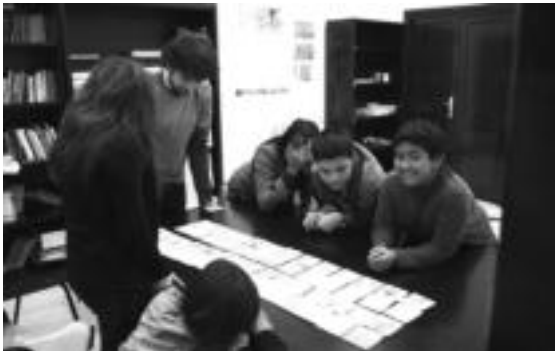
Ariketa ugari egiten dituzte jolasen bitartez. Kasu honetan, animalien dominon ari dira jolasen ikasleak.

Euskara » Ereite elkarte kulturantzak bultzatuta etorkinen seme-alabei zuzenduriko eskola bereziak ematen dituzte, astean behin, Tolosako Aitzol Udal Euskaltegian.