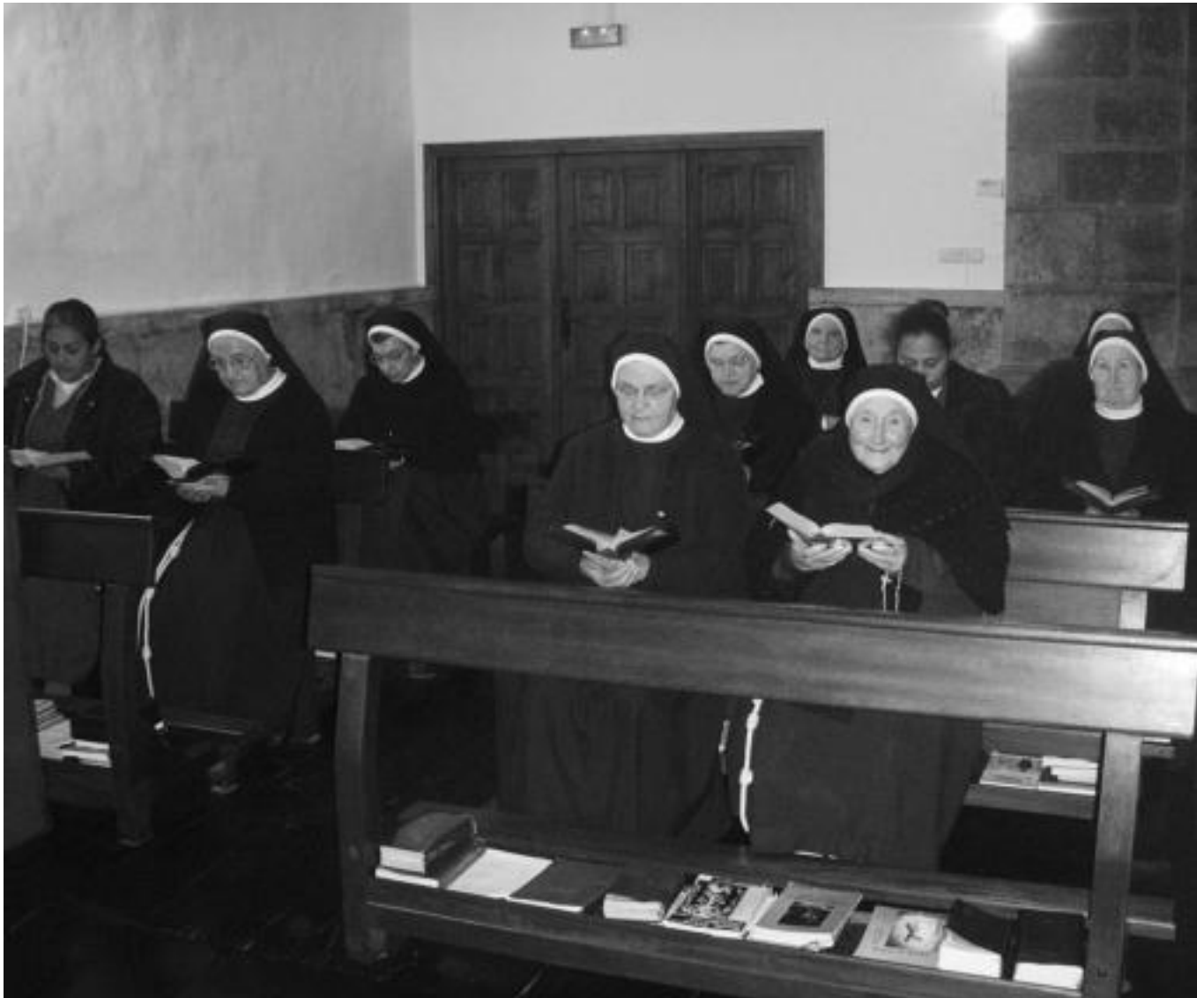
Santa Klara komentuko hamar moja errosario garaian, arratsaldean, elizan; falta den moja ohean gaixo dago. Egunean zehar askotan elkartzen dira otoitz egiteko. JOXEMI SAIZAR