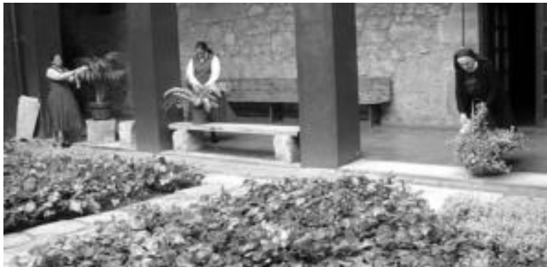
Honduraseko bi moja gazteak eta abadesa patrioko landareak zaintzen. J.SAIZAR

Bizimodu patsadatsu honekin pozik bizi dira Santa Klarako moja bere lau paretan artean. Aste Santuko egunak ere hala pasatuko dituzte, «festa giroan», elizkizun eta egitarau bereziarekin, jende gehiago hurbiltzen zaiela.