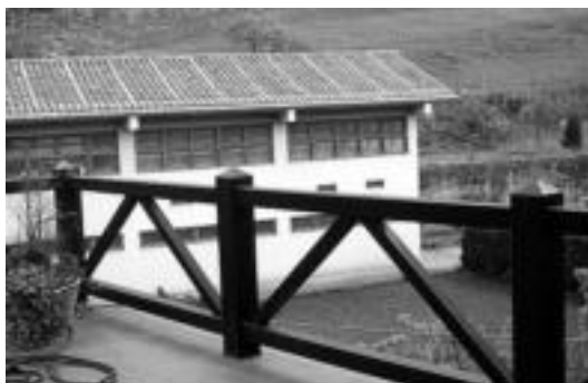
Terraza ederra eta animalientzko granja daukate barruan. J.SAIZAR