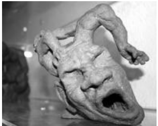
Urtziren eskulturak Hernialdeko Ostatuan: joan, ikusi eta gozatu. A. IMAZ

rasoren aurrean. Nafarroako Gobernuaren antzerkia sustatzeko martxan duen ekimenaren baitan kokatu zuten irakasleek atzoko emanaldia. Eskolako Tximista Taldeak eskaini zuen ikusizuna. A. IMAZ