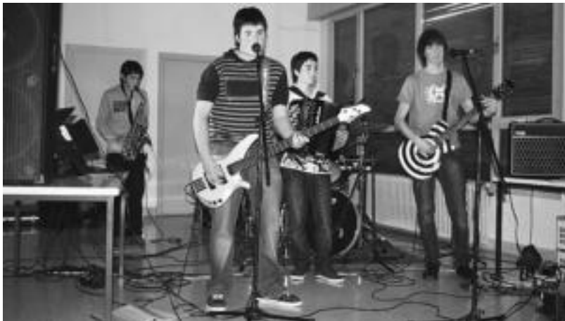
Leitzako Amazabal institutuan Euskararen Eguna ospatu zuten atzo kontzertu eta guzti. A. IMAZ