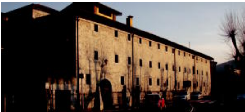
Klaratarren kongregazioa 1612tik dago Tolosan; Korreo kalean egon ziren eta 1966tik Zumardi Txikian daude. J. SAIZAR