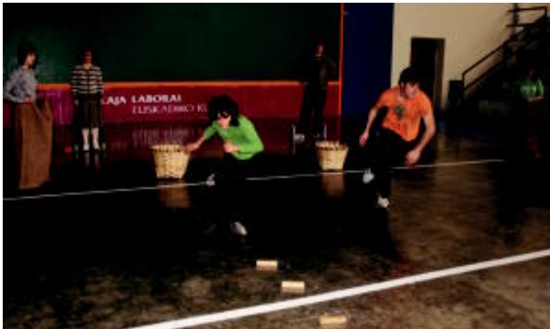
Institutuan Euskararen Eguna ospatu zuten atzokoan; ikasleek eta irakasleek hartu zuten parte. A. IMAZ