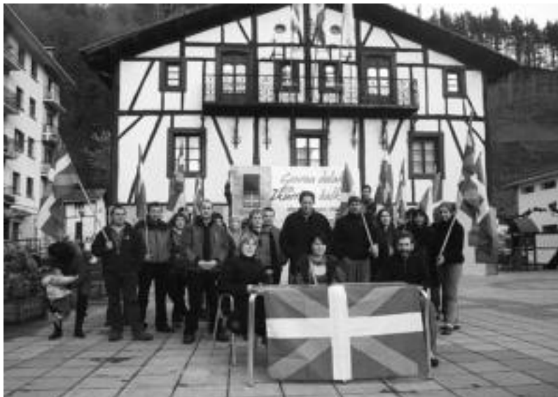
Tolosaldeko Bai Euskal Herriari herri ekimeneko hainbat kide elkartu zen herenegun iluntzean Lizartzako plazan. HITZA

Lizartzako Udaleko egoera ere salatu zuten: «Ez dugu Lizartzan gertatzen dena errepikatzerik nahi. Herriaren erabakia indarrez