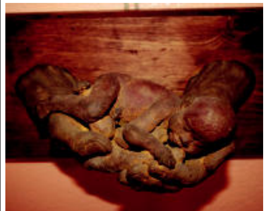
Eskulturak «ikusgarriak dira»; apirila osoan zehar izango dira ikusgai. A. IMAZ

TOLOSA Aste Santuen ospakizuna aitzaki, Santa Klara komentuko mojen egunerokoa ezagutu nahi izan du HITZAK gertutik 2-3