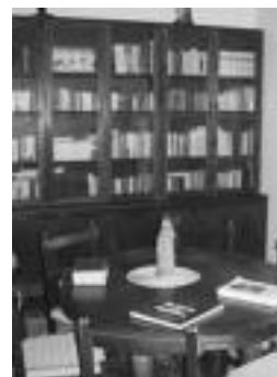
Komentuko liburutegia. J.SAIZAR