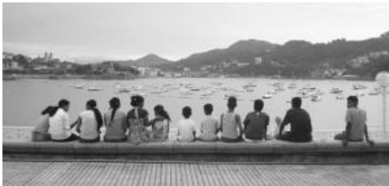
Bigarren argazki bozkatuena, berriz, hau izan zen; udan, Saharako umeak Donostian. ELIXABETE EIZAGIRRE

Aurreko edizioetan bidalitako argazkiak ere ikusgai daude Hitzaren webgunean. Irudiak atalean. Sartu eta ikusi urteetan zehar irakurleek bidali dituzten argazkiak. Zurea ere bertan ikusi nahi al duzu? Parte hartu orduan IX. Argazki Lehiaketan. Sari zoragarriak dituzue eskuragarri.