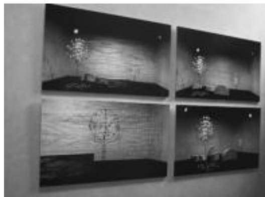
Azken 12 urteetan Arsuagak egindako lanak aurkitu daitezke Aranburun. E.E.