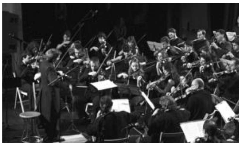
Orfeoia aurten Tolosan eskaintzen duen lehen kontzertua izango da hau.

Gabriel Faureren Requiem Re minorrean , Op. 48 requiem meza ezagunenetakoa bat da. Ederrenetakoa bat bezala jotzen da, eta ohikoa da abesbatza eta orkestrek interpretatzea. 1886 eta 1888 artean idatzi zuen eta lehendabiziko aldiz Madeleineko elizan interpretatu zuen, 1888an, hileta elizkizun batean, eta maiatzean, kontzertu gi-