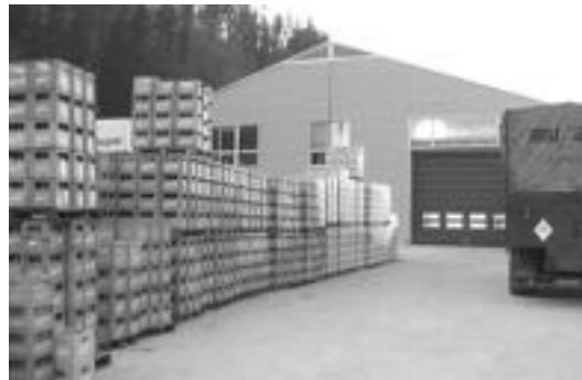
Insalus enpresak hipoteka ordaintzeko arazoak dituela dio. I. TERRADILLOS

«Ikuskariak horrelakoak eguneroko sartzen ari direla esan dugu