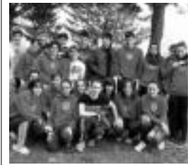
Tolosalde IKT-ko igerilariak. HITZA