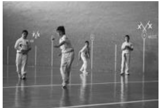
Euskal Herriko hainbat txapelketetan aritu dira leitzarrak asteburuan. N. URIBIZU

Trukean berriz, ikaslea etxean edukiko duten denboraren arabereko diru kopurua jasoko dute.