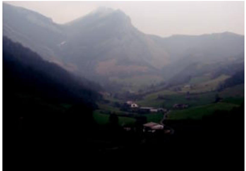
Behorlegi mendia igoko dute mendizaleek heldu den apirilaren 19an. HITZA

Hemendik jaitsierari ekingo diote Auxkira doan errepidea hartu arte. Behin baino gehiagotan gurutzatuko dute errepide hau Bo-