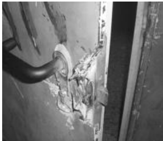
Horrela utzi dute lapurrek atea bertara sartu eta gero. ANOETAKO GAZTETXEA

Oraingoz ez dute aparteko ezer eraman, aurrekoetan bezala,