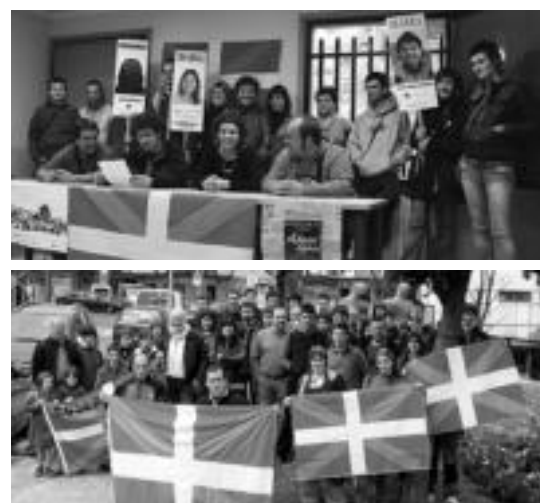
Ibarra eta Anoetan egin dute ikurrinak balkoietan jartzeko deia.

40 bat lagun bildu ziren Aberri Egunako ibilaldian parte hartzeko deia egiteko eta baita balkoietan ikurrina jartzeko eskatzeko egiteko ere; ikurrinak Itzuli tabernan eskura daitezke Anoetan.