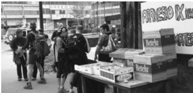
43 kilometro zeharkatu ostean, arratsaldean itzuli ziren parte-hartzaileak Amaroztera. IDOIA LAHALDAGA

Ibilbidearen hasieran, parte-hartzaile bakoitzari txartel bat eman zioten, kontrol gune bako-