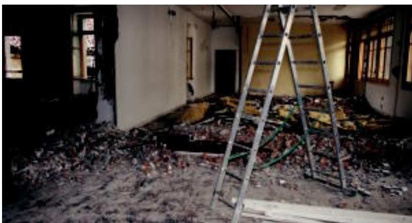
Bertan aurkitzen diren bulegoak, HITZArena tartean, lekuz aldatu dituzte lanak amaitu arte. A. IMAZ

IBARRA Irastorzari eta Igerabideri buruz ibartarrak eginiko ikerketa lana kaleratu dute 'Egungo euskal poesiaren historia' liburuan 6