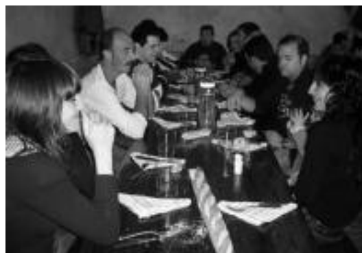
laz Petritegin izan ziren; aurten Astigarrako Rezolara joango dira. HITZA

tsona hauek datorren urteko apirilera arte aplikatuko liekete EREa. Larunbatean LABek deituta, elkarretaratzea egin zuten Trianguluan Insalus enpresako langileek; larunbatero egingo dute. N. URBIU