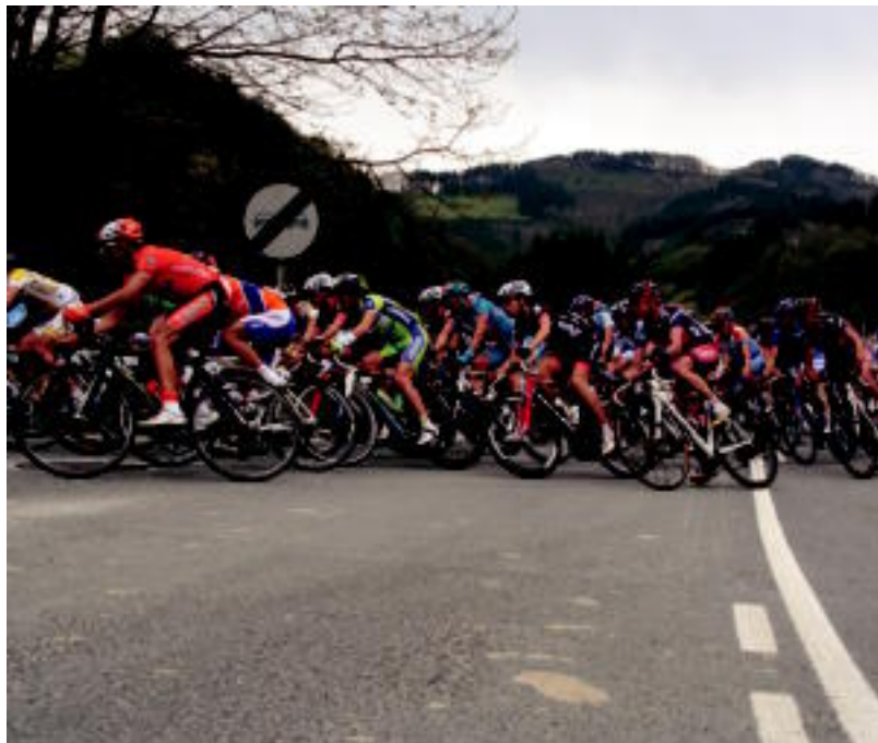
Alegia igaro eta Amezketa bidean igaro ziren txirrindulariak.

Goieritik abiatuko dira gaur berri baina pelotoieko txirrindulari batzuk eskualdean jarraitu zuten atzo. Hain zuzen ere, Astana taldeak Tolosako hotel batean egon da. Tartean, une honetan errepideko azkarrenak diren Contador edota Haimar Zubeldia daude taldean. Ikusmin handia piztu zuten, batez ere txikien artean; eurekin argazkiak ateratzen saiatu ziren hauek. Lasterketa apirilaren 11n amaituko da Zallan.