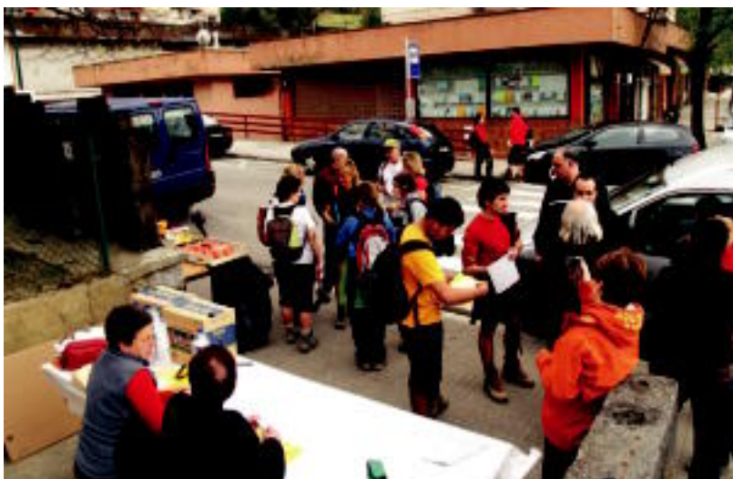
Parte-hartzaileek helmugan diploma jaso zuten eta indarrak berreskuratzeko aukera ere izan zuten. IDOIA LAHIDALGA