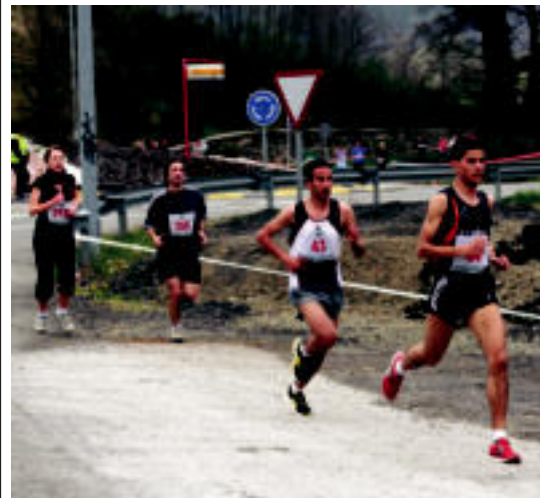
Mutilek eta neskek banatuta egin zuten lasterketa; irudian, irabazlea.