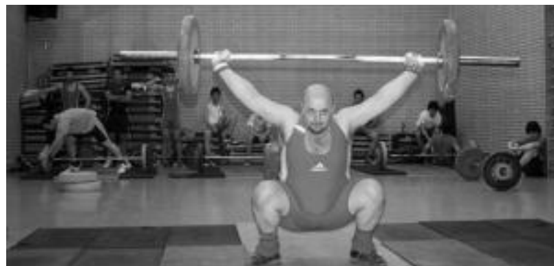
Danena-Olaederrako halterofilia taldeko pultsulariak bikain aritu ziren atzo Gipuzkoako Txapelketan. ASIER IMAZ

IRURA » Iruran Zuhaitz Eguna ospatu zuten atzo. Ikastolako ikasleek erai-kinaren inguruan zuhaitzak landatu zituzten eta ondoren merienda hartu zuten. Pixkanaka hazitzen ikusiko dituzte orain herritarrek... N.LATABURU