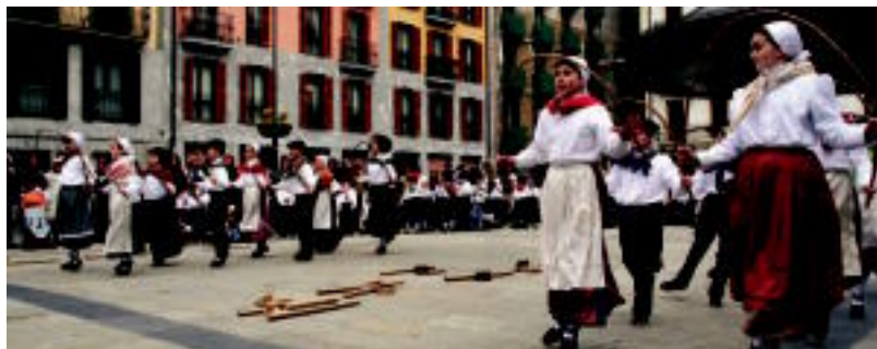
Dantzan hasi aurretik atsedean pixka bat har zezaketen dantzariak: ezkerrean Gasteizko neskato bat. Eskuinean, «Arkuen dantza», Udaberri taldekoen eskutik.