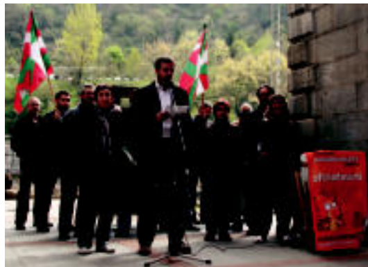
Atzoko prentsaurrekoan jendeak parte hartzera animatu zuten. NEREA URBIZU

Gaur zortzi, hau da, hilaren 12an Aberri Eguna ospatuko da. 1931. urtetik Euskal Herriaren eguna eta euskal herritarren eguna da, «aldarrikapen eguna». Bada, Tolosako ezker abertzaleak herritar guztiei bertan parte hartzeko deia luzatu zuen atzo Tolosan. Bestalde, Aldaketa garaia, burujabetza