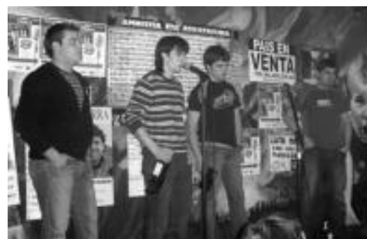
Altzoko taldean Laso, Etxorde, Adur eta Olano aritu ziren bertsoetan. ESTI EZEIZA