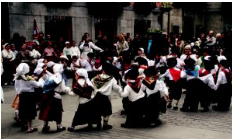
Txikiak dantza giroa herrian barrena barreiatu zuten; jende ugari bildu zen haien inguruan. N. URBIZU

TXIKIENEK EUSKAL DANTZAK ZABALDU DITUZTE TOLOSAN > 5