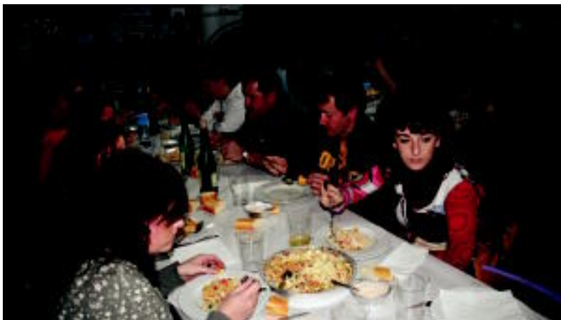
Desafioaren aurretik bazkaldu egin zuten Ibarra Gaztetxean bildu zirenek; giro ona sortu zen bertan. N. URBIZU

BERDINKETA Maila altua erakutsi zuten bertsolariek; puntu berdinak lortu eta hausturan irabazi zuen Alegiak > 6