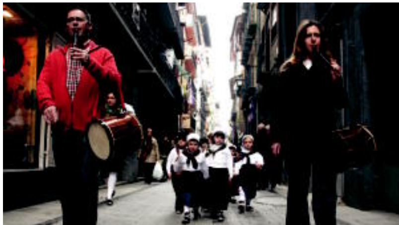
Goian Otsagiko mutilak. Behean, Udaberri taldeko txikienak txistulariez lagunduta. N. URBIZU