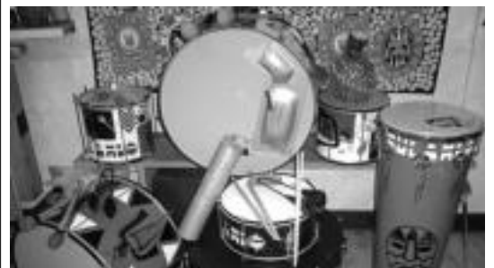
Afro-brasildar perkusio ikastaroa larunbat goizeetan izango da, MULAMBO

Guztira bederatzit taldek hartuko dute parte Azkoitia-ko txapelketa eta baita lau bikotek ere.