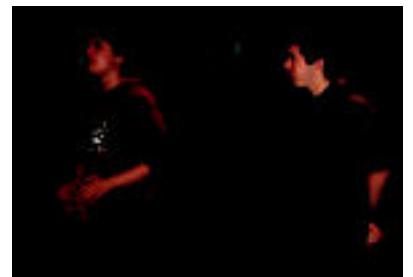
Dantza saioaren une bat; behean, ezkerrean, Ernioeako ikasleak bertsoan eta, eskuinean, Gaztelumendi anaiak. i.g.