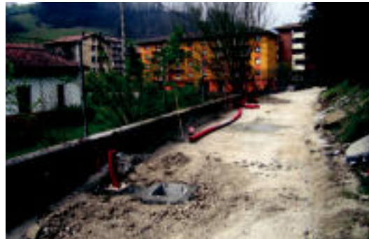
Eskuinean Amezketarako errepidea dago: paseorako bidea izango da ere. n.u.

Bide hau oinezkoentzat eta bizikletentzat izango da. Asmoa da