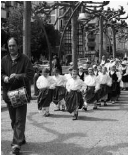
laz ere 300 bat haur bildu zen Dantzari Txiki Eguna ospatzeko, N. GARZIA

12:30ean Triangulon elkartuko dira eta denak batera, kalejira, Plaza Berrira joango dira. Goizaldeko egitaraua 13:00etan amaitu-