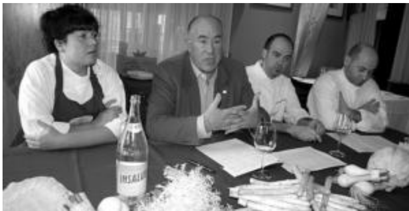
Atzo goizean aurkeztu zuten ekimena Udaleko eta Slow Foodeko ordezkariak. E. EZEIZA

Lehendabizikoa, nahiz eta hila-beteko lehen larunbata ez izan api-