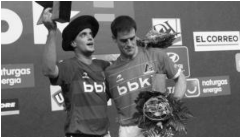
lazio finala errepikatzeke Barriolak eta Bengoetxea VI.ak bi partida irabazi beharko lituzkete. NAIARA GARZIA