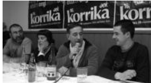
Adunaren egindako bertso afariaren une bat. HITZA

Batzordetik azaltzen dutenez, «jendea giroten hasia da jada». Hurrengo hitzordua gaur bertan izango da, Adunatik pasatzen baita Korrika. 12:45ean Uztartzako aparkalekuan bilduko dira denak