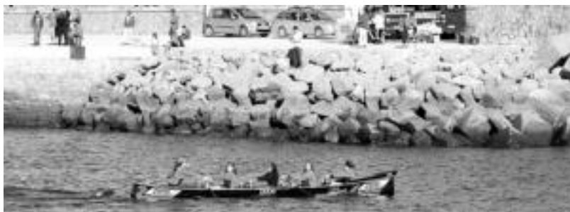
Tolosaldeko Arraun Klubeko nagusien mailako neskek. HITZA

tzaileetara, eta baita zuzendaritzako kideak ere; izan ere, denboraldi zaila izan da, hainbat zailtasun izan baititu trenatzerako orduan, ibaiaren handitzea eta kolektorearen obrak direla-eta», azaldu dute. TAKeko arduradunek arazo hauek ahalik eta azkarren konpontzea espero dute, eta ikastetxeek antolatzen dituzten estropadaketa Beleta elkarteak ur-