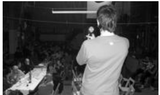
Altzok eta Alegiak jokatu duten finalerako sarrerak salgai. A. IMAZ