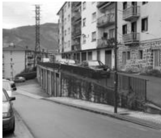
Julian Gaiarre kaleko traba arkitektonikoak kenduko dituzte. R. CALVO

Lanak datozen hilabeteetan gauzatuko dituzte eta gune honetako auzokideen bizi-kalitatea nabarmen hobetuko da Udalaren