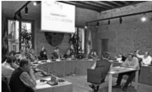
Herenegun Osoko Bilkuraren une bat. KLUSK

Terrorismoaren biktimei aitormen moral, politiko eta soziala egitea oraindik ere gainditu gabeko