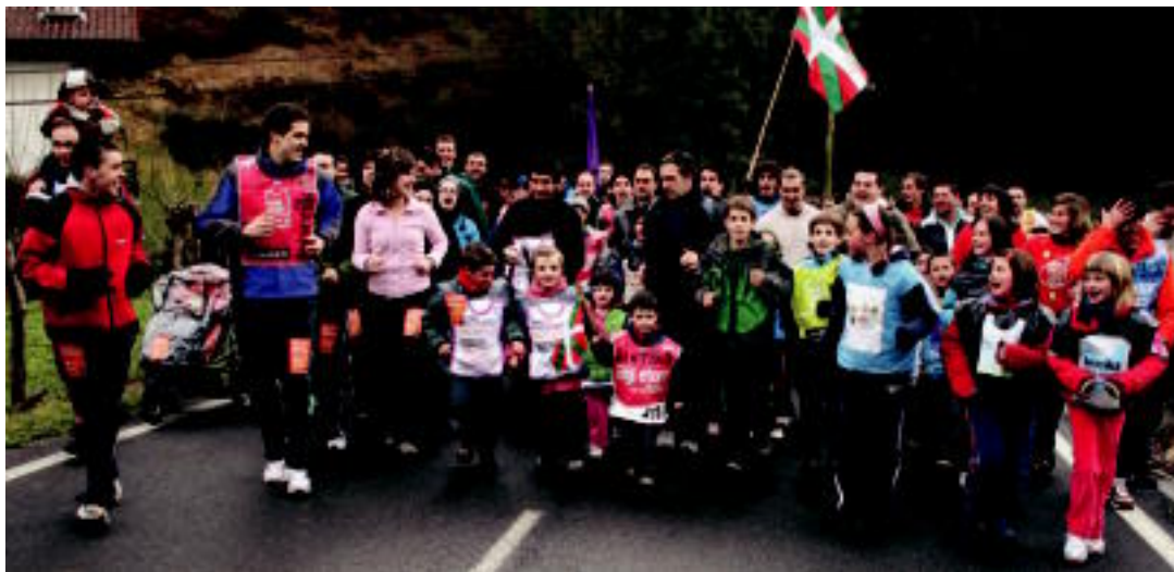
Herritarrek harrera beroa egin zioten Korrikari Leitza, pasa den larunbatean; Aresok lekukoa Basakabiruntz eramane zuten. A. IMAZ

HITZAK ez du bere gain hartzen egunkariaren adierazitako esaneri eta iritzien erantzunkizunik.