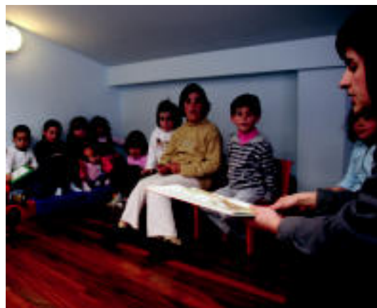
Edurne (irudian), M. Jose, Pili eta Izaskun gurasoak animatu ziren ipuinak kontatzera, atzo Bidegoianen. Nahia txikiak ere irakurri zuen ipuin bat. NURBIZU