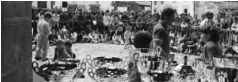
Sari banaketa oparoa egingen dute Herri Krosaren amaieran, 7 maila ezberdinetan irtego baitira korrikalariak. I. A.

Azken urteetan partaide kopuruak behera egin baldin badu ere, korrikalari ugari irtetzen dira Herri Krosean. 2006an 320 korrikalari irten ziren. XXIX. edizioan 291 eta iaz 280. Aurten ziur gehiago elkar-tuko direla irteera puntuan. Ez da ahaztu behar gauean Kroseko Aparie ere egingo dutela.