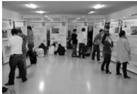
Alboan elkartearen erakusketa ikusten hainbat ikasle. HITZA

Oraindik, ordea, kanpainaren ekitaldi nagusia geratzen zaie Hirukiden, izan ere, etzi dute Elkartasun Jaialdia, 17:00etatik aurrera,