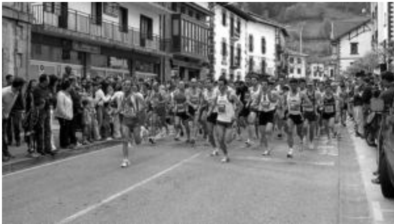
Leitzako Herri Krosean jende ugari bildu ohi da bai errepedean baita bide ertzean ere. JAIONE ASTIBIA