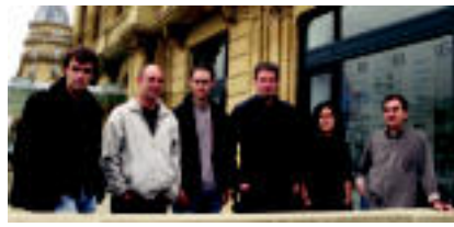
Bertso Jazzean arloko diren protagonistetako batzuk.

Euskara » 'Bertso Jazza' ikuskizuna izango da etzi, Leidor aretoan ikusgai; Musika eta bertsoa uztartzen dituen saioa da.