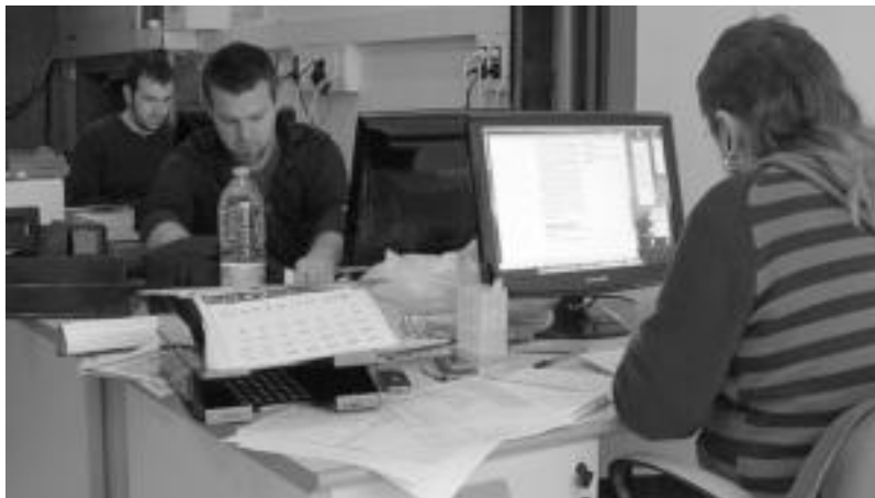
Astelehenean hasi zen erredakzio lan-taldea zortzigarren HITZA egiten. Interneten egongo da egunero irakurgai.