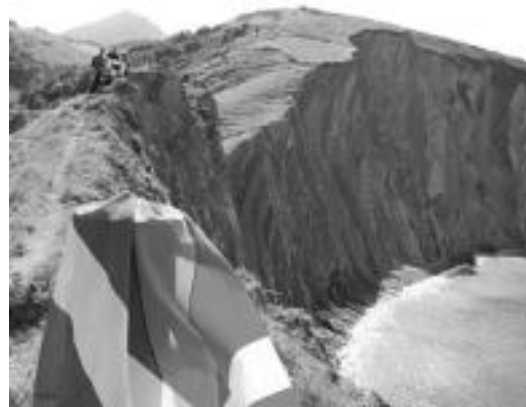
Zarauztik Debara egindako irteeraren irudia. A. IMAZ

Antolatzaileek esandakoaren arabera, ikurrinaren aldarrikapena ezinbestekoa da, izan ere, «Nafarroan ikur ilegala bilakatu nahi dute bandera espainiarrarekin