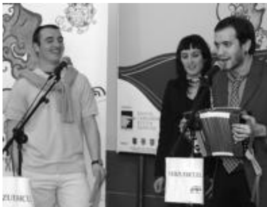
Lehen kanporaketan Gipuzkoa izan zen garaile, eta bigarrenean, Araba.

Iñistorra Biltzarren eta Aiurriren egoitzan, Kantoi tabernan eta Urnietan frutadendan eros litezke. Andoainen, Larramendi Bazkunaren egoitzan eta Stop eta Ernaitza liburudendetan. Villabonan, Basajaun liburudendetan eta Ogi-goxo okindegian. Telefonoz ere le-