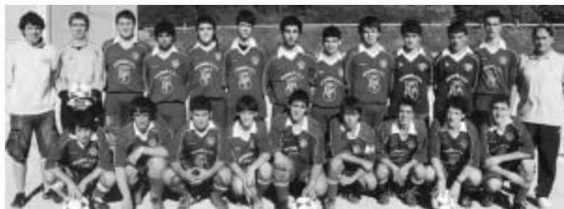
Jubenilen taldeak 6-2 irabazi zuten azken jardunaldian, lidertza duen taldearen kontra. P. RENOBALDES