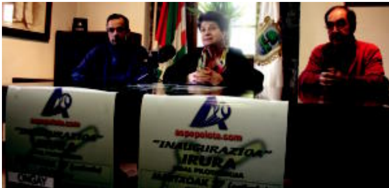
Atzo aurkeztu zuten jaialdia Olanu zinegotziak, Ugalde alkateak eta Gabellanes pilotari ohiak. R. CALVO