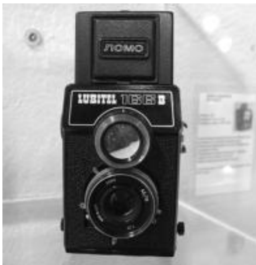
Eskopeta bat bezala egindako kamera eta errusiar jatorriko beste bat. I. GARCIA