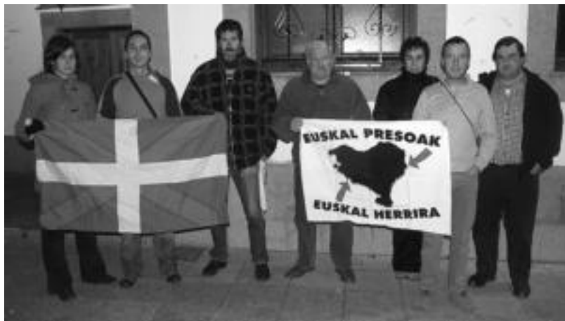
Leaburu-Txaramako hainbat herritar azken ostegunetan elkartzten dira 20:00etan Leaburuko plazan. HITZA