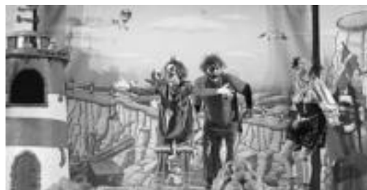
Ibarran jende ugari bildu zuten Pirritx, Porrotx eta Marimototsek. BARTOLA

Kalejira 14:30ean San Inazio auzoan amaituko da. Bertan, Bizi Nahi elkarteak, bazkaria egingo baitute. Ondoren, euskal kantua abestuko dituzte lagun giroan. Txartelak Zubiaurre, Atari eta Danon Txokoan aurkitzen dira salgai 15 eurotan.