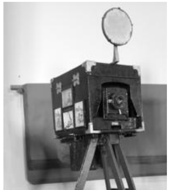
'Minutero' izeneko kamera, bezeroak apain jartzeko ispilu eta guzti. I. GARCIA