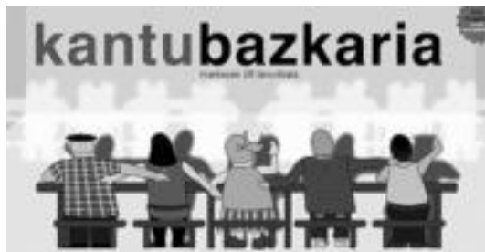
Larunbatean Bartola euskal kantak abesten arituko da. BARTOLAREN BATZORDEA