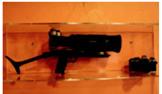
Eskopeta bezala egindako kamera dago ikusgai, besteak beste. I. GARCIA

IRURA Frontoiaren inaugurazioa egingo da ostiralean; Galarza V-Arruti Ongay-Galarza VI eta Titin-Laskurain Gonzalez-Barriola ariko dira 6