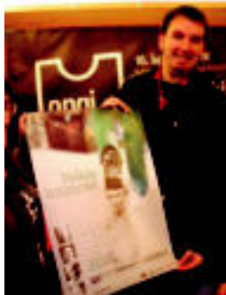
'Bidaia intimoak' otsailaren 7an aurkeztu zuten, Bilbon. HITZA

Euskara » Jon Maiak zuzendu duen dokumentalean lau euskaldunen bizipenak kontatzen dituzte, eta milaka lagunek bizi izan dituztenak islatzeko bidea ematen du.