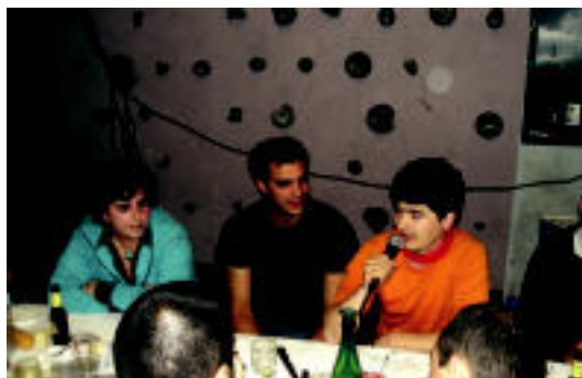
Bosgarren urteurrenaren harira, haurrentzat Xurdirin emanaldia eta bertso afaria antolatu zituen HITZAK, iaz.

abiatu zen Behe Bidasoako Hitzak. Familia ugaria da, dudarik gabe, tokiko euskarako egunkari hauen sare zabala.