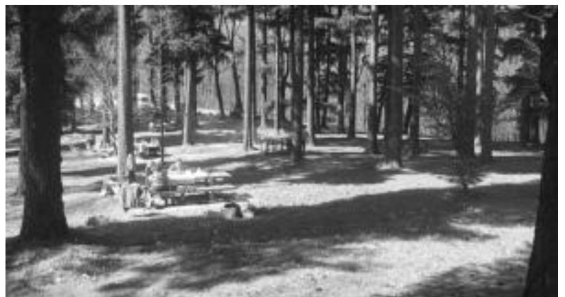
Alagian Languarre parkea San Jose egunean. Bertan jateko mahai proposak daude. I. GARCIA