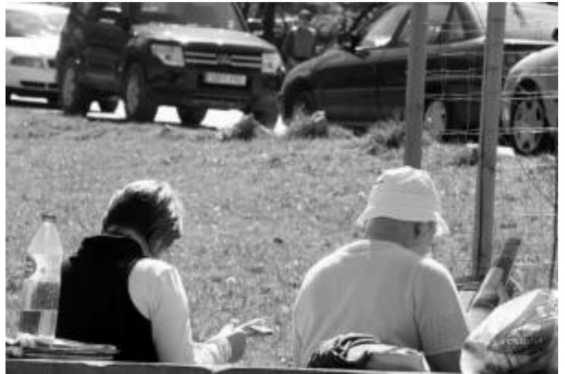
Larraitz, atsedanleku batzuentzat eta beste batzuentzat Txindokitik jaitsi ondoren, indarrak hartzeko lekua. N. URBIZU

Ez dute zalantzarik: Euskal Herria ezagutzera etortzeko gomendioa luzatuko dute euren herrialdean, «oso gustuko baitute».