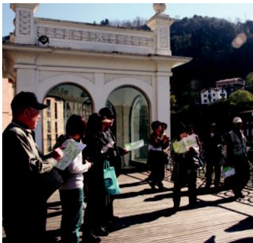
15 lagunek osatutako japoniar talde batek Tolosa bisitatu zuen atzokoan; Alde Zaharrean gidari eta guzti ibili ziren. E.E.

FUNTSEZKOA «Bizitzako ikasgairik zailena» dela dio, baina «maitasunez eta sentimenduz jokatzera» animatzen du 4-5