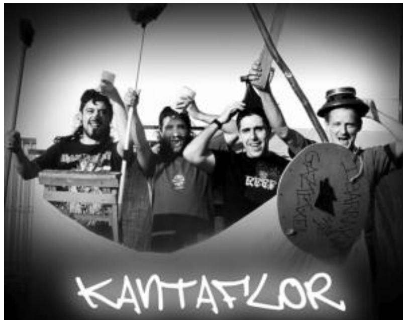
Kantaflor taldea bigarren diskoa grabatzen ari da; hurrengo kontzertua Txapin Festan izango da, Tolosan. AMAIA PAGOLA

Estilo pertsonala dutela argi dago beraz, bai musikari eta baita letrei dagokionez, baina jotzerakoan ere badute berezitasunik. Kontzertu