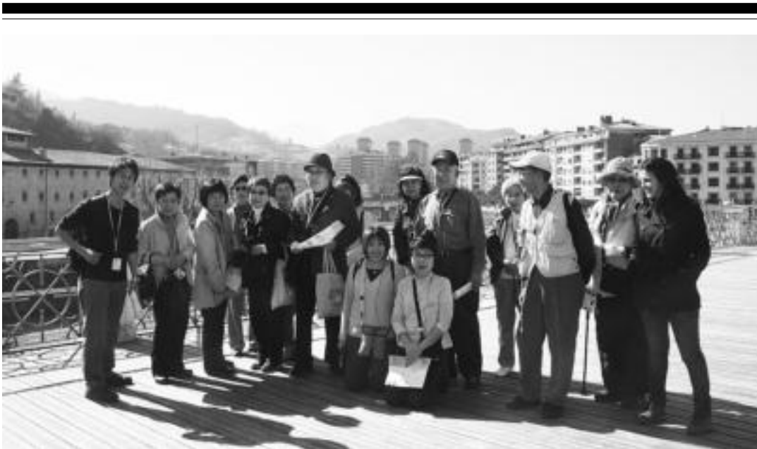
Tokioko bisitariak hiriguneako eta mendebaldekoak ziren: Euskal Herrian 9 egun pasatzera etorri dira eta atzo Tolosa bisitatzera etorri ziren. ESTI EZEIZA