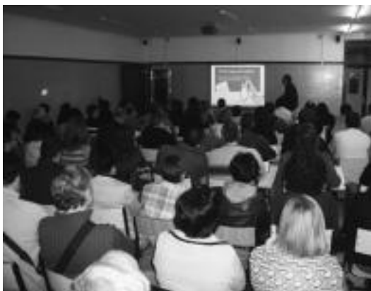
70 irakasle inguruk hartu zuten parte Jardunaldi Pedagogikoetan. HITZA

Konpetentzia digitala eta berrirakuntzako bidea gaiari buruzko hitzaldi batekin. Ondoren, partaideak hainbat tailerretan banatu ziren. Eskolapioen ikastetxeetan lantzen ari diren esperientzia ezberdinak ezagutzeko, Moodle plataformak, blogak eta irakasgaiak lantzeko