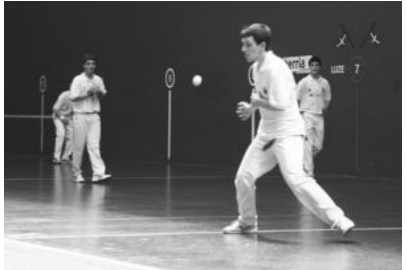
Apeztexea, sakea egiten. Aurrera-Saiazko jubentzek 22-10 galdu zuten. ESTI EZEIZA

Zazpi-Isturri jokalaririk hauek kantxaratuko ditu: kadeteetan Gallurralde-Jaka, gazteetan Olaetxea-Arzelus eta Ropon-Leunda nagusien mailan. Orain arte Elurbe aritu izan da maila honetan baina kanpoan da eta aldatuta egin behar izan dute amezketarrek. Aurtengo arma sendoa kadeteetan eta jubentzetan dauzkate eta