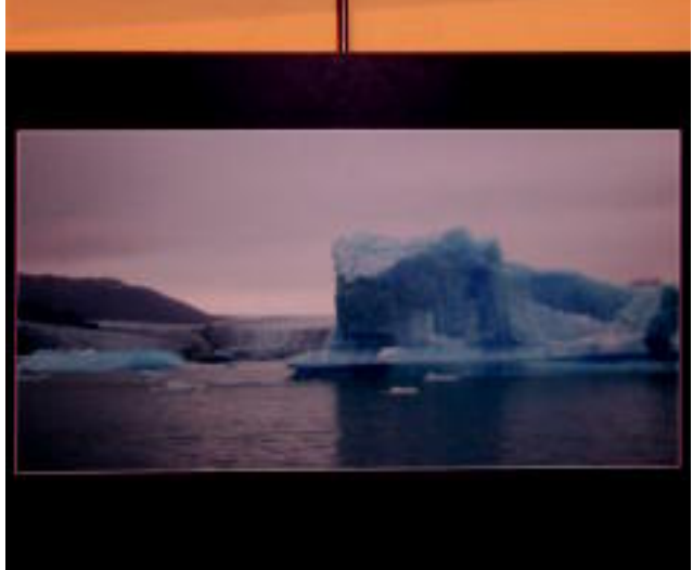
Peruko bi emakume, atsedean hartzen; eskuinean, Argentinako glaziarrak, eta ezkerrean beheran Mozambikoko gazte baten begirada bat. AINHOA ARREGI / AMAIA ARAMENDI / ARRATE ITURBE