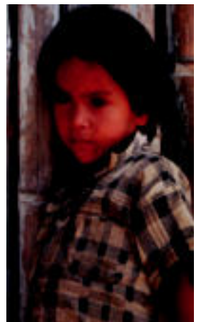
Ezkerrean, Mozambikoko hondartzan lanean. Eskuinean, Peruko haur bat. A. ARREGI / A. ARAMENDI / A. ITURBE