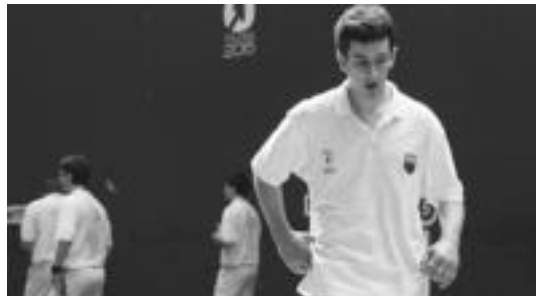
Apeztexea, partida bukatuta, haserre joan zen aldageletara. N. URBIZU

Hilaren 28an izango da Txapelketako finala, momentuz, Hernanin. 2004ko finala errepikatzen auzerik handiak daude: Zazpi-Isturri bihar irabaziz gero, aurrez aurre berriz Aurrera-Saiaz eta Zazpi-Isturri izango dira eta. Beraz, amezketarrek irabaztea falta da bakarrik.