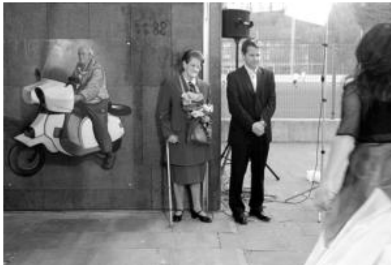
Alurr dantza taldekoek 'Agurra' dantzatu zuten, jende mordo baten aurrean eta irudi berriaren aurrean. N. URBIZU

izandakoa da ere. Jende askok izan du berarekin ikasteko zortea.