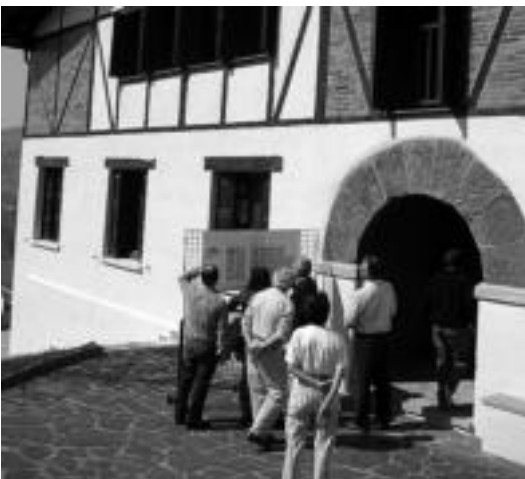
San Jose Eguna ospatu zuten atzo Belauntzan. HITZA

VILLABONA ● Aizkardi mendi elkar-teak 41. Ibilaldia antolatu du hilaren 29rako, iganderako, Andatza, Adarra eta Leitzaran inguruak zeharkatuz. Izena dagoeneko eman daiteke elkartearen bertan, 649 717 182 telefono zenbakian edota ibilaldia@aizkardi.com helbide elektronikoan. Bi ibilbide antolatu dituzte: ibilbide luzea (46 km, 10 ordu, 06:30ean abiatuta) eta motza (22 km, 5 ordu, 8:00etan abiatuta). Antolatzaileek gogorarazi dute egun horretan ordu aldaketa egongo dela.